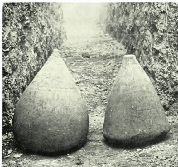
Ἄττική. Τράχωνες: α. Ἐρείπια βασιλικῆς, β. Ὁ μεταξὺ κυρίως ναοῦ καὶ νάρθηκος τοῖχος μετὰ τοῦ τριβήλου, γ. Οἱ δύο ὄξυπύθμενοι ἀμφορεῖς καὶ ἡ δοκιμαστικὴ τάφος