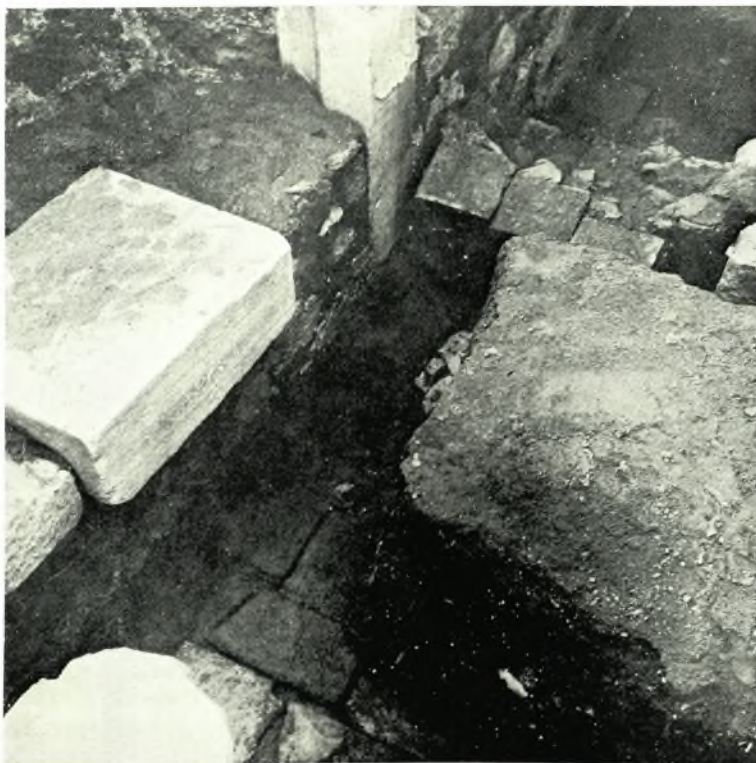
Ἀθήναι: α. Ἡ Ῥωμαϊκὴ Ἀγορὰ καὶ τὸ Τζαμί τοῦ Σταροπάζαρου (Φετιγιέ), β. Μεταγενέστεραι κατασκευαὶ ἐπὶ τῆς παλαιοχριστιανικῆς βασιλικῆς, ὑπὸ τὸ Φ. Τζαμί