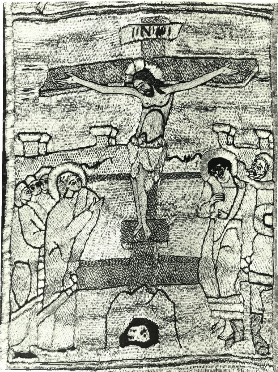
Βυζαντινόν Μουσεϊόν: Ὁράριον χρυσοκέντητον. Ἡ Σταύρωσις (λεπτομέρεια). 16ου αἰ. (Β.Μ. 4192)