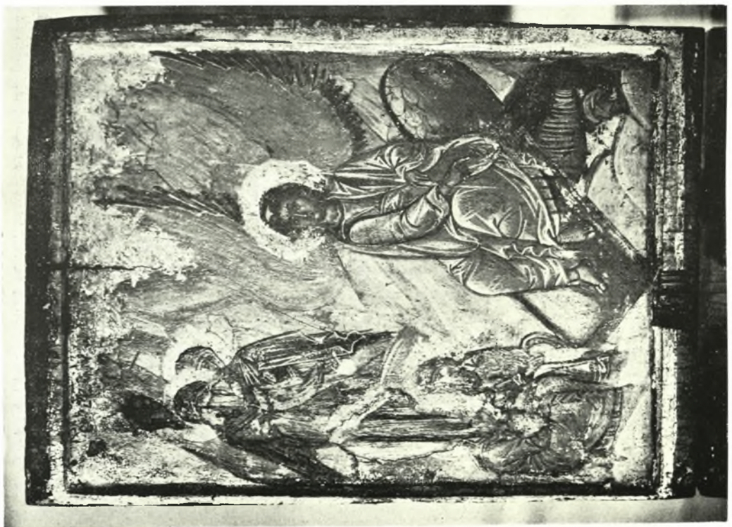
Βυζαντινόν Μουσεῖον: Δωρεά Ἀντωνοπούλου. Εἰκονίδιον. Αἱ Μυροφόροι πρὸ τοῦ μηνεῖου, 14ου - 15ου αἰ. (B.M. 4185), β. Τριπτυχὸν κλειστόν. Ὁ Εὐαγγελισμὸς. Κρητικὴ τέχνη 16ου - 17ου αἰ. (B.M. 4183)