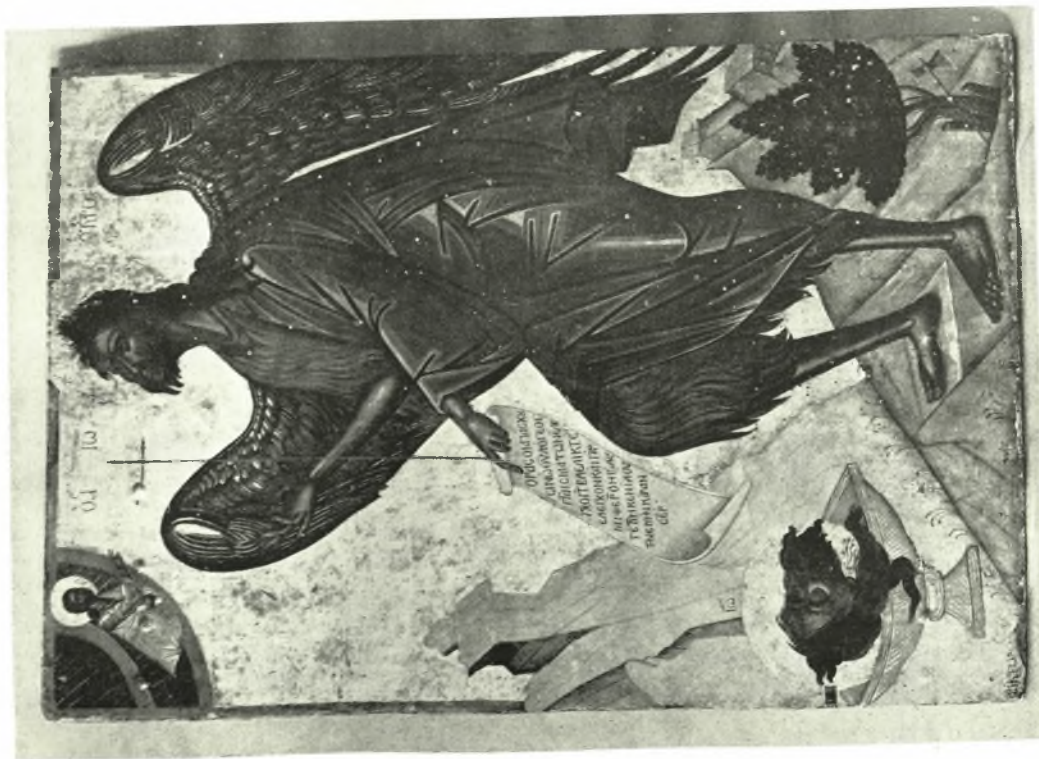
Βυζαντινόν Μουσείον: Δωρεά Ἀντωνοπούλου. α. Εἰκὼν Ἁγίου Ἰωάννου τοῦ Προδρόμου, Ὑπογραφῆ: Βικτωρός, 17ου αἰ. (Β.Μ. 4180), β. Ὁ Σπυρίδων συλλειτουργῶν μετὰ τῶν ἀγγέλων, Ἔργον Παν. Δοξαρᾶ(ς) (Β.Μ. 4187)