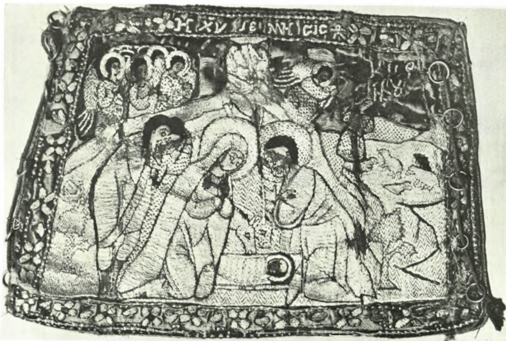
Βυζαντινόν Μουσεϊόν: α. Ἐπιγονάτιον χρυσοκέντητον. Ἡ Μεταμόρφωσις, 17ου αἰ. (Β. Μ. 4193), β. Ἐπιμάνικον. Ἡ Γέννησις τοῦ Χριστοῦ (Β. Μ. 4195)