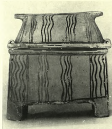
Ἀρχάνες : α. Κάτοψη καὶ τομὴ τοῦ τάφου, β. Κεραμεικὴ ἀπὸ τὸν τάφο, γ. Ἡ σαρκοφάγος Γ. ΣΑΚΕΛΛΑΡΑΚΗΣ