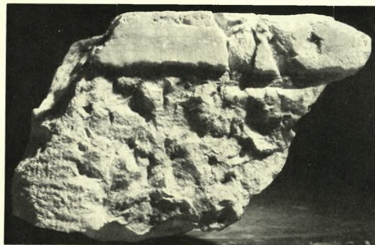
Ἐπιγραφικὸν Μουσαεῖον: α. Ἀριστερὸν τοῦ τεμαχίου μαρμάρου I τῆς ἐπιγραφῆς ἐν IG II 2 3897, β. Δεξιὸν τοῦ τεμαχίου μαρμάρου VI τῆς ἐπιγραφῆς ἐν IG II 2 3897