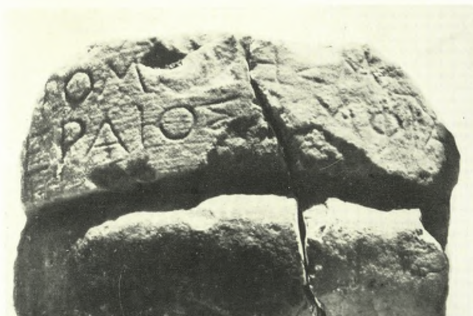
Μουσείον Ἀμφιαρείου: α. Ἐνω ὄψις τοῦ βάρου τοῦ φέροντος τὴν ἐπιγραφὴν, β. Ἡ ἐπιγραφὴ