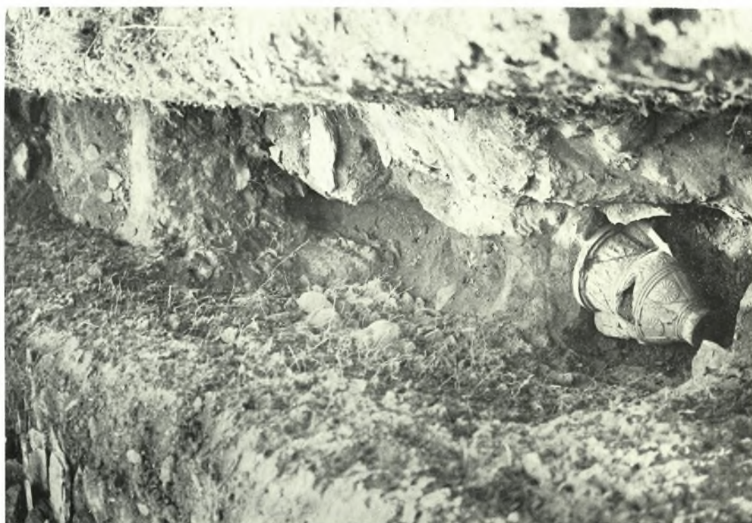
Σπάρτη: α. Ἡ τομὴ εἰς τὴν ὁποίαν εὐρέθη ὁ ἀμφορεύς. Δεξιὰ ὁ τοῖχος τῶν Βυζαντινῶν χρόνων καὶ εἰς τὸ βάθος τὸ ἄνω μέρος τοῦ ἑνὸς τῶν στομίων τοῦ κλιβάνου, β. Ὁ ἀμφορεύς εἰς τὴν θέσιν του. Διακρίνεται ὁ τρόπος μὲ τὸν ὁποῖον ἡ λαβὴ προστατεύεται ὑπὸ τῆς πλακῆς τοῦ δευτέρου στόμου καὶ ὁ λίθος εἰς τὸ στόμιόν του ΧΡ. ΧΡΗΣΤΟΥ