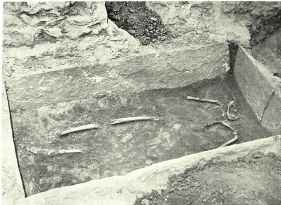
Σπάρτη: α. Εικών τοῦ χώρου ἀπὸ Β. Διακρίνεται ὁ τρόπος συντριβῆς τοῦ καλύμματος τοῦ δευτέρου τάφου ὑπὸ τὸ βάρος τοῦ τοίχου. Εἰς τὸ βάθος ἡ παιδικὴ ταφή ἐπὶ κεράμου, β. Ὁ δεύτερος τάφος μετὰ τὸν καθαρισμὸν. Διακρίνεται ἡ στροφὴ τῆς κεφαλῆς καὶ ὀλιγώτερον ἡ κάμψις τῶν ποδῶν