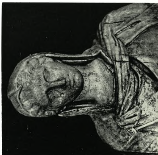
Στρατόνι της Χαλκιδικίης: α-γ. Λεπτομέρειες από το επιτάφιο άγαλμα του Στρατονίου