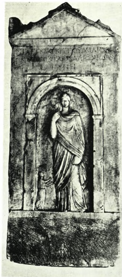
α. Τὸ πήλινο εἰδώλιο 16344 τοῦ Ἐθνικοῦ Μουσείου. β. Ἡ ἐπιτύμβια στήλη 2558 τοῦ Ἐθνικοῦ Μουσείου