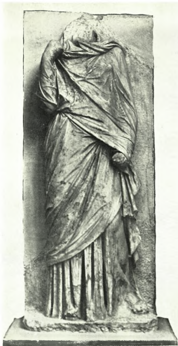
Στρατόνι τῆς Χαλκιδικῆς: α. Ἡ δέσποινα τοῦ Στρατονιοῦ, β. Τὸ ἐπιτύμβιο ἀνάγλυφο 1005 τοῦ Ἐθνικοῦ Μουσείου