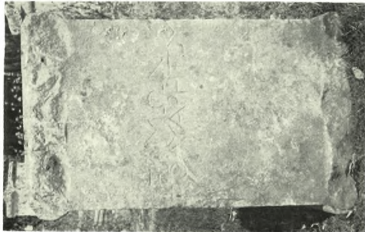
α. Θράκη. Ἐνεπίγραφος ἐπιτύμβιος βωμὸς (Μουσεῖον Κομοτηνῆς). β. Σάμος. Ἐνεπίγραφος βωμὸς (Μουσεῖον Βαθῆος)