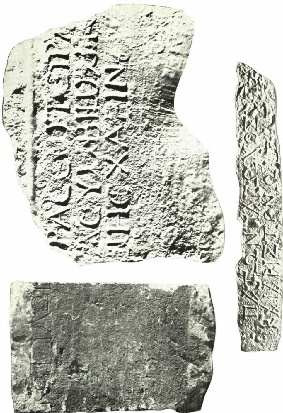
Κρήτη: α. Ἐπιτύμβιος στήλη Κοτύλου, β. Ἐπιτύμβιος στήλη Σωτείρας (ἐξ ἐκτύπου), γ. Ἐπιτύμβιος στήλη Πάγωνος (ἐξ ἐκτύπου)