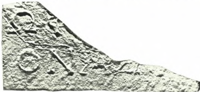
Κρήτη: α. Ἐπιτύμβιος στήλη (Εὐ)φρανίωνος (ἐξ ἐκτύπου), β. Ἐπιτύμβιος στήλη Ἰαερίωνος (ἐξ ἐκτύπου), γ. Ἀπότμημα ἐπιτυμβίου στήλης (ἐξ ἐκτύπου)