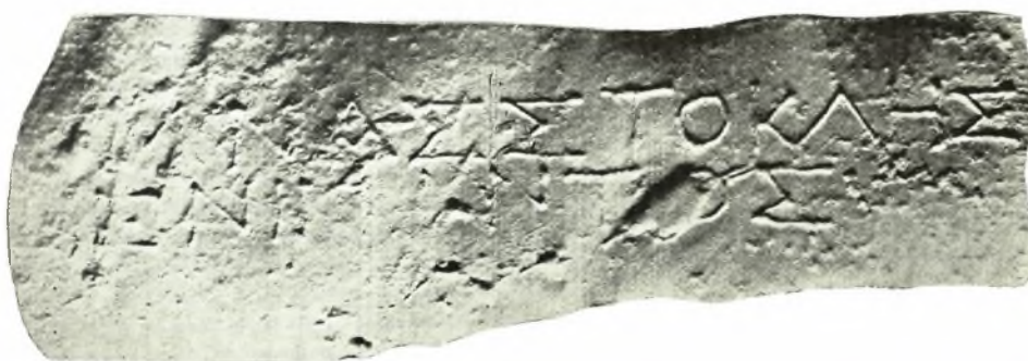
Κρήτη: Ἐπιτύμβιος στήλη Ἐπιχάρितος καί Ἀννίας (ἐξ ἐκτύπου), β. Ἀπότμημα ἐπιτυμβίου στήλης (ἐξ ἐκτύπου), γ. Ἐπιτύμβιος στήλη Μναστοκλέους (ἐξ ἐκτύπου)