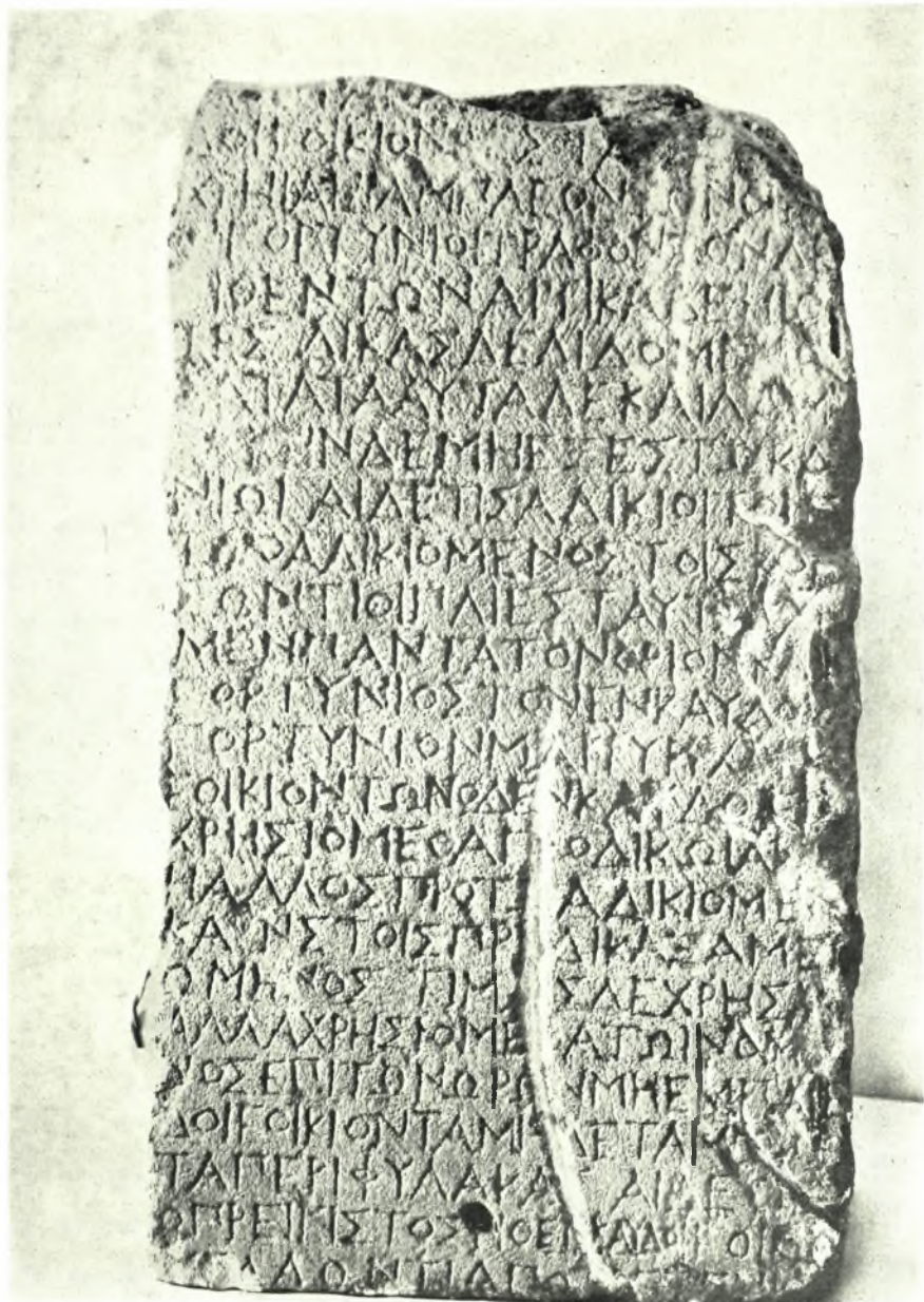
Κρήτη: Ἀπότμημα συνθήκης Γορτυνίων καὶ Καυδίων