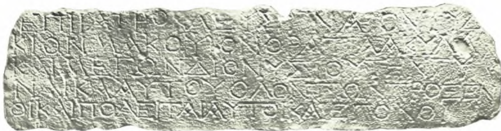
Κρήτη: α. Ἐπιτύμβιος στήλη Ἑρμέρωτος, β. Ψήφισμα Ὀρατίας καὶ Μέγωνος (ἐξ ἐκτύπου)