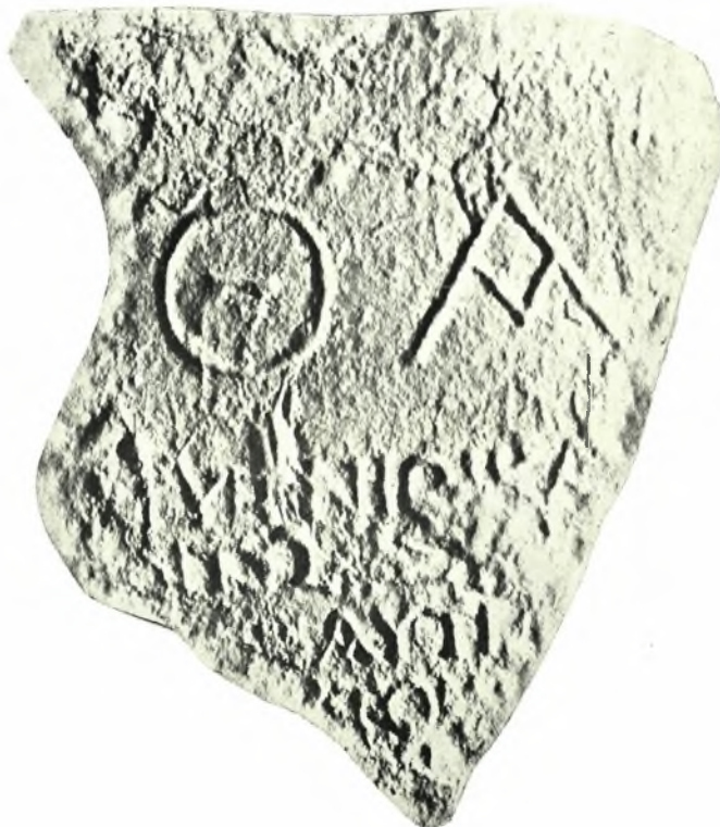
Κρήτη: α. Ἐπιτύμβιος στήλη Ἀρχαγάθης (ἐξ ἐκτύπου), β. Ἀπότμημα συνθήκης Λατίων καὶ Ἰεραπυρνίων (ἐξ ἐκτύπου)