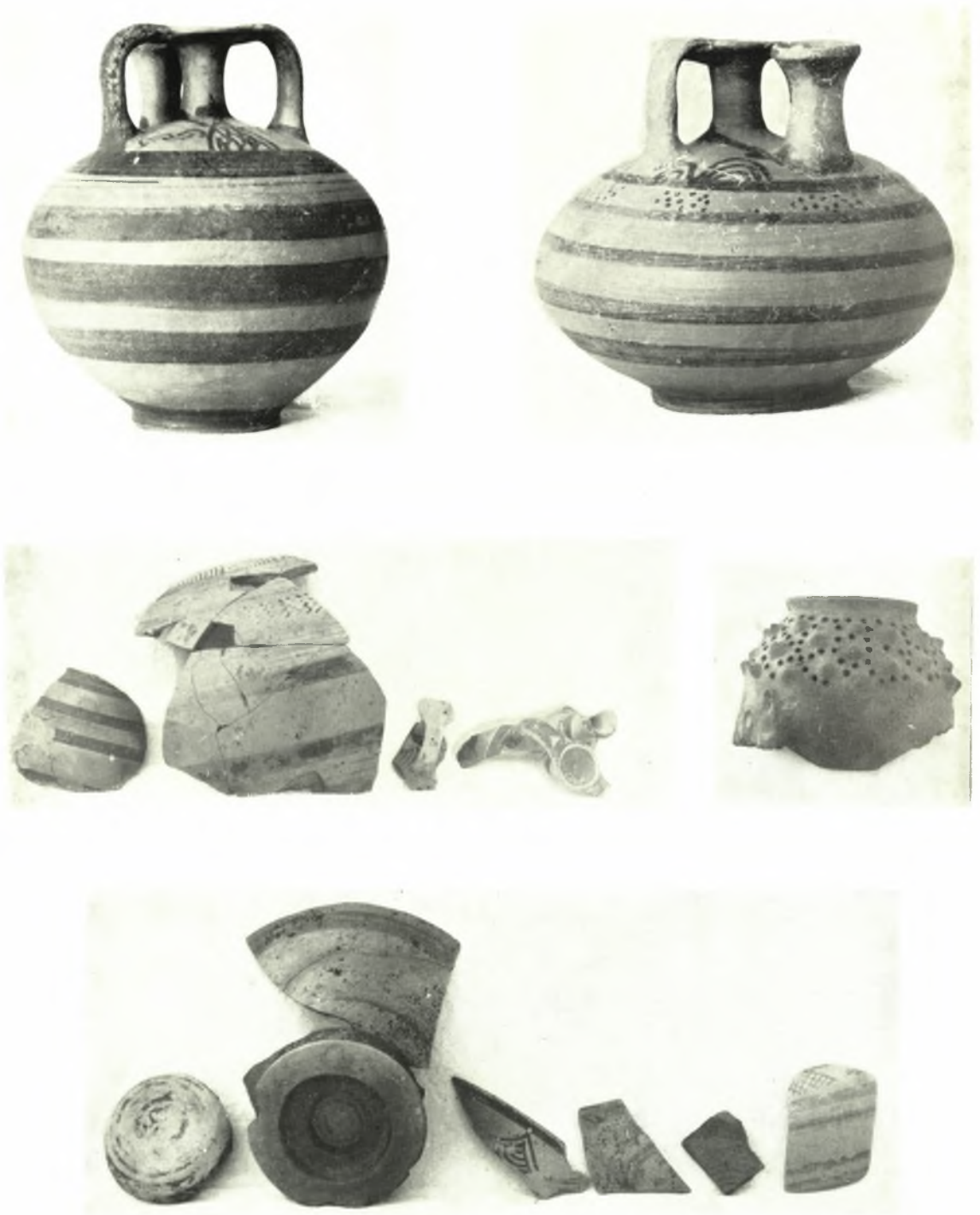
Ρόδος, Μυκηναϊκά ἀγγεία: α-β. Ἐκ Κοσκινοῦ, γ-ε. Ἐκ τῆς μυκηναϊκῆς ἀκροπόλεως τοῦ Ἀρχαγγέλου ΣΕΡ. ΧΑΡΙΤΩΝΙΔΗΣ