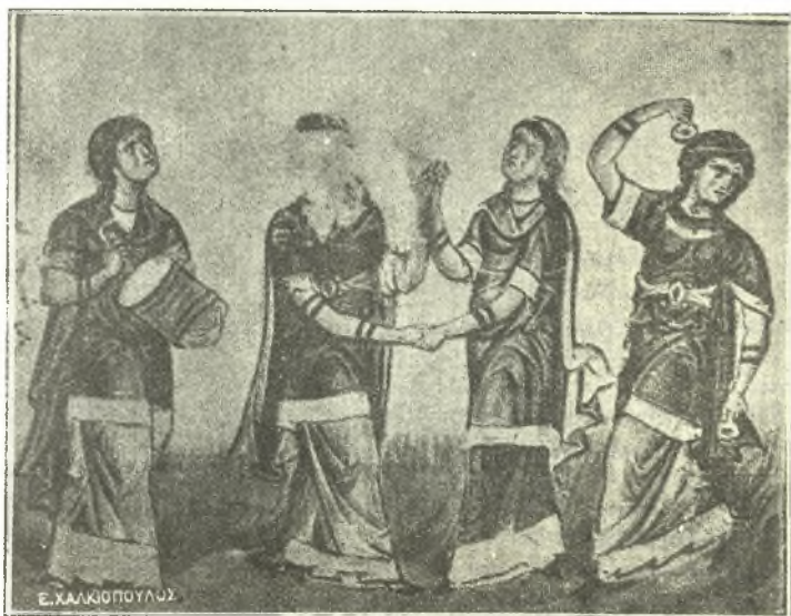
Ἐκ τῶν διασεδάσεων τοῦ γόμου.

“Ὅπως ἂν ἔχη, τὰ μεσαιωνικὰ ἐπιθαλάμια, τοὺς κανόνας τῶν ἀρχαίων