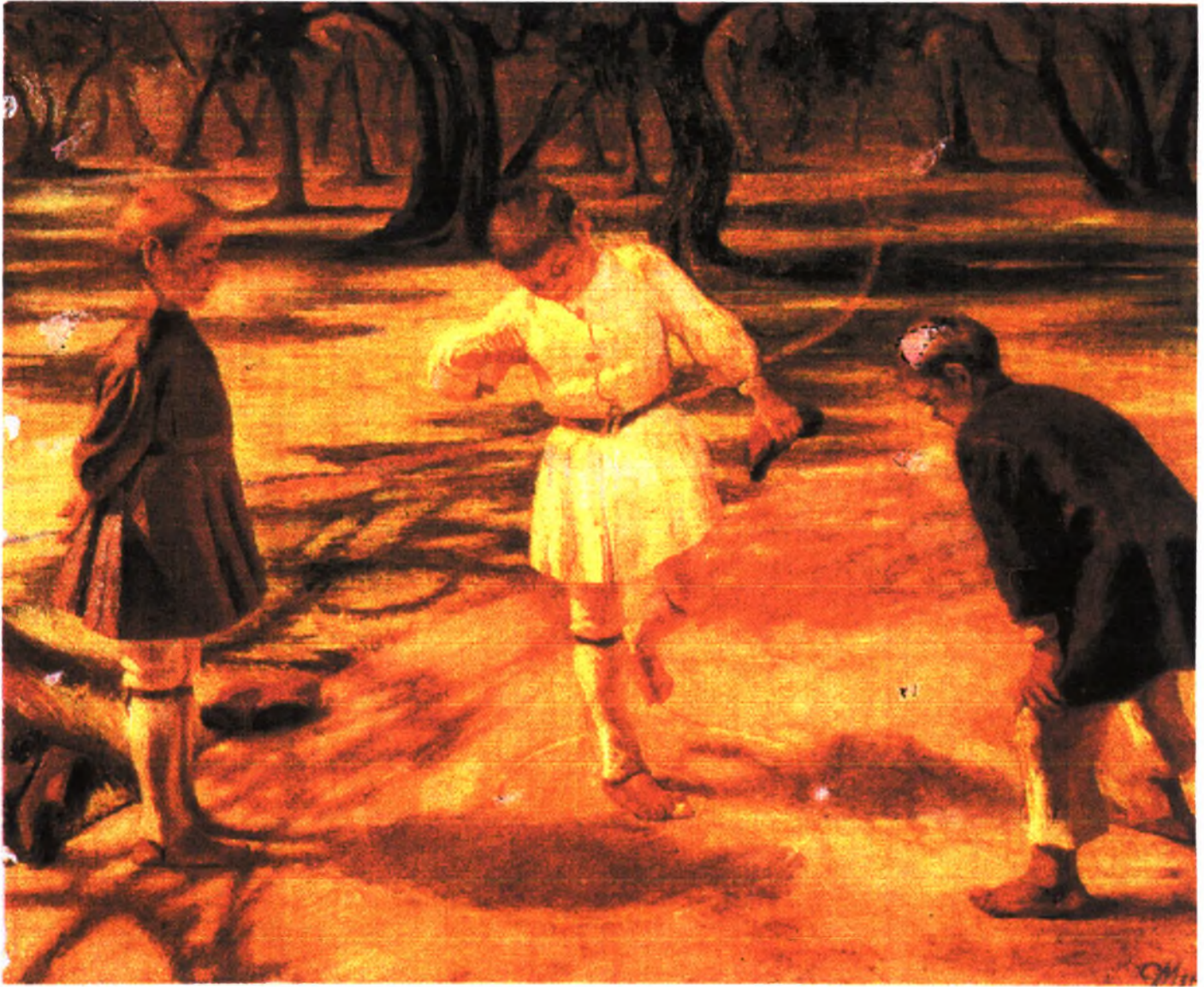
Ζ. Γ. ΜΠΡΑΣΑΣ: Σαλίκαρος. Λάδι. 120x87 εκ.