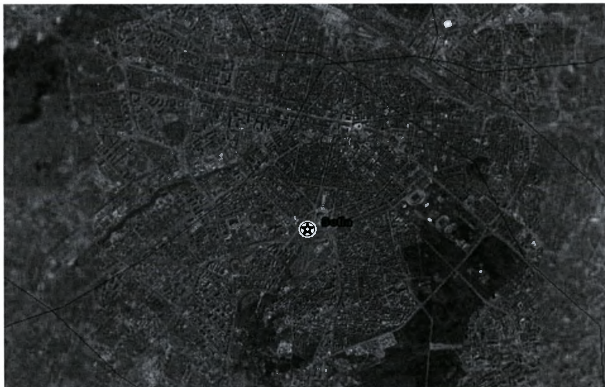
Μητροπολιτική περιοχή Σόφιας