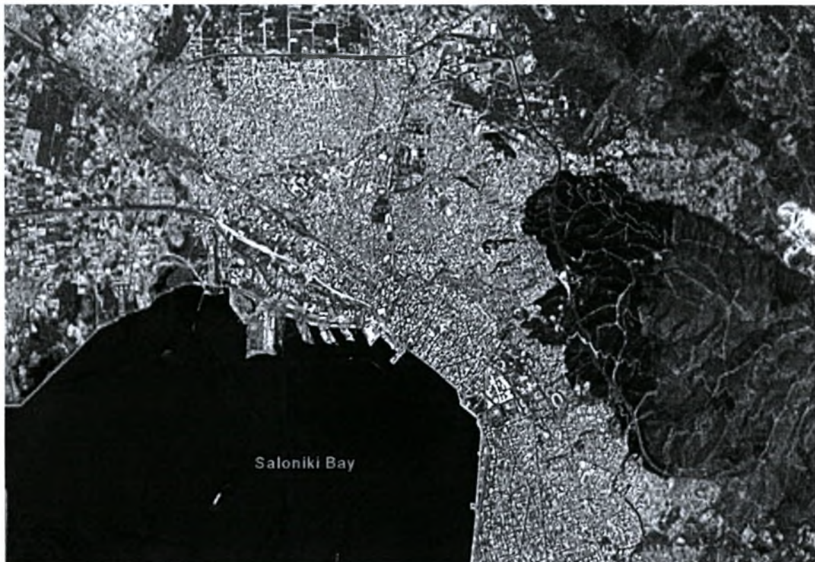
Μητροπολιτική περιοχή Θεσσαλονίκης