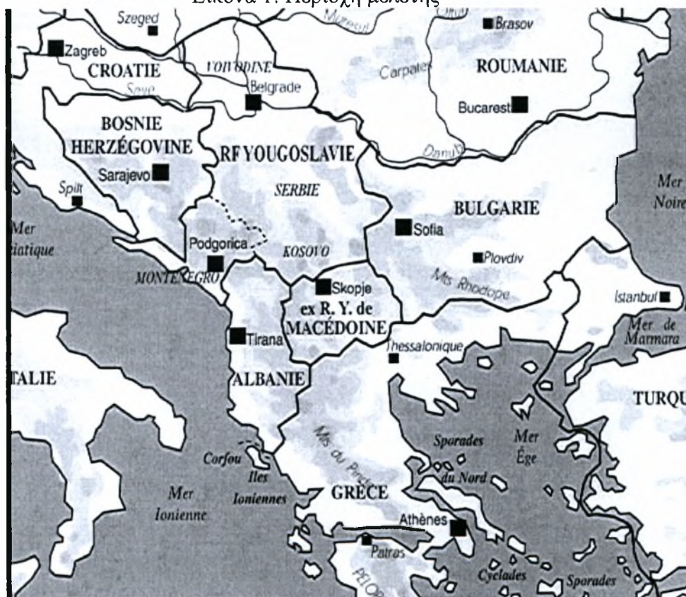
Εικόνα 1: Περιοχή μελέτης