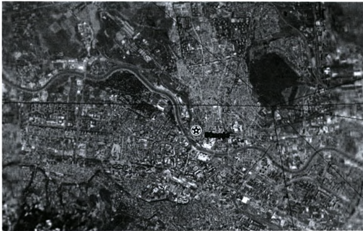
Μητροπολιτική περιοχή Σκοπίων