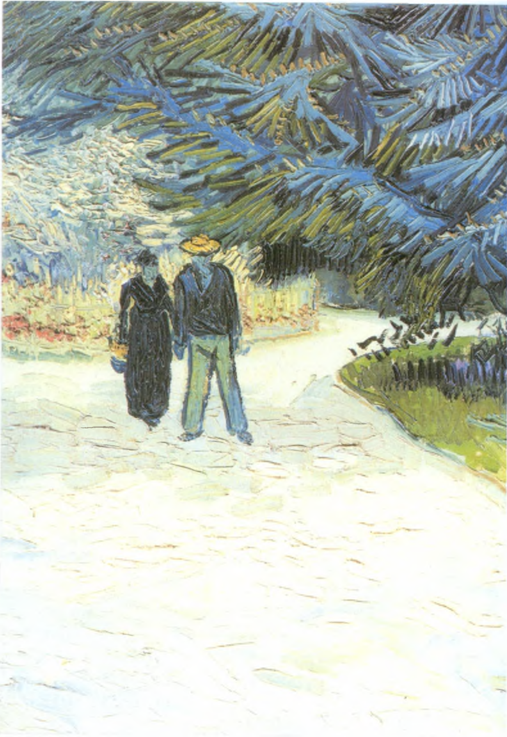
ΖΕΥΓΑΡΙ ΣΤΟ ΠΑΡΚΟ, Βαν Γκογκ