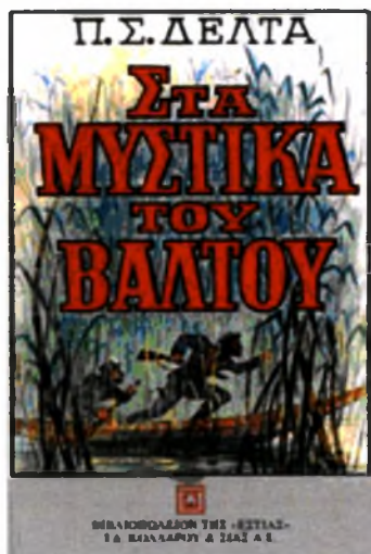
Τα Μυστικά του Βάλτου