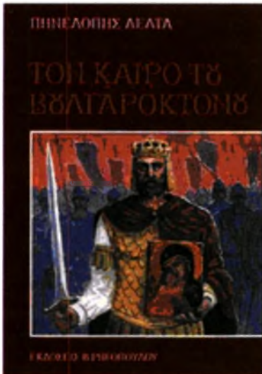
Τον καιρό του Βουλγαροκτόνου