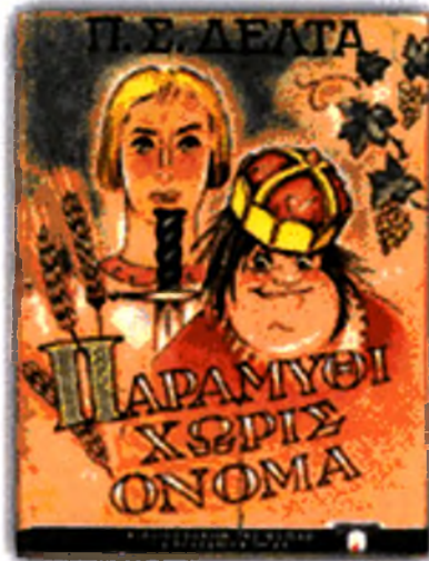
Παραμύθι χωρίς Όνομα