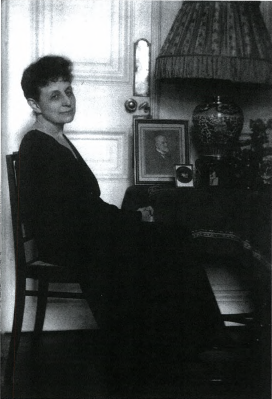
Η Πηνελόπη Δέλτα φωτογραφημένη από τη Nelly's τη δεκαετία του 1920.