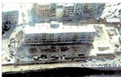
Το ξενοδοχείο Ξενία.

Τι συμβαίνει στο Ηράκλειο; Ένα παράδειγμα για τις διαφορετικές νοηματοδοτήσεις της έννοιας του Μνημείου αποτελεί η υπόθεση Ξενία , το οποίο μετατράπηκε από ξενοδοχείο πλατεία και τώρα μετατράπηκε σε...καντίνα!