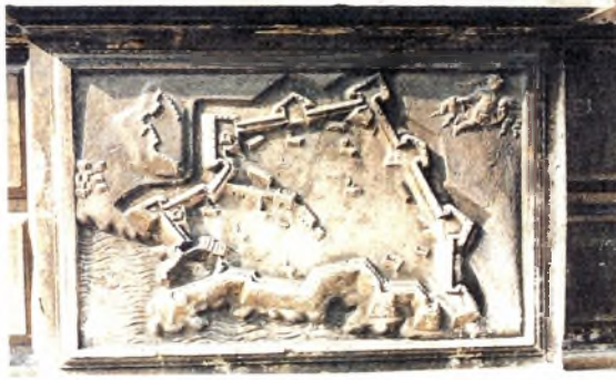
Ανάγλυφο στην πρόσοψη της εκκλησίας της Santa Maria Zobenigo στη Βενετία. Δείχνει τα τείχη του Ηρακλείου, το λιμάνι με τα νεώρια και το Φρούριο της Θάλασσας-Κούλε, το παλαιό τείχος και την πύλη Voïtopε, ναούς, μνημεία και κρήνες της πόλης. Και σπηχτεί την υπερηφάνεια των Βενετών για την πρώτην μετά την πρώτην πόλη της Γαληνοτάτης Δημοκρατίας.