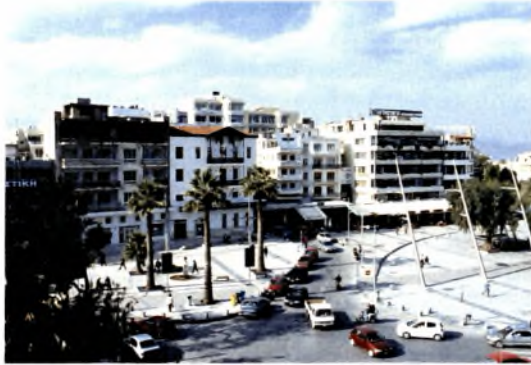
Η σημερινή πλατεία Ελευθερίας

Τα παραπάνω γεγονότα αλλά και διάφορες ακόμη μικροεπεμβάσεις, σε συνδυασμό με τη γενικότερη εξέλιξη της πόλης αλλά και τις νέες αντιλήψεις για τα ιστορικά κέντρα των πόλεων, «ωρίμασαν», την άποψη ότι η πόλη χρειάζεται ένα γενικότερο κανονιστικό πλαίσιο που θα ρυθμίζει τα σχετικά θέματα.