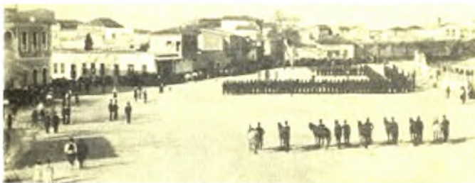
Η πλατεία πέντε ελαιόδεντρων – Τσάσι Κανάρι – το 1889. Ο Τούρκος γενναύτης (στρώμα) είναι ο Άγιος Μάρκος. Μικρή φιλική ομάδα και οι στρατιώτες της 25ης Αυγούστου. 1920 οι Έλληνες στρατοί διαμαρτυρούνται για την κατάληξη της πρωτεύουσας Τουρκοκρατίας. Η Κρητική Στιγμιότυπη στη Λύση του Στάλ 2 Σεπτεμβρίου 1888 αποτελεί το κλασικό έργο στα Άρκενελ και ο Τσάσι Κανάρι Τούρκος στρατός εγγράφησε αρχικά τον Κρητικό φως. Αρχείο Εθνικού Μουσείου, Μουσείο.

Τα σημαντικότερα κτήρια ευρίσκονταν στη Ruga Maistra, το δρόμο που εκτεινόταν από το λιμάνι μέχρι την Piazza delle Biade. Ήταν η Loggia, το Palazzo του Capitano Generale και του Governatore. 10