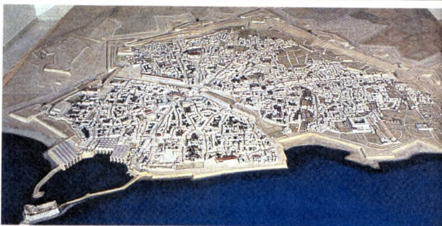
Ολική άποψη της μακέτας του Χάνδακα, που εκτίθεται στην αίθουσα «Α. Γ. Καλοκαιρινού» του Ιστορικού Μουσείου (φωτ.: Αρχείο Ιστορικού Μουσείου Κρήτης).

Τα δίπολα: ομοιότητα – διαφορά και ένταξη – αποκλεισμός ακολουθούν την ελληνική ταυτότητα. Όμως η Ελλάδα είναι ίσως η μοναδική ως προς το βαθμό στον οποίο η χώρα στο σύνολο της έχει υποχρεωθεί να παίζει ταυτόχρονα τους δύο αντιτιθέμενους ρόλους της Πρωτο – Ευρώπης (Ur Europa) και του ταπεινωμένου ανατολίτη υποτελους 64 .