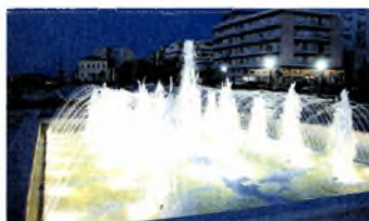
Η «πλατεία Ξενία».

Χαρακτηριστική είναι η αντιπαράθεση αναφορικά με την αναστήλωση ή το γκρέμισμα του ξενοδοχείου Ξενία, που είχε παραχωρηθεί από τον ΕΟΤ για εκμετάλλευση, στο Δήμο Ηρακλείου. Ο δήμαρχος σε ερώτηση δημοσιογράφου : «Κατεδαφίσατε το κτίριο της πρώην Ηλεκτρικής, ετοιμάξετε να κατεδαφίσετε το κτίριο του πρώην "Ξενία". Θα αφήσετε τίποτα όρθιο;» απαντά πως «Με σεβασμό προς τα μνημεία της πόλης και την ιστορία της, προχωρούμε στην αισθητική της αναβάθμιση. Σε κάθε περίπτωση, τα μνημεία αυθαιρεσίας θα κατεδαφίζονται». Διαπιστώνουμε την αλλαγή σημασιοδότησης: το μνημείο σύγχρονης αρχιτεκτονικής για κάποιους αποτελεί μνημείο αυθαιρεσίας για άλλους.