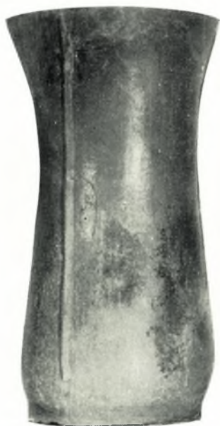
β. Κυλινδρικόν ποτήριον μετὰ τριῶν καθέτων πλαστικῶν κανόνων (ἐκ τοῦ δωματίου 12).