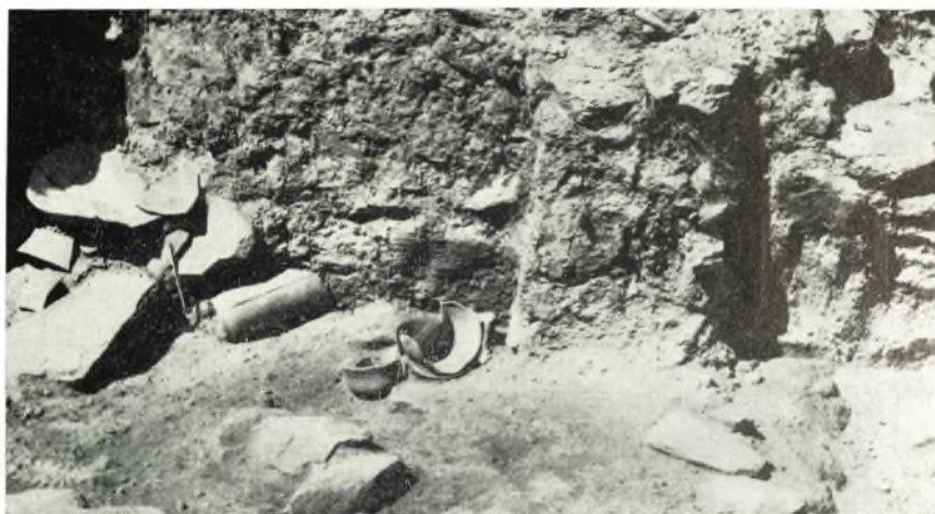
α. Ἀποψις τοῦ δυτικοῦ τμήματος τοῦ δωματίου 12. Διακρίνεται μία ἔσωτερικὴ ἀντηρὶς καὶ ἀγγεῖα ἐπὶ τοῦ δαπέδου.