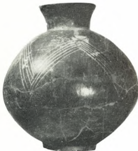
γ. Ἀγγεῖον τοῦ ρυθμοῦ Α3α ἐκ Σέσκλου (ἐκ τοῦ δωματίου 12).