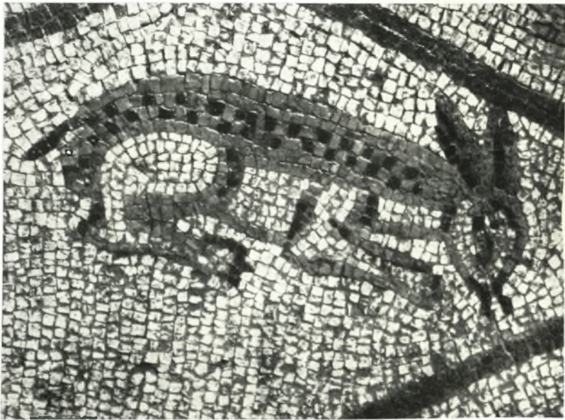
β. Λαγὸς ἐκ τῆς αἰθούσης τοῦ Ὀρφέως.