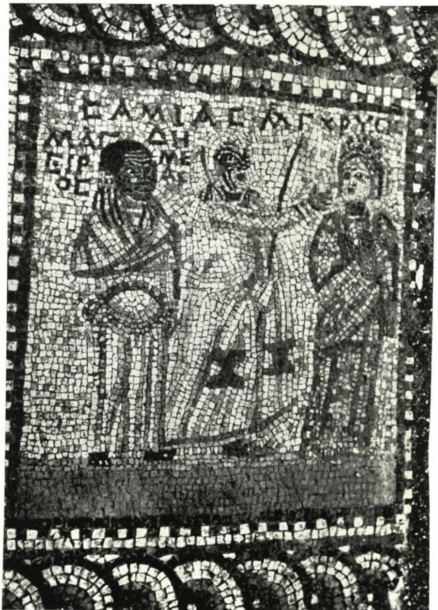
Πλαίσιον με παράστασιν σκηνης της Σαμίας του Μενάνδρου.