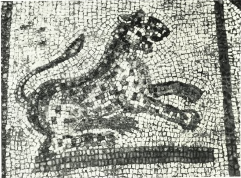
α. Πάνθηρ ἐκ τῶν περὶ τὸν Ὀρφέα πλαίσιον.