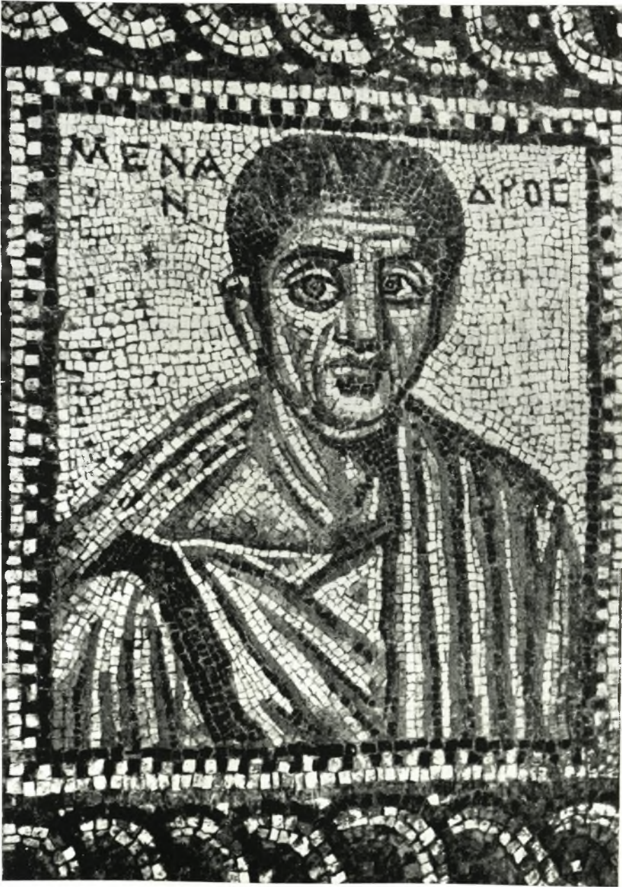
Προτομή Μενάνδρου ἐν τῷ τρικλίνοῳ.