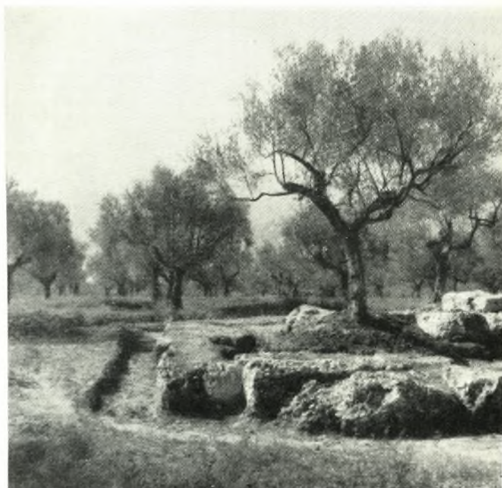
β. Ψυχικό. Ἡ ἀνατολικὴ καὶ τμήμα τῆς βορείου πλευρᾶς τοῦ βομοειδοῦς οἰκοδομήματος.