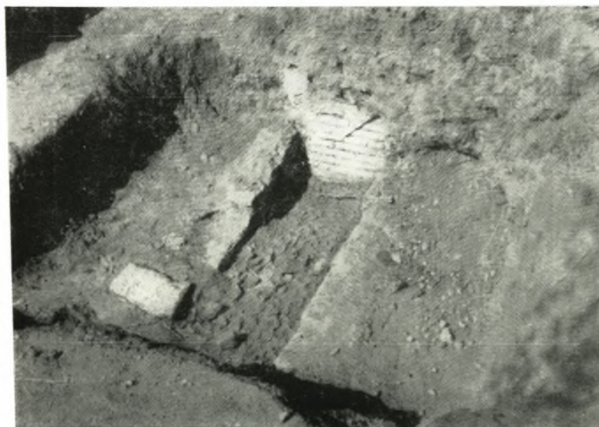
β. Τάφος Ρωμαϊκῶν χρόνων εἰς τὸ ἐσωτερικὸν τοῦ οἰκοδομήματος.