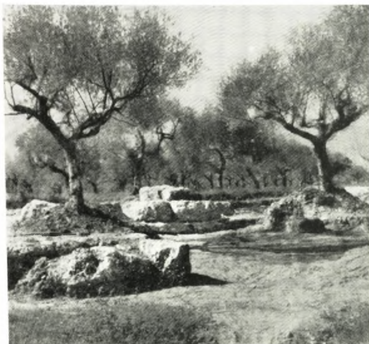
α. Ψυχικό. Είσοδος και κρηπίδωμα ἢ ἐξέδρα βωμοῦ.