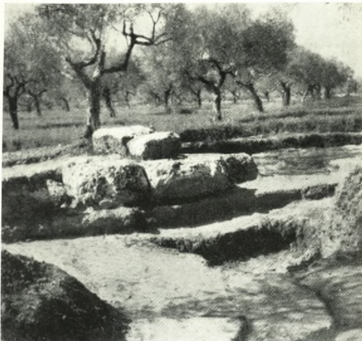
α. Ψυχικό. Τμήμα τῆς ἐξέδρας καὶ πρὸ αὐτῆς ἡ θέσις, ὅπου εὗρέθησαν τὰ ἐλληνιστικὰ ἀνάγλυφα.