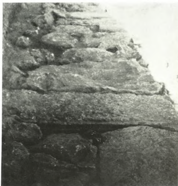
β. Στρογγύλη λίθος με περιτένεια ἐξ τῶν χρησιμοποιηθέντων διὰ τὴν πλαζκόστρωσιν τοῦ Διόλκου.