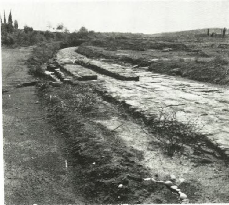
α. Το αποκαλυφθέν τμήμα του Λιόλκου εντός της περιοχής της Σχολής Μηχανισού θρόμενον εξ Α.