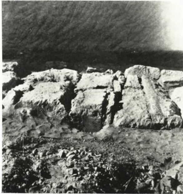
α. Γείσον μετ' ἐπιχρίσματος χρησιμεποιηθὲν εἰς τὴν πλαζόστρωσιν τοῦ Λιόλκου.