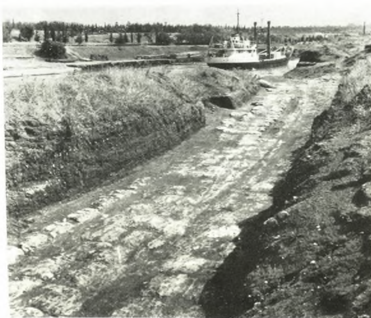
β. Το επί της πλευράς της Πελοποννήσου παρά τὸ δυτικὸν στόμιον τῆς διόδου τμήμα τοῦ Λιόλκου θρόμενον ἐξ Α. (ἀνατολικῶς τοῦ πορθμείου Κορίνθου - Λουτρακίου).