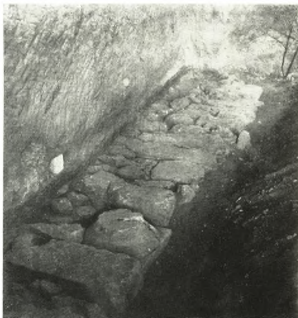
α. Τὸ ἀποκαλυφθὲν τμήμα τοῦ Διόλκου περί τὰ 100 μ., ἀνατολικάς τῆς Σχολῆς τοῦ Μηχανικοῦ.