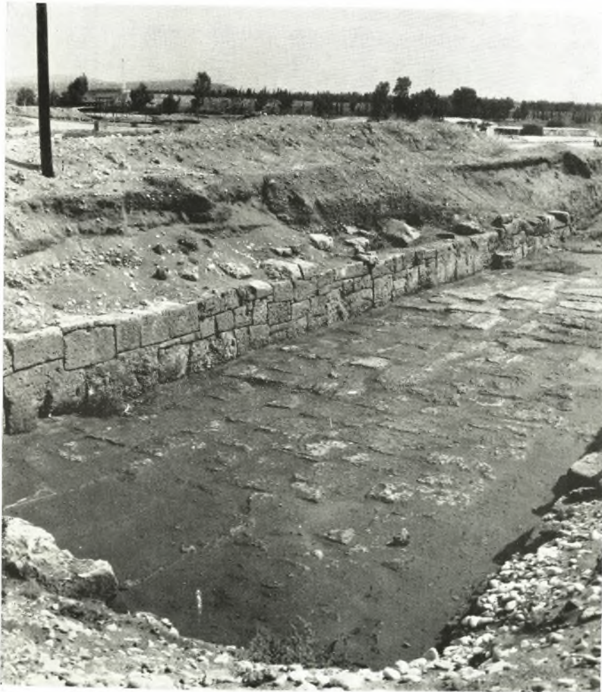
Ἡ ἐξ Α. ἀφαιρηγία τοῦ Λιότζου παρὰ τὸ δυτικὸν στόμιον τῆς διώρυγος.