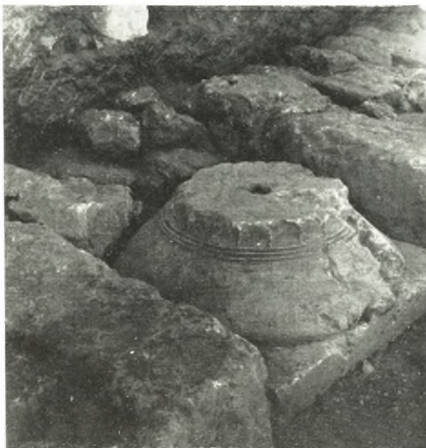
α. Πόρτινον δορυζόν ζιονόζουνον τοῦ α' ἡμίσεος τοῦ 5 ου π. Χ. αἰ., ἐντετειχισμένον εἰς τὴν πλαζόστρωσιν τοῦ Διόλκου.