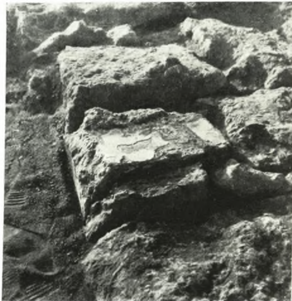
β. Τὸ αὐτὸ ὡς ἄνω γείσον ἐξ Α.