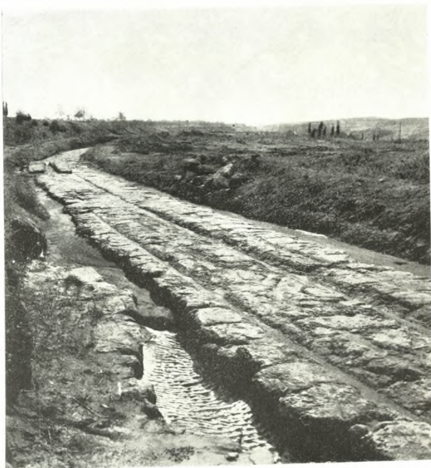
Τὸ ἀποκαλυφθὲν ἐντὸς τῆς περιοχῆς τῆς Σχολῆς τοῦ Μηχανιστοῦ τμήμα τοῦ Διόλου ὁρῶμενον ἀπὸ Δ.