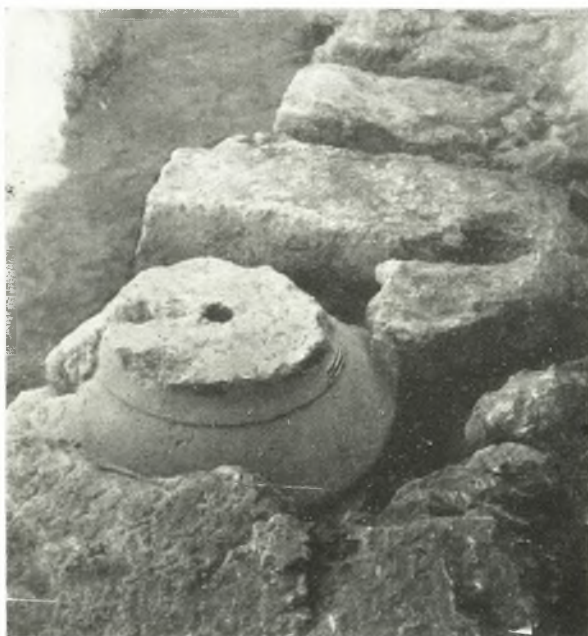
β. Τὸ ὡς ἄνω ζιονόζουνον ὁρόμενον ἀπὸ Α.