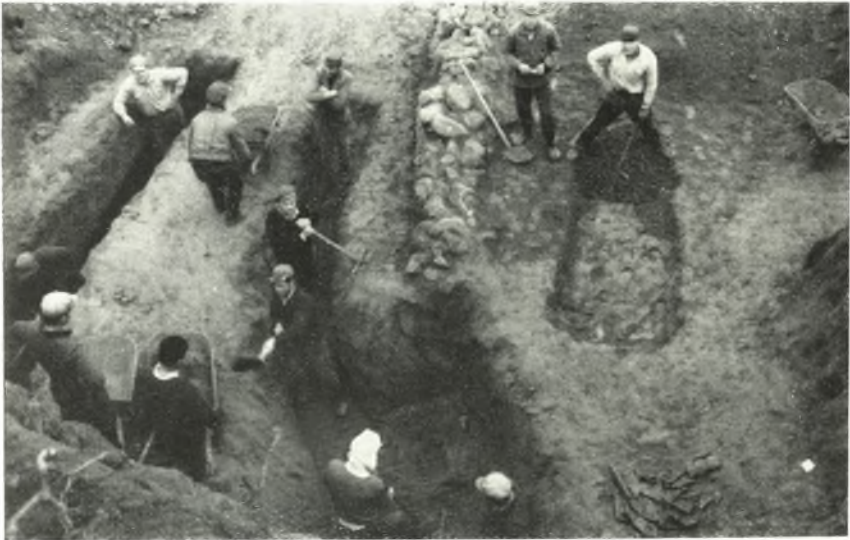
α. Ἡ ἔρευνα τῶν ζάτων τῆς ἐπιτάφσεως στορωμάτων τοῦ τύμβου.