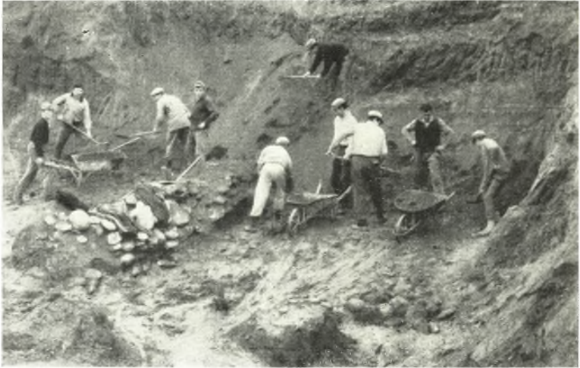
α. Ἡ ἀνασκαφή τοῦ βορείου τομέως τοῦ τύμβου Νικησιάνης Παγγαίου.