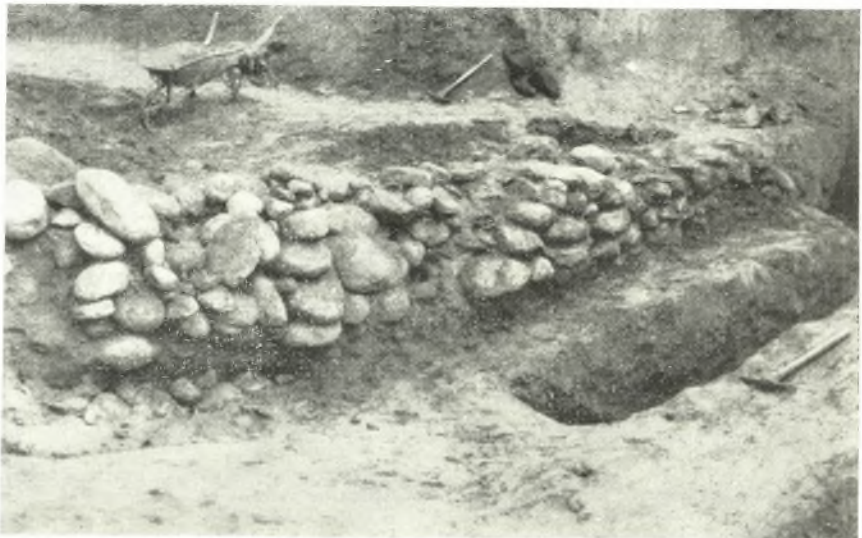
β. Ὁ ἀποκατασκευαστὸς ἐντὸς τοῦ τύμβου τοῖχος ἐκ χοροαλῶν.