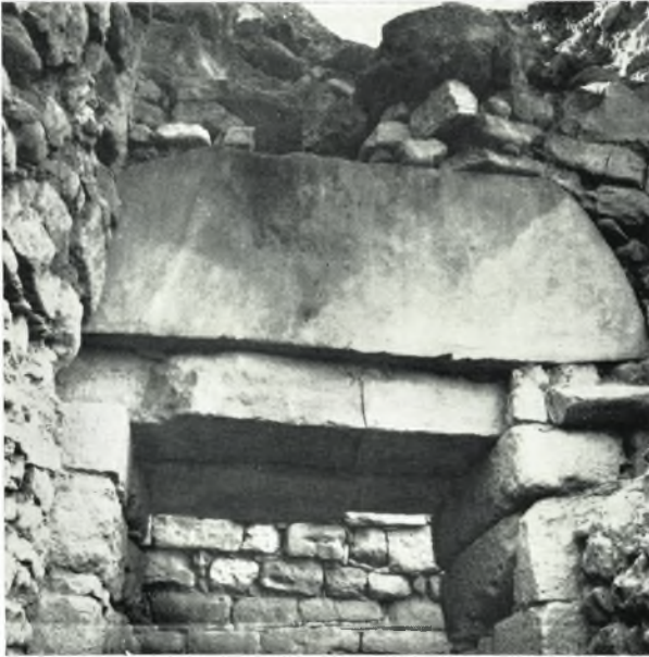
α. Τὸ ἐξωτερικὸν ἄνω μέρος τῆς εἰσόδου μετὰ τῆς καλυπτοῦσης τὸ ἀνακουφιστικὸν τρίγωνον πλακός.