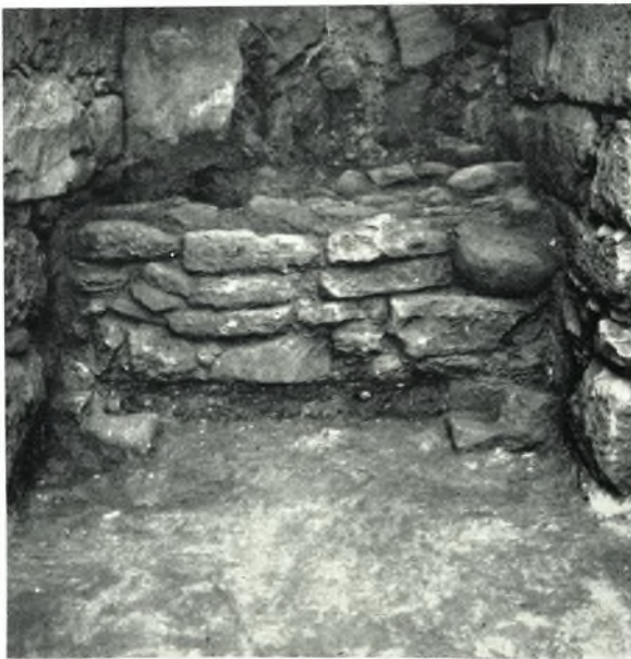
β. Τὰ λείψανα τοῦ κροτάματος τῆς εἰσόδου καὶ οἱ ὄλμοι τῆς θύρας.