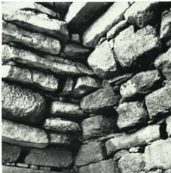
α. Ἡ ΒΑ. γωνία τῆς θόλου. Λεπτομέρεια δομῆς τῆς πυραμιδοειδοῦς ὀροφῆς.