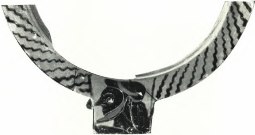
α. Χείλος μελανομόρφου κρατήρος.