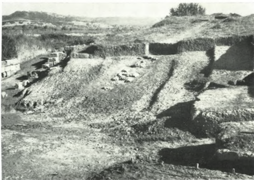
β. Τὸ ἀνατολικὸν τμήμα τοῦ κοίλου μετὰ τὸν λειψάνον τῶν λιθίνων βαθμίδων.