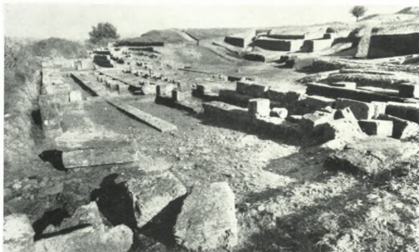
α. Γενική ἄποψις τοῦ θεάτρου τῆς Ἡλίδος ἀπὸ Δυσμῶν μετὰ τὸν ἐν τῷ κοίλῳ ἀνοίγεισθον τάφρων.