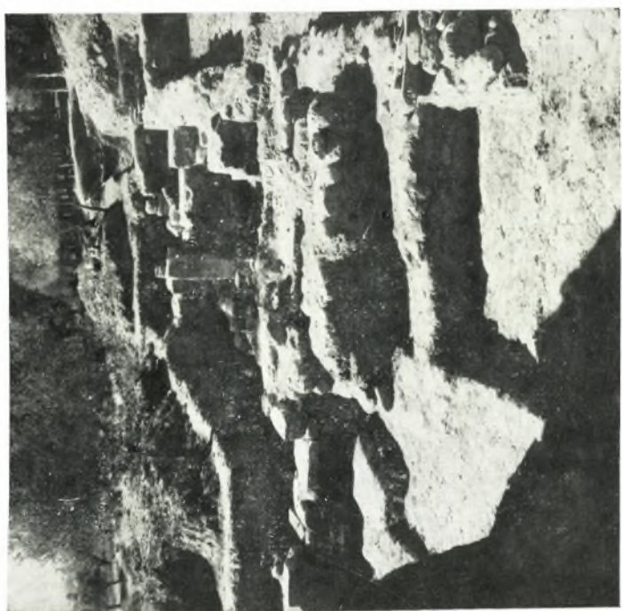
α. Γενική ἀποψη τῆς ἀνασκαφῆς. Βυζαντινὰ καὶ ρωμαϊκὰ εἱρεῖα.