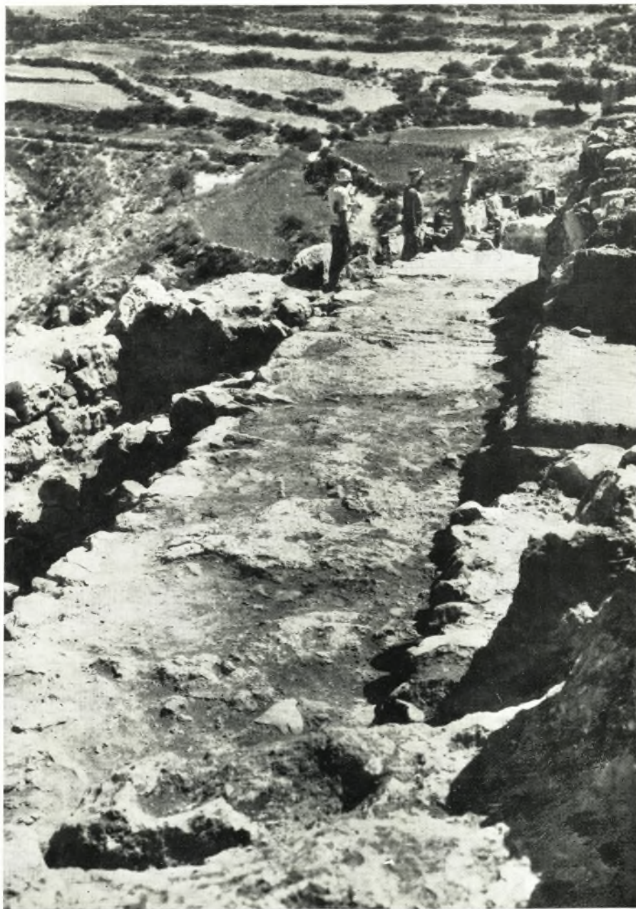
α. Ἡ ἀπὸ τῆς Πύλης τῶν Λεόντων δόδος.