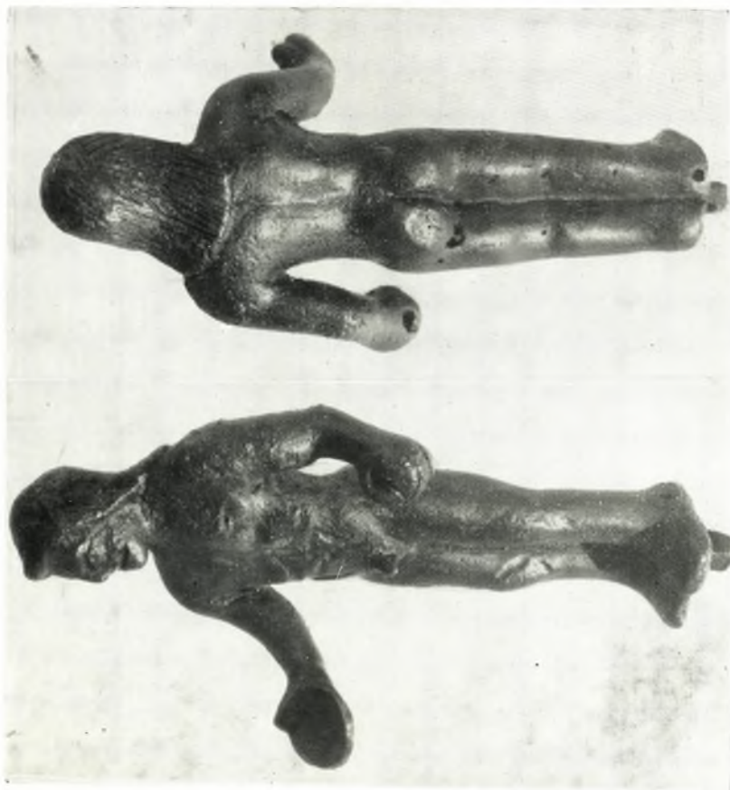
α. Χαλκοῦν ἀγαλμάτιον Ἀπόλλωνος