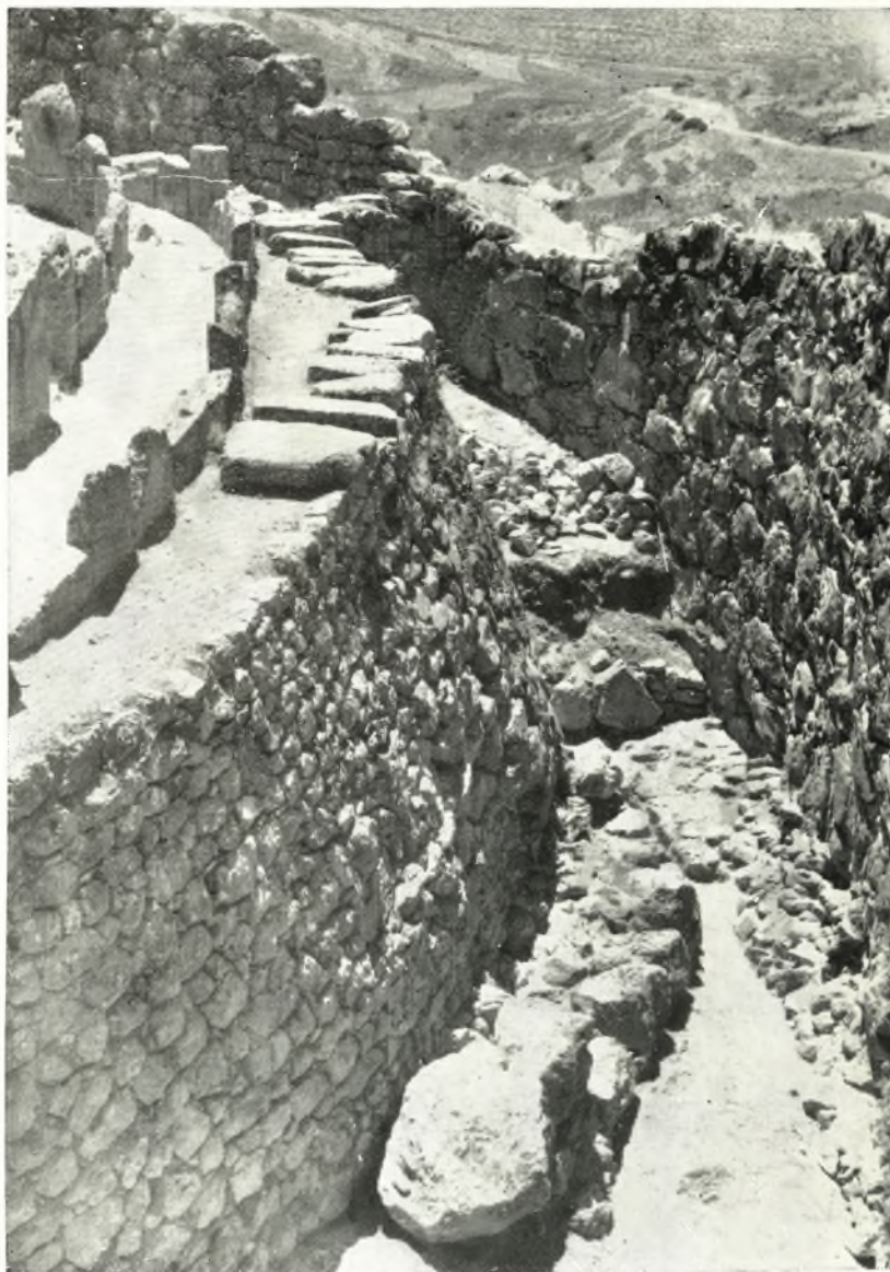
*Ο ἀρχαιότερος κύκλος μεταξύ τοῦ δυτικοῦ τείχους καὶ τοῦ ἀναλημματικοῦ περιβόλου τοῦ κύκλου Α.