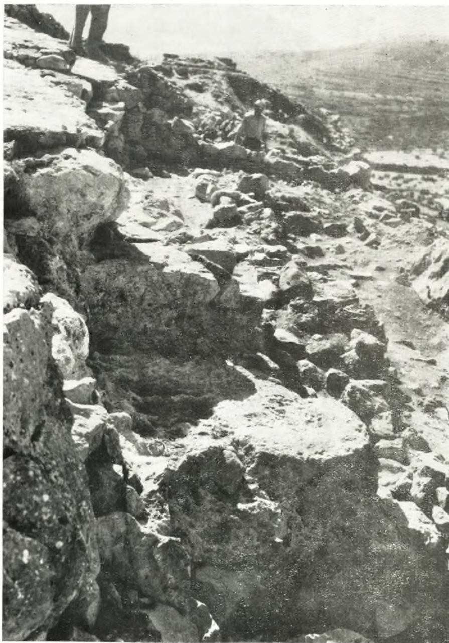
Κατάληξις τῶν πρὸς τὴν κλίμακα ὁδῶν.