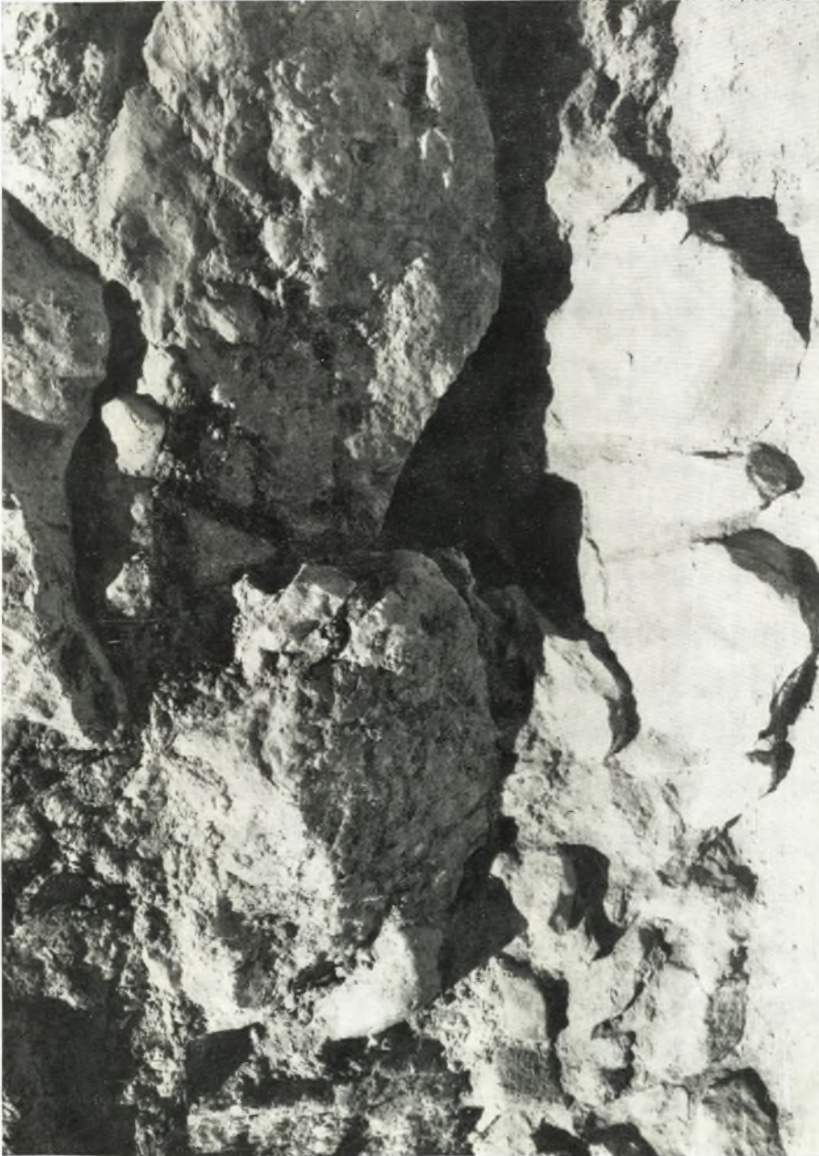
Κοιλότης μεταξύ και κάτω των ογκολίθων του δυτικού τείχους.