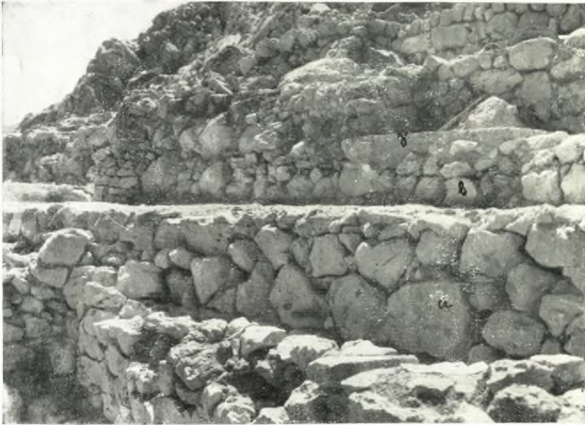
α. Τὸ δυτικὸν τμήμα τῆς ἀπὸ τῆς Πύλης τῶν Λεόντων ὁδοῦ μετὰ τοὺς ἀναλημματικούς της τοίχους.