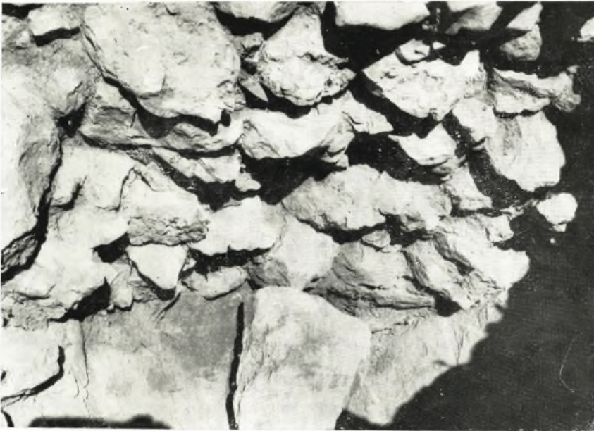
α. Λιθολόγημα του ανδρήρου του τοίχου 10.