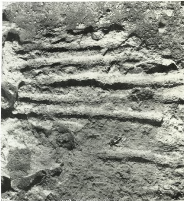
β. Ἀποτυπώματα δοκαρίων καὶ κονιάματος.