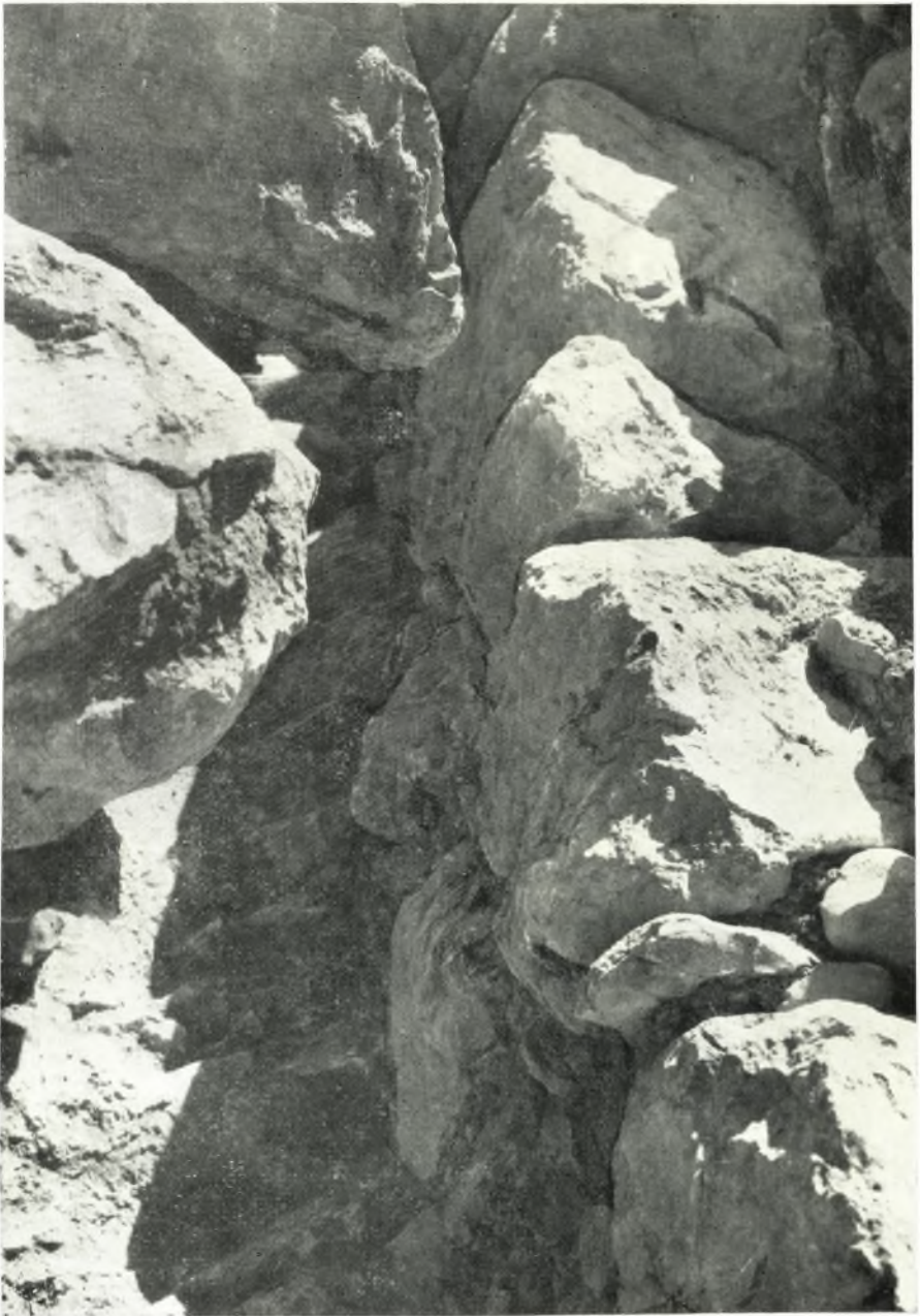
Ἀναλημματικός τοῖχος ὑπ' ἀρ. 11.