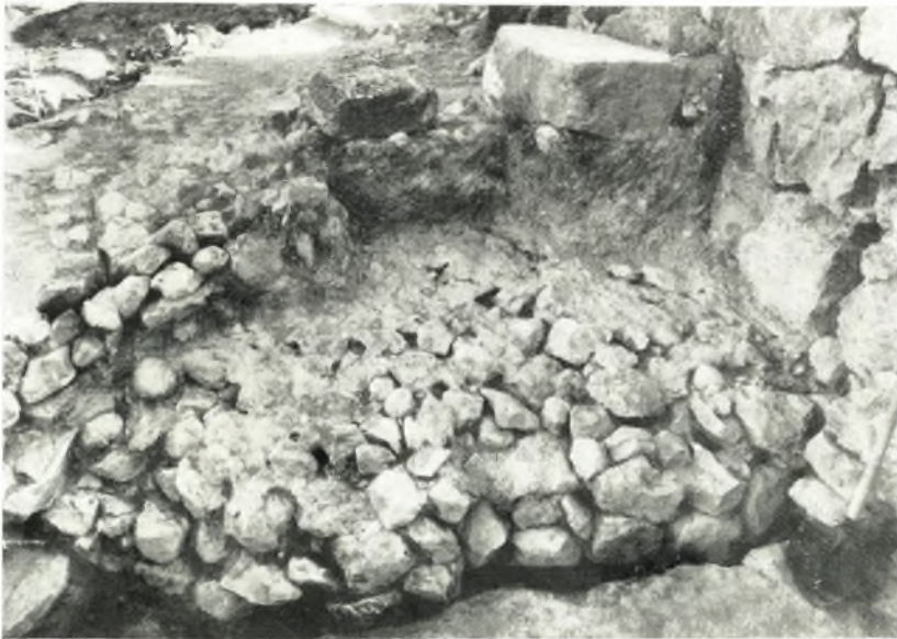
β. *Η ΒΔ, πλευρά του ανδρήρου του τοίχου 10.