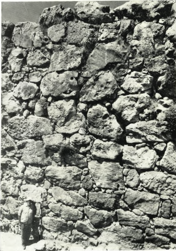
Τὸ δυτικὸν Κυκλώπειον τεῖχος.