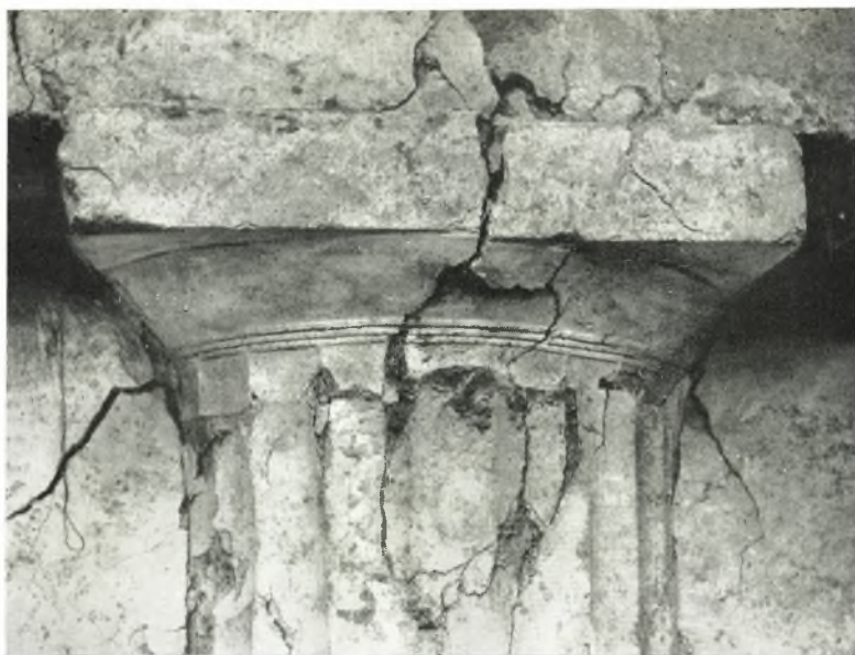
α. Ὁ πρῶτος ἐξ ἀριστερῶν δωρικός ἡμικίον.