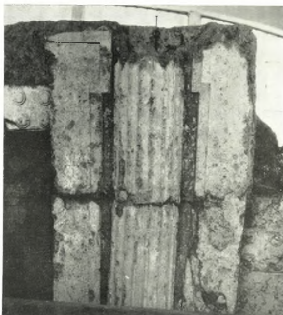
α. Μέρη ἡμικίονος καὶ τῶν ἐκατέρωθεν θυρωμάτων, μετὰ τὸν καθαρισμόν.