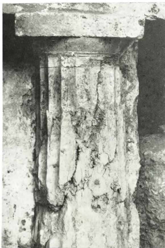
β. Ὁ δεύτερος ἐξ ἀριστερῶν δωρικός ἡμικίον.