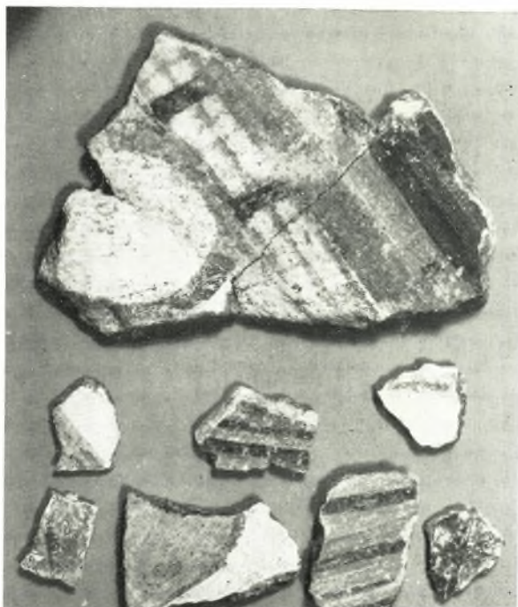
α. Τεμάχια τοιχογραφιών ἐκ τοῦ πρὸς Βορρᾶν τοῦ συγκροτήματος Ζ χώρου.