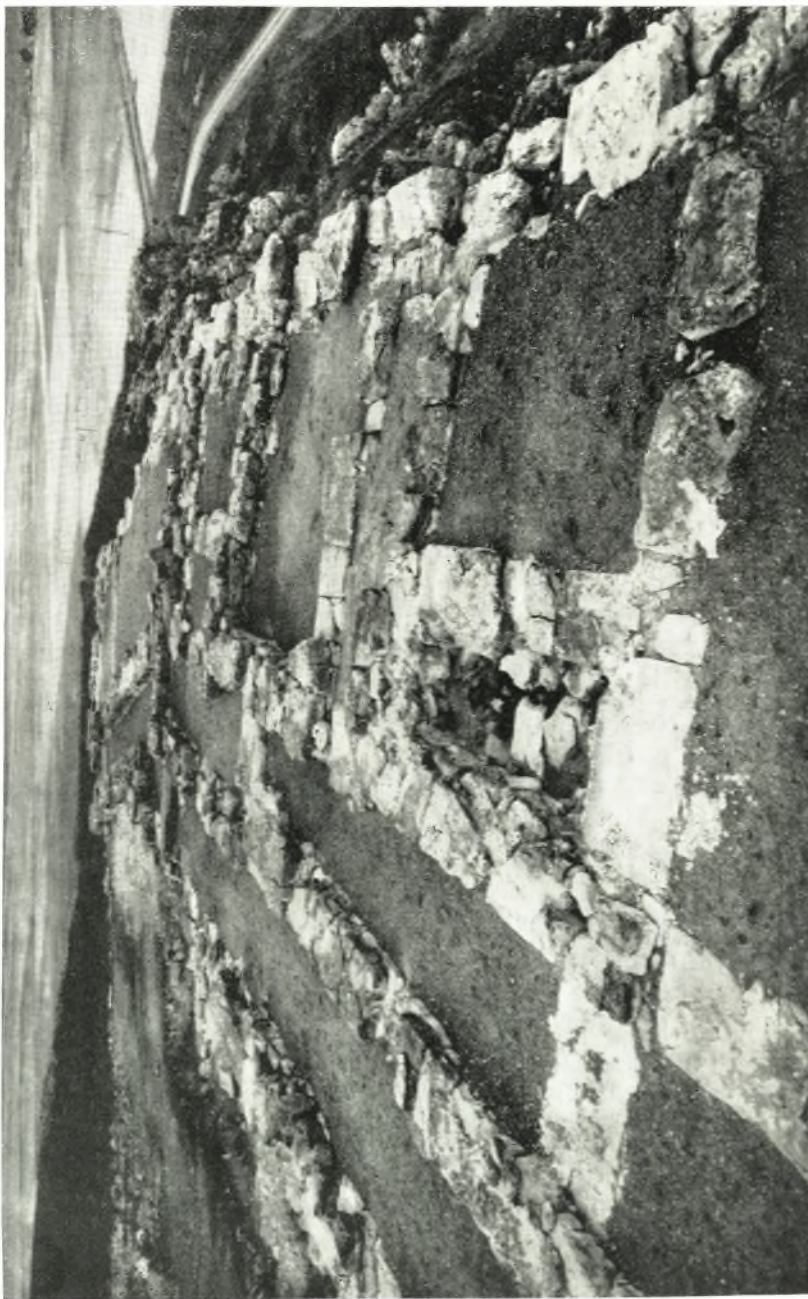
”Αποψη από ’Ανατολίων τῆς βορείου πτέρυγος τοῦ ’Ανατόρου μετὰ τὸν τελικὸν καθαρισμόν καὶ τὴν προσαταυτευτικὴν κάλυψιν τὸν διαπέδον.