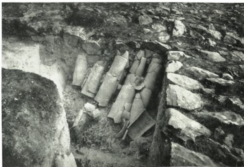
β. Κέραμοι ἀποθηκευμένοι ἔξω τοῦ πέμπτου διαμερίσματος τοῦ συγκροτήματος Ζ παρὰ τὴν ΒΑ. αὐτοῦ γωνίαν.