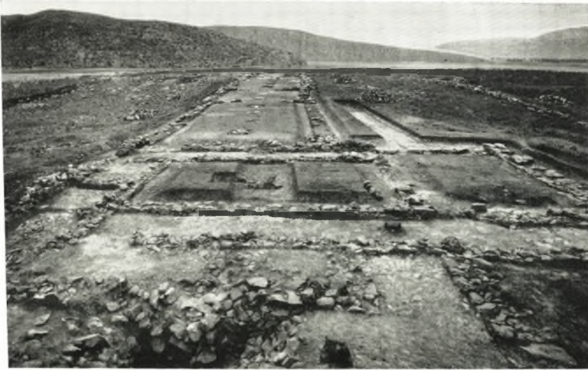
α. Τὸ μέγαρον Ε μετὰ τοῦ πρὸς Δυσμᾶς αὐτοῦ προδόμου καὶ τοῦ εἰς αὐτὸν καταλήγοντος πλακοστρώτου δρόμου.