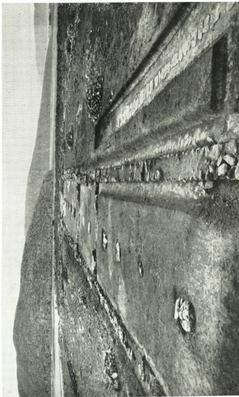
“Απομνημόσυνο τῶν τριῶν ὑποστύλων αἰθουσῶν μετὰ τῆς προστατευτικῆς τῶν τοίχων ζώνης καὶ τοῦ πρὸς Δυσμῆς αὐτῶν στενοῦ πλακοστρώτου δρόμου.