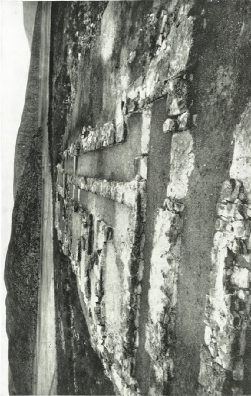
* Απομυς ἀπό Βορρά τῆς ἀνατολικῆς πτέρυγος τοῦ Ἀνακτόρου μετά τόν τελικόν καθαρισμόν καί τήν προστατευτικήν κάλυψιν τῶν διαπέδων.