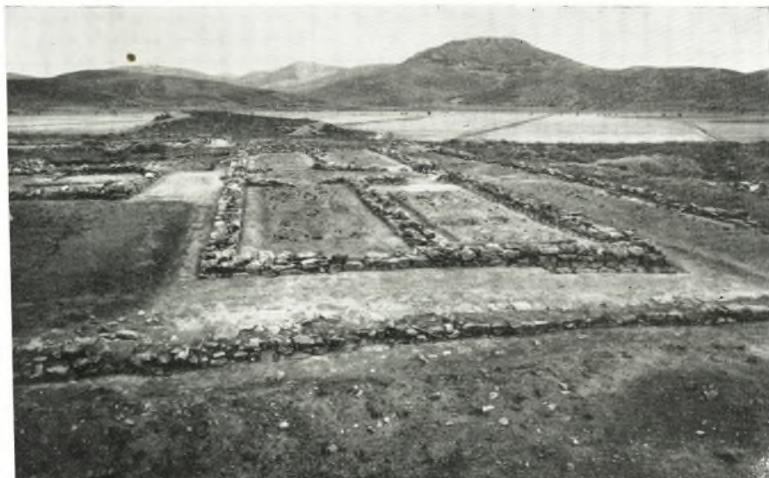
α. Τὸ συγκρότημα Α μετὰ τῆς ΝΔ. γωνίας τοῦ προστατευτικοῦ τῆς Ἀγορᾶς περιβόλου.