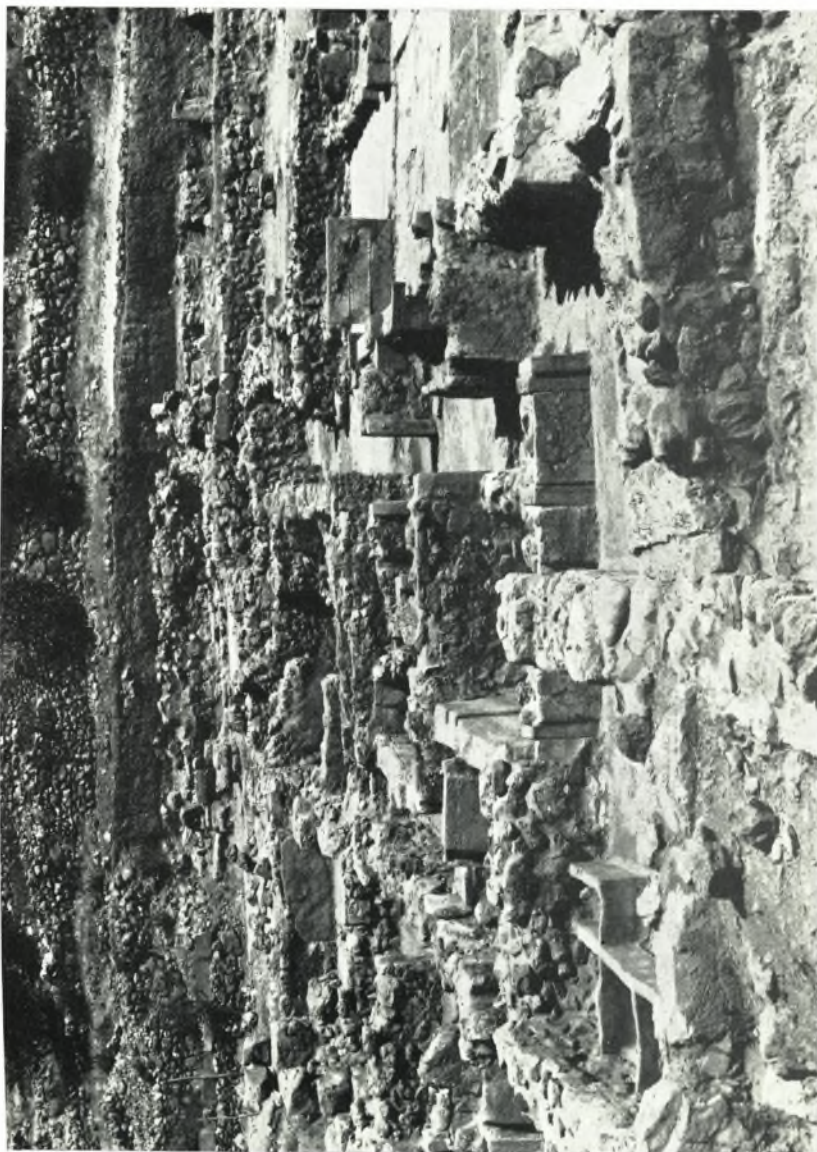
Μέρος της Δυτικής πτέρυγος του Ἀνακτόρου Ζάκρου μετὰ τὴν ἐξτέλεισιν τῶν ἐργασιῶν ἀναστηλώσεως καὶ ἀποκαταστάσεως.