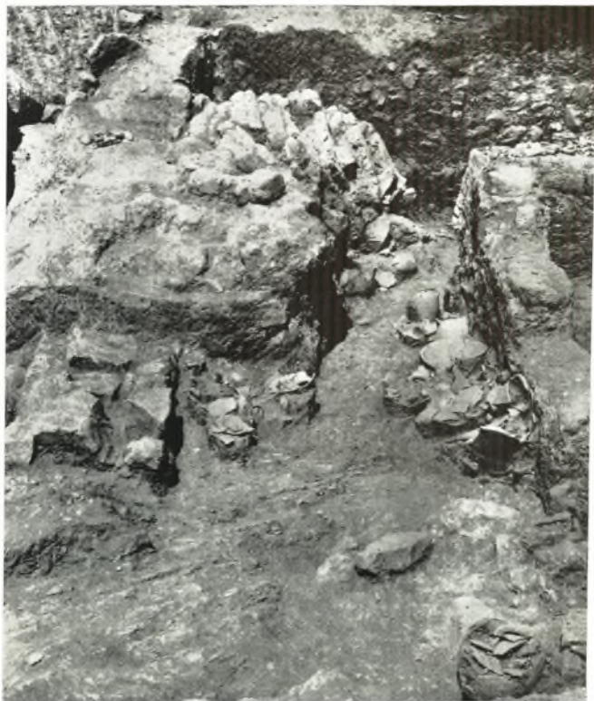
α. Ἀνάκτορον Ζάκρου. Τὰ δύο βοηθητικά δωμάτια τοῦ Μαγειρείου L καὶ LI μὲ τὰ κατὰ χώραν εὐθεθέντα μαγειρικά σκεῆθαι καὶ τὸ καταπεσόν πλίνθινον διαχώρισμα.