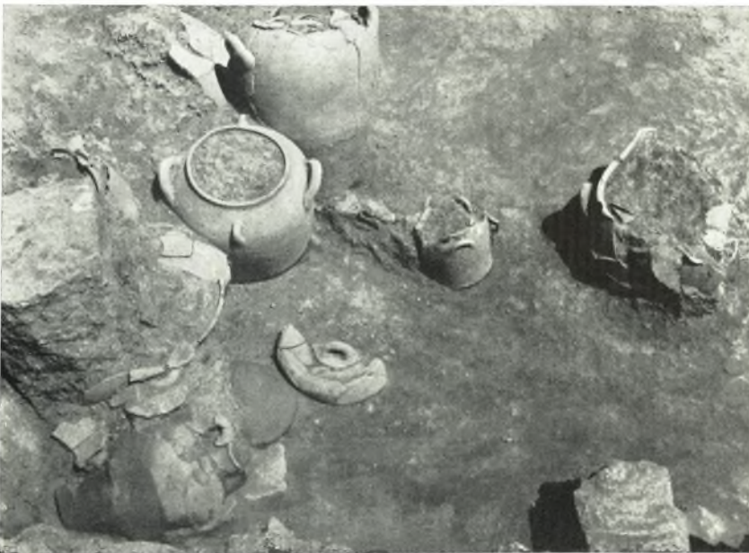
β. Ἡ ὁμάς ἀγγείων του δωματίου ΧΙΙΙ της Νοτίας πτέρυγας του Ἀνακτόρου Ζάκρου ἐκ ΝΑ. ὁρωμένη.