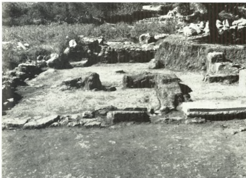
β. Ἀνάκτορον Ζάκρου. Ἡ εἴσοδος μετὰ τὸ μονόλιθον κατῶφλιον πρὸς τὰ διαμερίσματα τοῦ Νοτίου τομέως, τῶν ὁποίων ἀριστερὰ διακρίνονται τὰ ΧI,II καὶ ΧI,III.