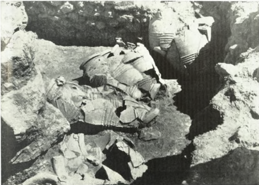
β. Ἡ ἀποθήκη Θ τῆς μινωικῆς Ἐπιπέδου Ζάκρου μετὰ τοὺς πίθους εἰς τὴν θέσιν εἰς ἣν εὐρέθησαν. Ὅψις ἐκ ΒΔ.