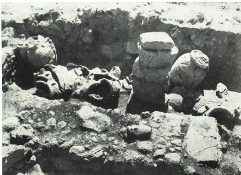
α. Ἡ ἀποθήκη Θ τῆς μινωικῆς Ἀγροικίας Ἐνω Ζάκρου με τοὺς πίθους ὡς εὐρέθησαν κατὰ τὸν ΝΔ. τοῖχον καὶ τὸν κεντρικὸν πεσσόν. Ὅψις ἐκ ΒΑ.