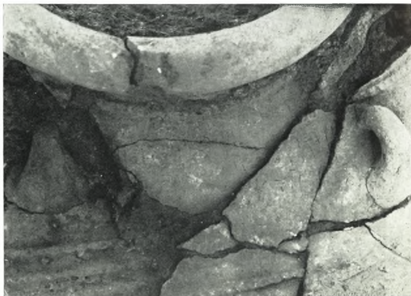
β. Λεπτομέρεια τοῦ ἐνεπιγράφου πίθου τῆς ἀποθήκης Θ τῆς μινωικῆς Ἀγροικίας Ἐνω Ζάκρου. Ἡ δίστιχος ἐπιγραφή τοῦ Γραμμικοῦ Α συστήματος διακρίνεται μεταξύ τῶν λαβῶν.