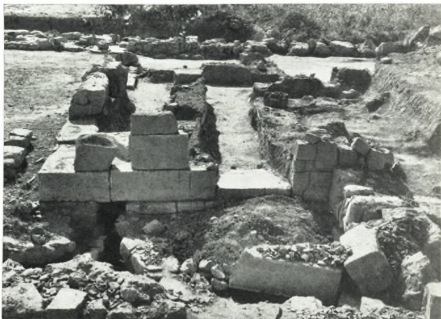
α. Ἀνάκτορον Ζάκρου. Ἐποψὶς τῶν διαμερισμάτων τοῦ Νοτίου τομέως ἐκ ΒΔ. διακρίνεται μετὰ τὴν εἴσοδον μὲ τὸ μονόλιθον κατὰφλιον ὁ τοιχογραφημένος διαδρομίσκος ΧΙ,VIβ.