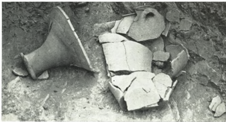
β. Τὸ μέγα πυριατήριον καὶ τὸ παρ' αὐτὸ σταμνοειδῆς ἀγγεῖον εἰς τὸ Πλίνθινον δωμάτιον L τοῦ Ἀνακτόρου Ζάκρου.