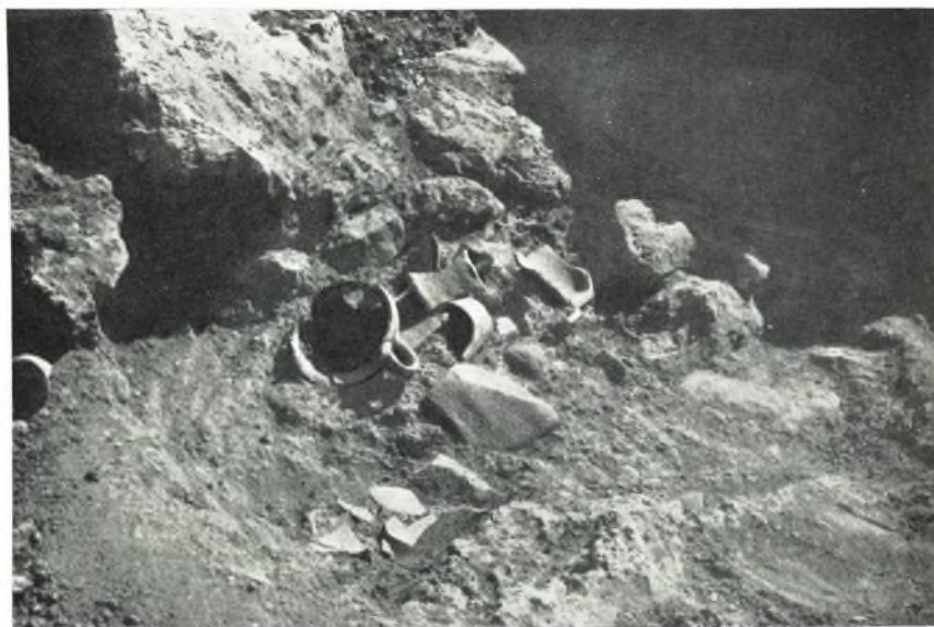
α. Ὁ ἀποθέτης τῶν ΠΜ ΙΙΙ ἀγγείων κατὰ τὴν βᾶσιν τοῦ στηρίγματος δοκοῦ Α τοῦ Μαγειρείου τοῦ Ἐνακτόρου.