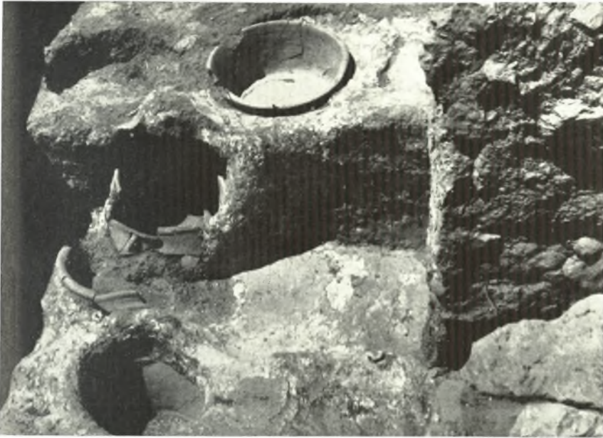
α. Τὸ σύστημα τοῦ διπλοῦ ληνοῦ τοῦ δωματίου Α τῆς μινωικῆς Ἐπιπέδου Ζάκρου, μετὰ τὴν πλήρη ἀποκάλυψιν.