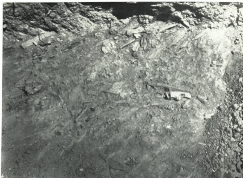
α. Τὸ στρώμα τῶν ὀστέων ζώων ὑπὸ τὰ μαγειρικά ἀγγεῖα τοῦ Πλινθίνου δωματίου I, τοῦ Ἀνακτόρου Ζάκρου.