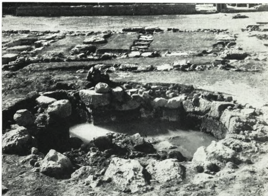
α. Ἡ μεγάλη κυκλική δεξαμενὴ τῆς Αἰθούσης LXXII τοῦ Ἀνακτόρου Ζάκρου. Ἐἰς τὸ βάθος διακρίνονται τὰ πολύθυρα Βασιλικά Μέγαρα καὶ ἡ Κεντρικὴ ἀλλή.