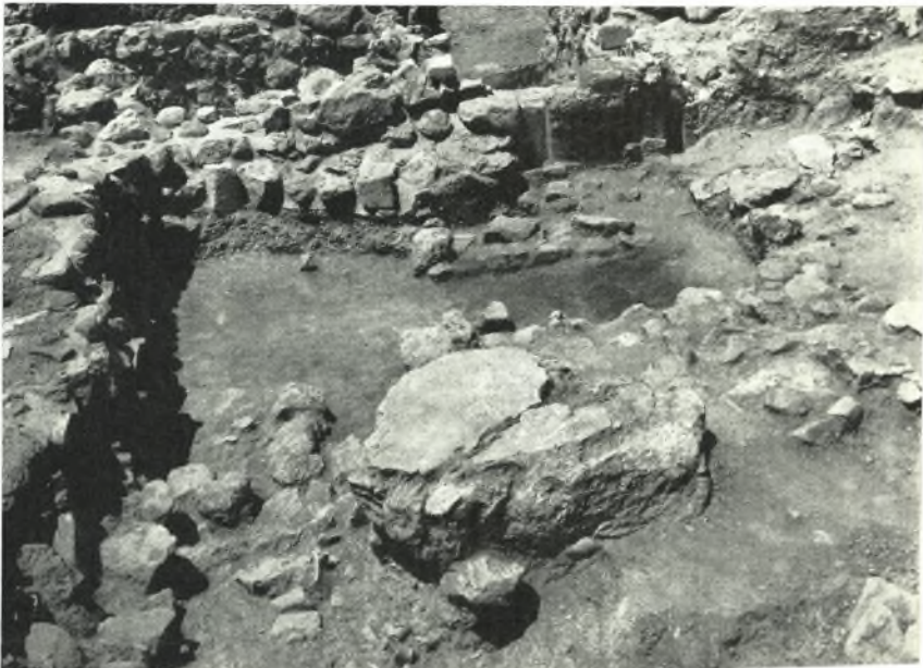
β. Στρωματογραφικὴ ἔρευνα ὑπὸ τὸ δάπεδον τοῦ Μαγειρείου τοῦ Ἀνατόρου, ἀποκαλύψασα δύο δωμάτια κτηρίου προανακτορικῶν χρόνων. Εἰς τὸ πρῶτον ἐπίπεδον διακρίνεται τμήμα τοῦ δωματίου Α, εἰς τὸ μέσον τῆς εἰκόνης τὸ δωμάτιον Β.