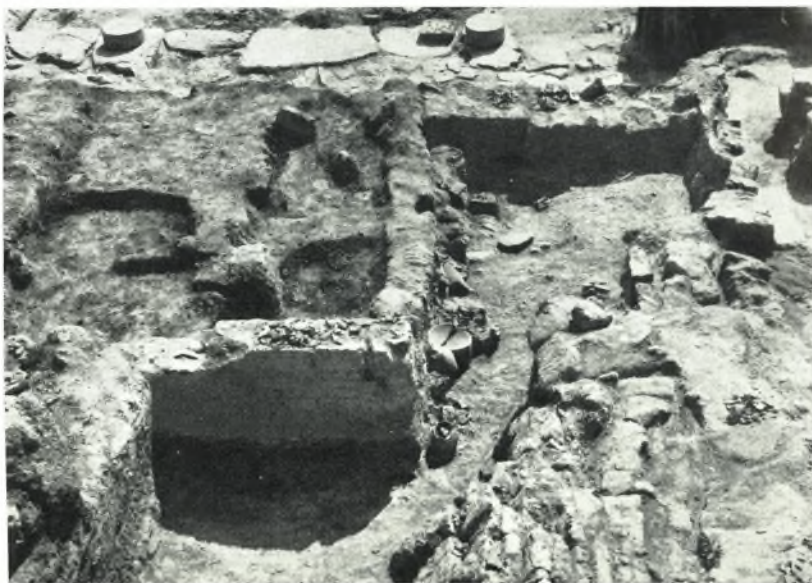
β. Ἀνάτορον Ζάκρου. Τὸ πλίνθινον δωμάτιον L μετὰ τοῦ ἐντὸς αὐτοῦ καταπεσόντος πλινθίνου τοίχου καὶ τοῦ προθαλάμου του πλήρους μαγειρικῶν σκευῶν.