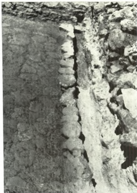
α. Ὁ ὄχρητὸς τῆς γωνιακῆς πλακοστρώτου αὐλῆς τοῦ Βορείου τομέως τοῦ Ἀνακτόρου Ζάκρου.