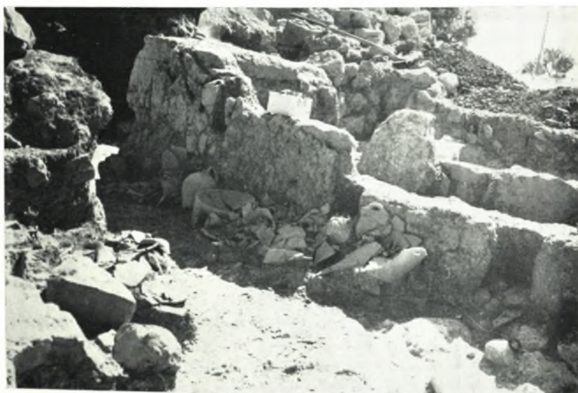
β. Ἀνάκτορον Ζάκρου. Μαγειρικά σκεύη καὶ λίθινον τριποδικὸν ἰγδίων τοποθετημένα κατὰ μῆκος τοῦ ΝΑ. τοίχου τοῦ δωματίου I,I (προθάλαμου τοῦ Πλινθίνου δωματίου).