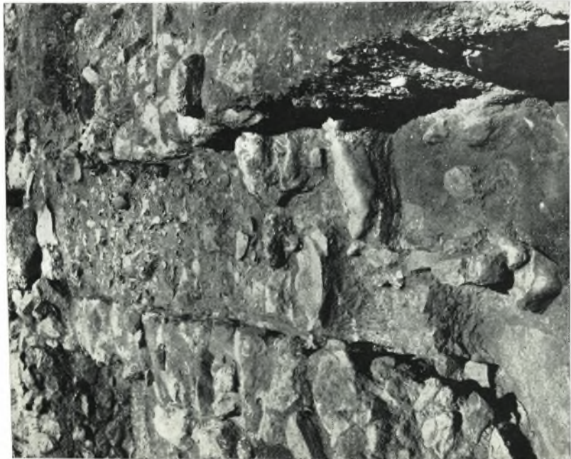
α. 'Ανακτορον Ζάκρου. Το ύπό την κλίμακα στενεπέριμες διαμάτιον LV με πολλές δεσάδας κυτέλλων και άλλων σεευών, άνευρεθέντων κατά χώραν, έξ ΝΑ. όρώμενον. Είς τό πρώτον επίπεδον η γωνιακή φωτία.