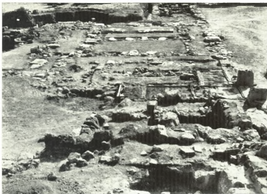
α. Τμήμα τῆς Ἀνατολικῆς πτέρυγος τοῦ Ἀνακτόρου Ζάκρου μετὰ τὰ λείψανα τῶν βασιλικῶν πολυθύρων μεγάρων XXXI,VI καὶ XXXI,VII ἐκ ΒΑ. δρώμενον.