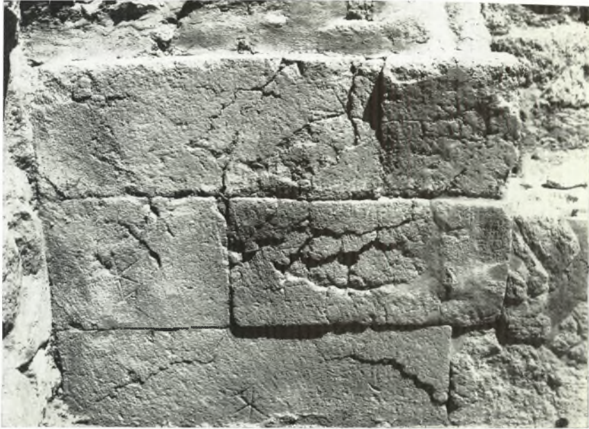
α. Τοίχος ἐξ ἀρμοστῶν πελεκητῶν πωρολίθων τοῦ προθαλάμου XXX τοῦ Ἀνατόρου Ζάκρου μὲ πέντε χαρακτὰ σύμβολα διπλῶν πελέκεων.