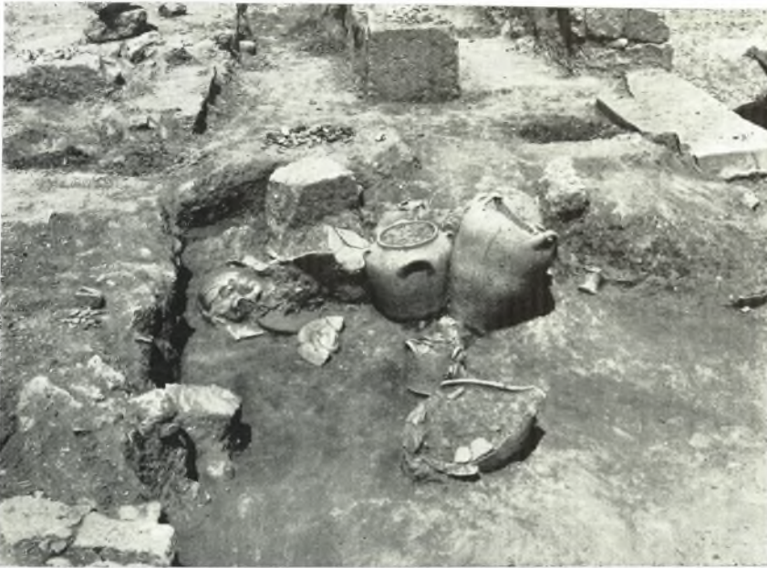
α. Στάμνοι, πιθίσκοι και κάδοι του δωματίου ΧΙΙΙ της Νοτίας πτέρυγας του Ἀνακτόρου Ζάκρου ἐκ ΝΑ. ὁρῶμενοι.