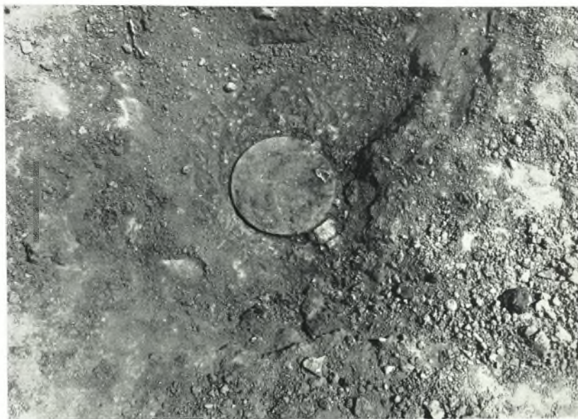
α. Χαλκοῦν εὐμέγεθες κάτοπτρον ἐντὸς τοῦ πυριζαύστου στρώματος τοῦ καλύπτοντος τὸ δάπεδον τῆς Κεντρικῆς ἀλλῆς τοῦ Ἀνατόρου Ζάκρου.