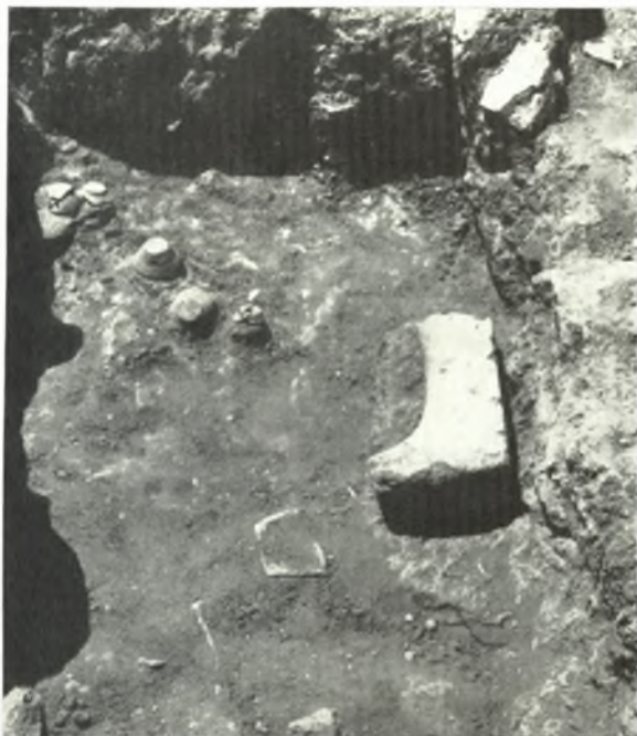
α. Πόρρινον διπλοῦν ἱερὸν κέρας, εὔρεθὲν εἰς τὸν κλωβὸν τοῦ κλιμακωστασίου LII τοῦ Ἀνατόρου Ζάκρου.