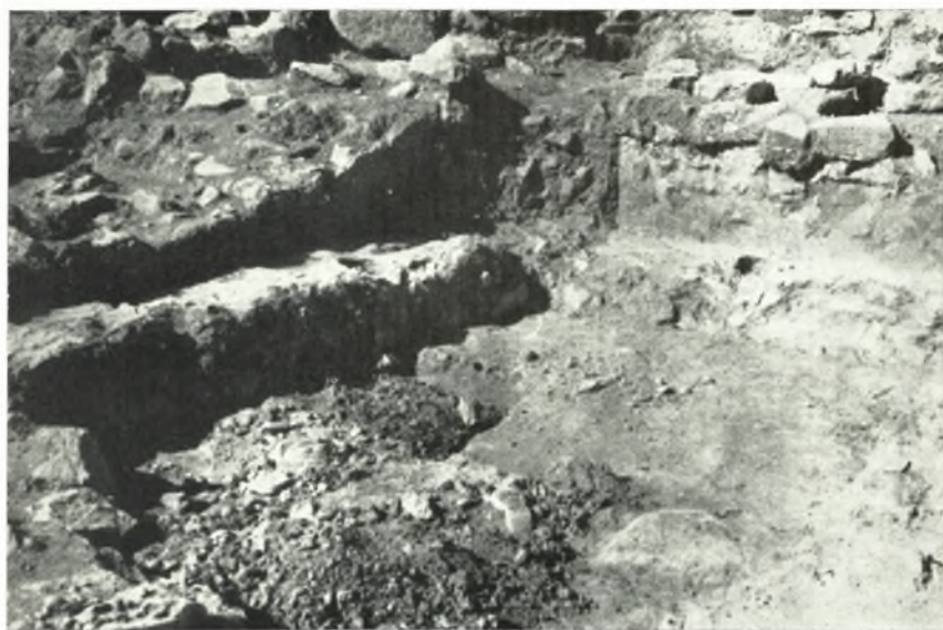
β. Τὸ Δομάτιον τοῦ Λουτροῦ L,VIII τοῦ Ἀνακτόρου Ζάκρου εὐθὺς μετὰ τὴν ἀποκάλυψίν του. Διακρίνονται τὰ ἐπίχριστα μετὰ κίωνων θρανία.