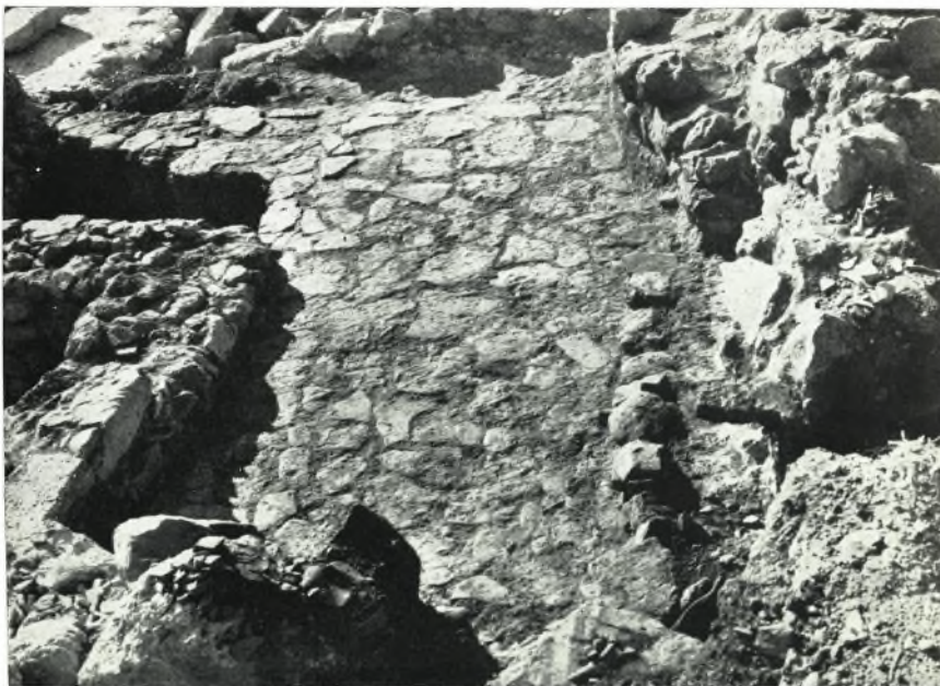
β. Ἡ γωνιακὴ πλακόστρωτος ἀλλή κατὰ τὸν Βόρειον τομέα τοῦ Ἀνακτόρου Ζάκρου ἐκ ΝΑ. ὄρωμένη.