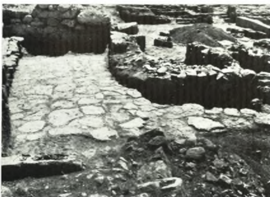
β. Ἡ γωνιακῆ πλακοστρώτος αὐλῆ κατά τὸν Βόρειον τομέα τοῦ Ἀνακτόρου Ζάκρου ἐκ ΒΔ. ὄρωμένη.