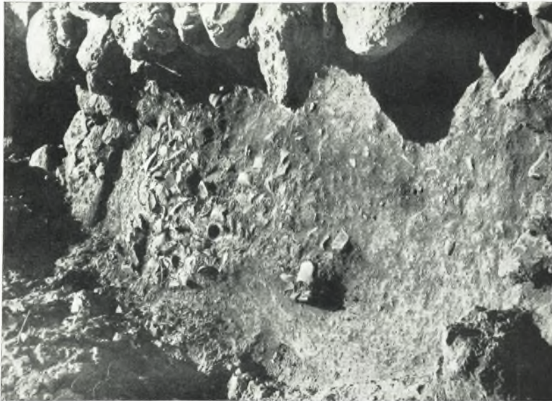
β. Σκοπός όγγείων του χώρου του κλιμασοσταίου LV του 'Ανακτόρου Ζάκρου.