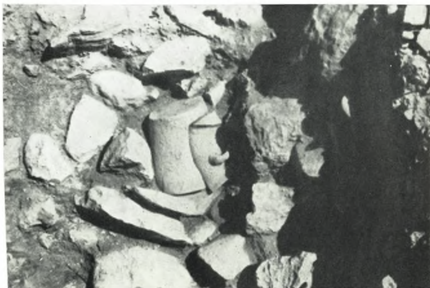
β. Κολουροκοωνικὸν ΠΜ ΙΙΙ ἀγγεῖον τοῦ ἀποθέτου ὑπὸ τὸ δάπεδον τοῦ Μαγειρείου τοῦ Ἐνακτόρου.