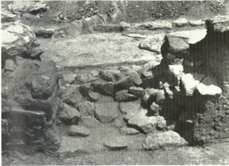
α. Ὁ τοῖχος τοῦ ΜΜ ΙΑ κτηρίου ὁρατὸς κατὰ τὴν ΝΔ. εἴσοδος τοῦ Μαγειρείου. Διακρίνεται τὸ ἐπίχριστον δάπεδον τοῦ δωματίου Β τοῦ ΠΜ ΙΙΙ κτηρίου.