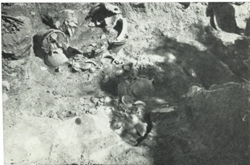
β. Ὅμας πύθων καὶ ἀγγείων κατὰ τὴν Β. γωνίαν τοῦ δωματίου ΧΙ,VII τῆς Νοτίας πτέρυγος τοῦ Ἀνακτόρου Ζάκρου.