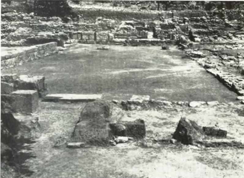
β. Ἡ Κεντρικὴ αὐλή τοῦ Ἀνακτόρου τῆς Ζάκρου μετὰ τὴν ἀποχωμάτωσίν της. Εἰς τὸ βάθος τὰ διαμερίσματα τοῦ ΒΔ. τομέως. Εἰς τὸ πρῶτον ἐπίπεδον ἢ εἴσοδος τῶν διαμερισμάτων τοῦ ΝΔ. τομέως.