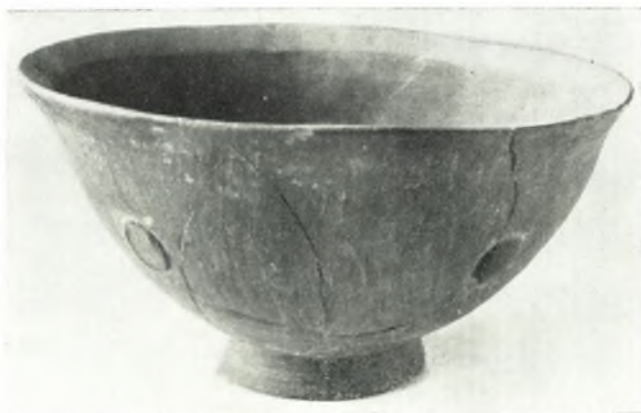
β. Μονόχρωμον ζουθρόν ἄγγειον (Α1) τῆς Μέσης Νεολιθικῆς.