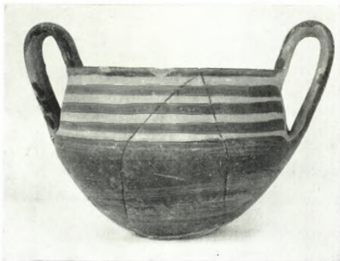
α. Πρωτογεωμετρικόν πήλινον ἄγγειον ἐκ τοῦ θολωτοῦ τάφου παρὰ τὴν ἀκρόπολιν τοῦ Σέσκλου.