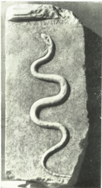
β. Ἀναθηματικὸν ἀνάγλυφον ἐκ τοῦ ἱεροῦ τῆς Νύμφης.