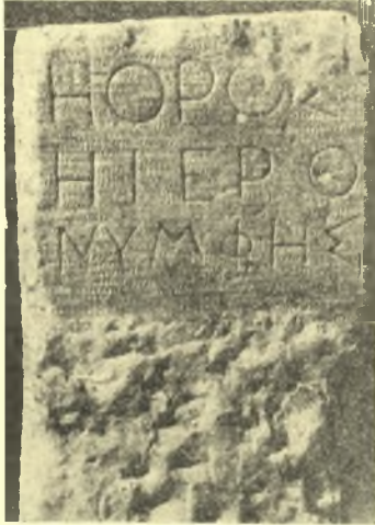
Εἰκ. 2. Ὁ ὄρος τοῦ ἱεροῦ τῆς Νύμφης.

Εἶναι ἀδύνατον νὰ ἀπεικονισθοῦν ὅλα τὰ εὐρήματα καὶ μόνον μερικὰ ἀντιπροσωπευτικὰ δείγματα καθ' ὁμάδας δυνάμεθα νὰ παρουσιάσωμεν (πίν. 2 - 4).