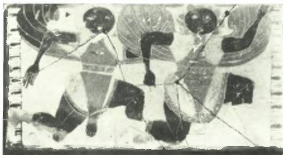
Μελανόμορφοι πίνακες ἐκ τοῦ ἱεροῦ τῆς Νύμφης.