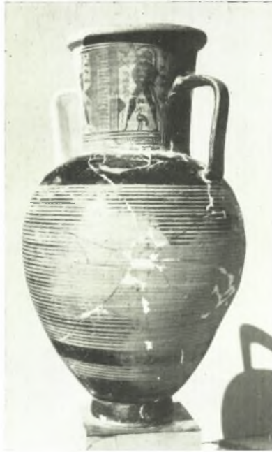
α. Γεωμετρικός ἀμφορεύς - τάφος.