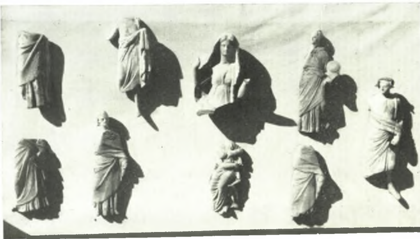
β. Εἰδώλια ἐκ τοῦ ἱεροῦ τῆς Νύμφης.