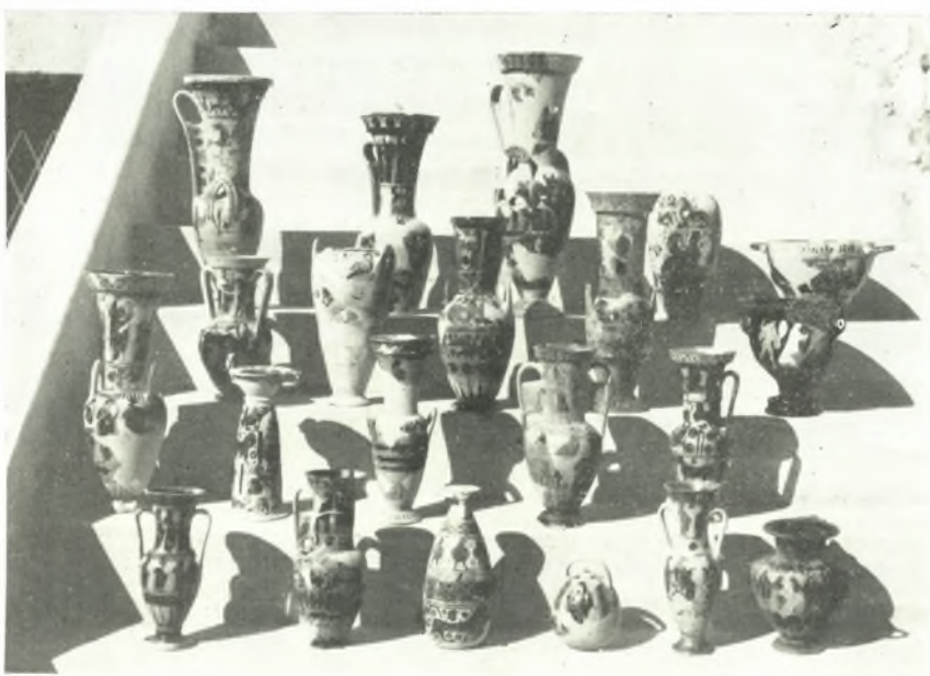
β. Ἐκλογή χορινθιακῶν καὶ μελανομόρφων ἀγγείων ἐξ τοῦ ἱεροῦ τῆς Νύμφης.