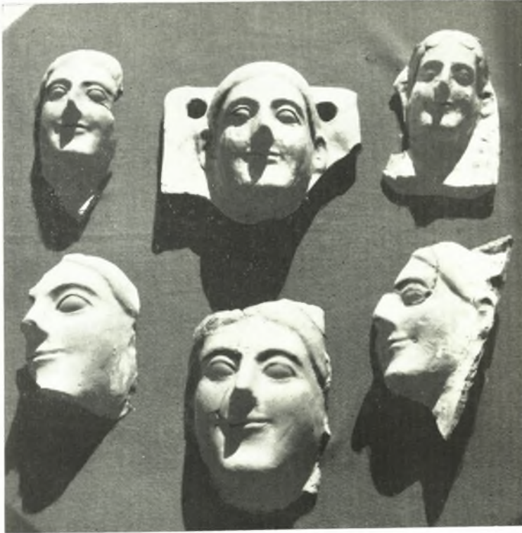
α. Ἀρχαῖκαί κεφαλαί καί πήλινα προσωπεῖα ἐκ τοῦ ἱεροῦ τῆς Νύμφης.