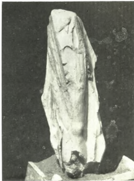
γ. Σκέλος ὑπερφυσικοῦ μαρμαρίνου ἀγάλματος