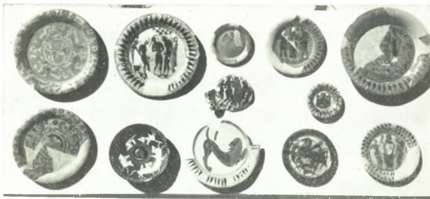
α. Πινάκια ἐξ τοῦ ἱεροῦ τῆς Νύμφης.