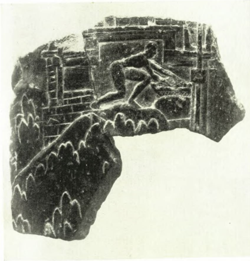
Τμήμα ανάγλυφου μινωικού αγγείου ἐκ Κνωσοῦ