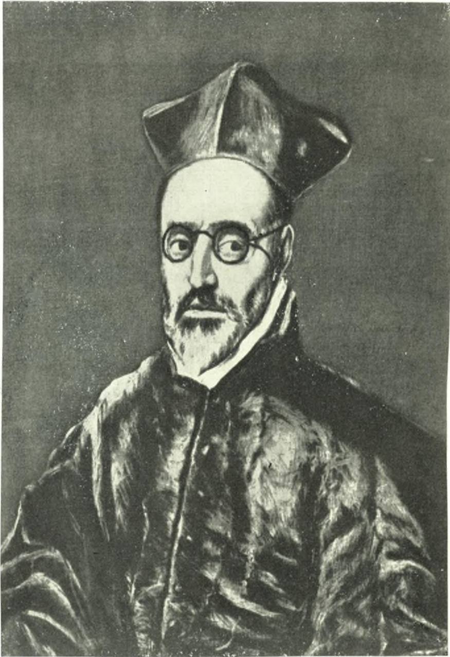
Δ. Θεοτοκόπουλος: Προσωπογραφία Καρδινάλιου Φερδινάνδου ντε Γκουεβιρα, Συλλογή Ο. Ράινχαρτ, Βίντεντσοφ, Έλβετία.