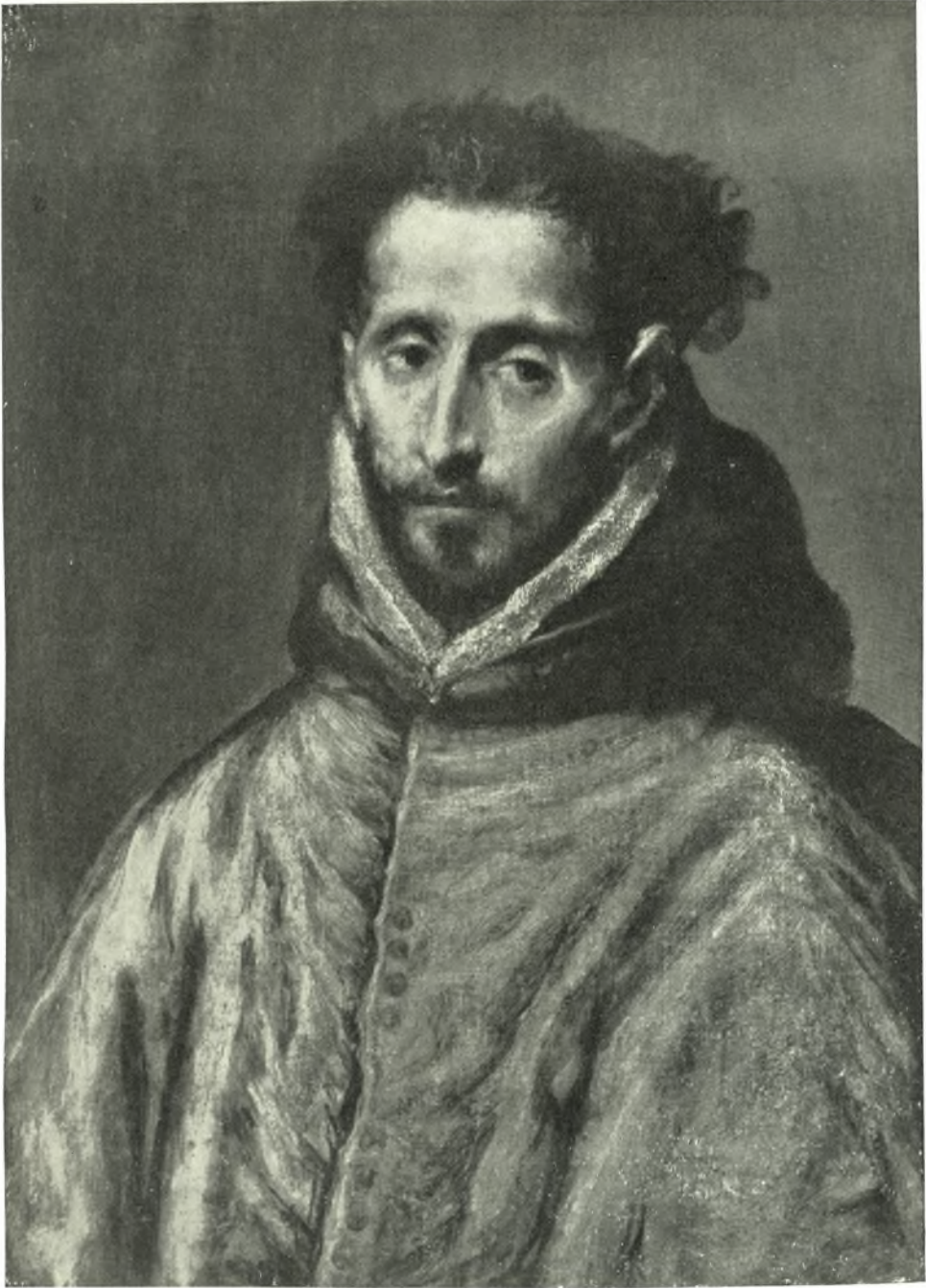
Δ. Θεοτοκόπουλος: Προσωπογραφία Καρδινάλιου, περ. 1599 - 1600, Έθνική Πινακοθήκη της Βικτόριας, Μελβούρνη