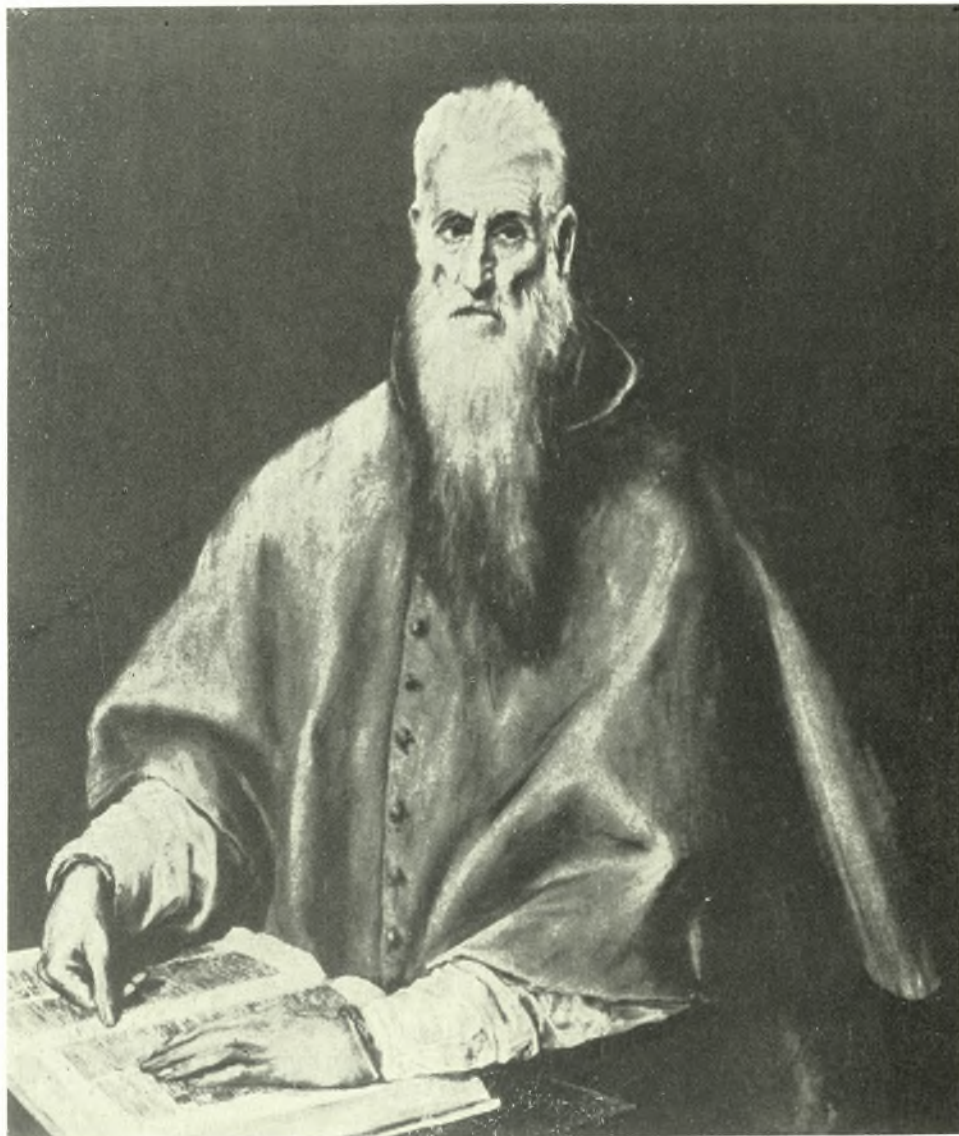
Δ. Θεοτοκοπούλο, : "Άγιος Ιερώνυμος Καρδινάλιος, περ. 1595 - 1600. Συλλογή Φρειν. Νέο Ύψρη