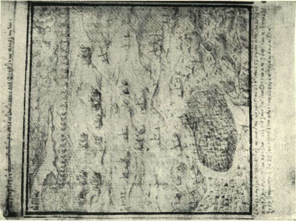
Fig. 1.—'Ολοσέλιδος εἰκὼν παριστάωσα τὸν λιμένα μετὰ τμήματος τῆς πόλεως Χάνδακος ἐκ τοῦ κώδ. Κλώντζα, σ 133 v.