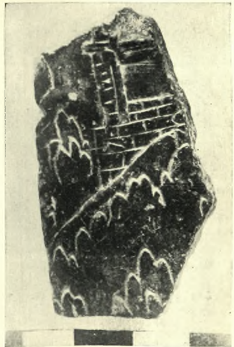
4. — Τεμάχιον ἀναγλύφου ἀγγείου ἐκ στεατίτου με παραστάσιν Ἰ. Κορυφῆς, Κνωσός.