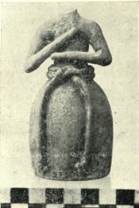
3. — Πήλινον ΜΜΙΙ εἰδῶλιον τῆς Συλλογῆς Γιαμαλάκη.