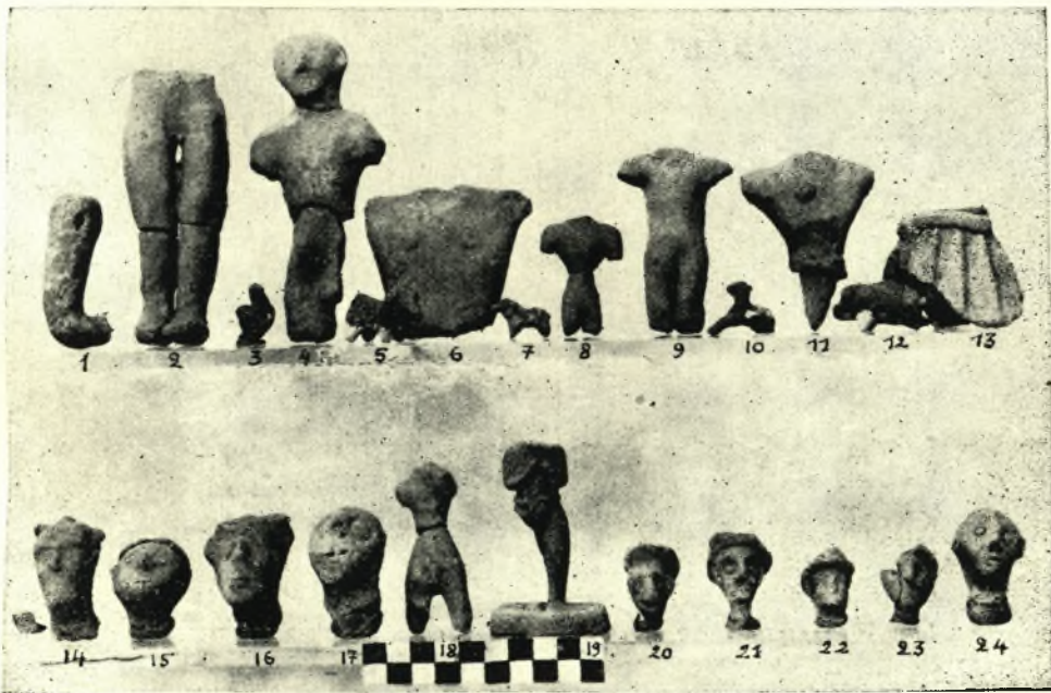
2 — Πήλινα ειδώλια και ζώδια ἐκ τοῦ Ἱεροῦ Κορυφῆς Καρφί Λασιθίου.