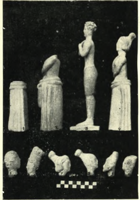
2. — Πλαγία ὄψεις πηλίνων εἰδωλίων ἐκ τοῦ Ἱεροῦ Πισκοκεφάλου