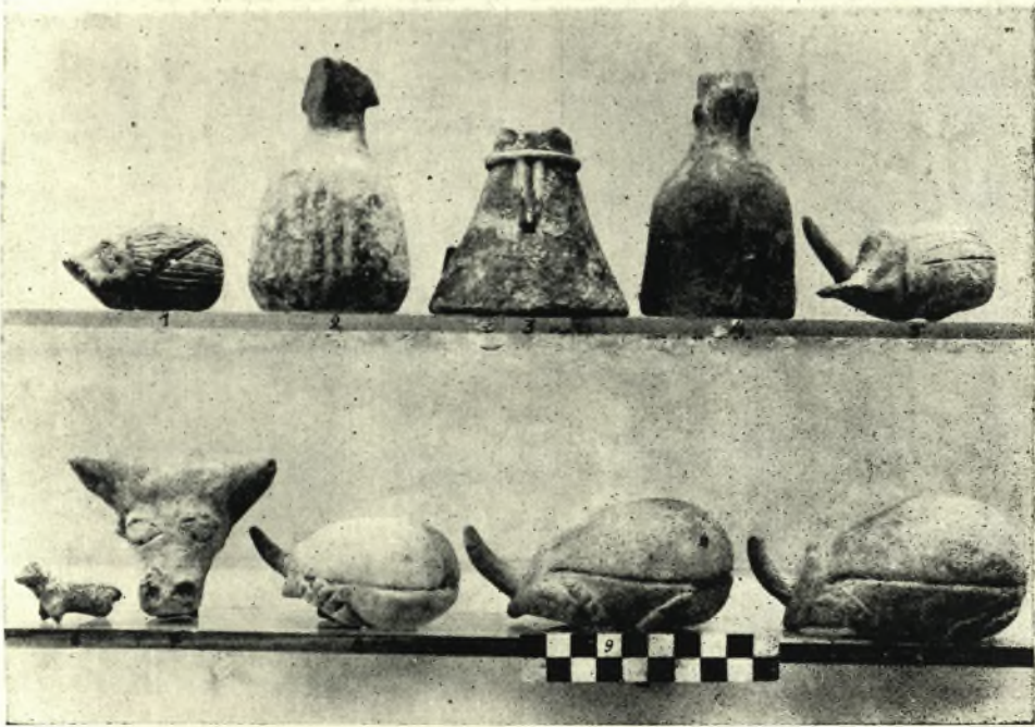
1. — Πήλινα ειδώλια και ζώδια ἐκ Πισσοκεφάλου και Παλαικάστρου.