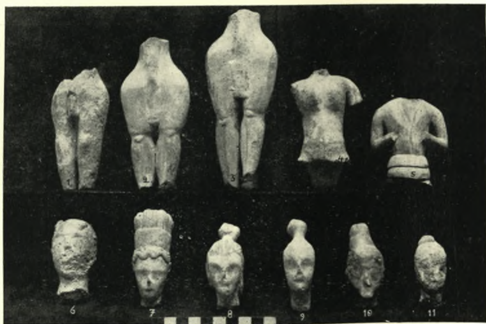
2.— Τμήματα πηλίνων ειδωλίων ἐκ τοῦ Ἱεροῦ Πετσοῦ.