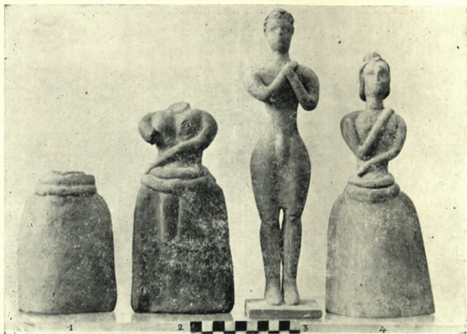
1.— Πήλινα ειδώλια ἐκ τοῦ Ἱεροῦ Πετσοῦ.