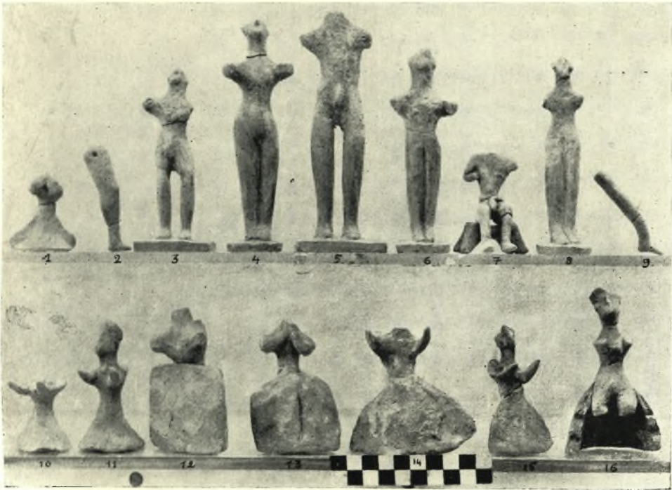
1.— Πήλινα ειδώλια ἐκ τοῦ Ἱεροῦ Μαζᾶ.