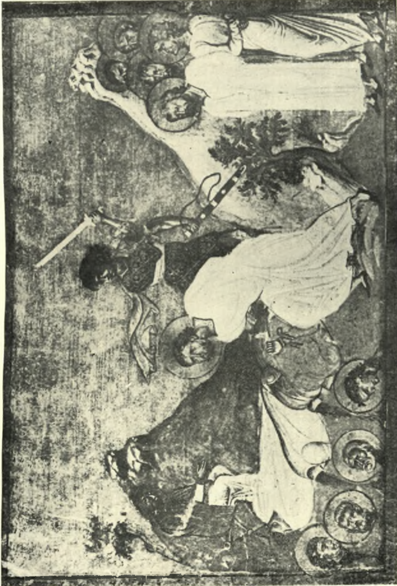
Τὸ Μαρτύριον τῶν Ἁγ. Δέξα. Μικρογραφία ἐκ τοῦ Μηνολογίου τοῦ Βασιλείου II (Cod. Vatic. Graecus 1613)