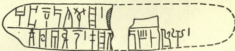
Εἰκ. 3. — Ἡ «πινακίς μὲ ὀνόματα θεῶν» ἐκ Κνωσοῦ.

Δυσκολεύομαι νὰ βεβαιώσω τὸ αὐτὸ διὰ τὴν πινακίδα τῶν ὀνομάτων τῶν θεῶν ἐκ Κνωσοῦ 12 (βλ. εἰκ. 3), πρῶτον διότι ἡ πινακίς εἶναι ἑλληνικῆς, παρέχουσα ἑλληνικὴν κατάληξιν τοῦ πα-ja-Fo καὶ τοῦ πο-σε-δα . Ἔπειτα διότι οἱ ἀναλογικὸι τύποι πο-σι-δα-ι-jo , πο-σι-δα-