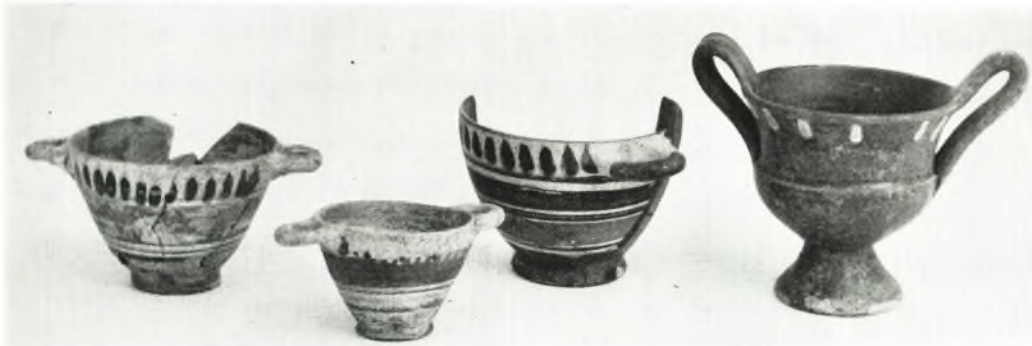
δ. Κοτυλίσσαι καὶ κανθαρίσκος ἐκ τοῦ τάφου VI.