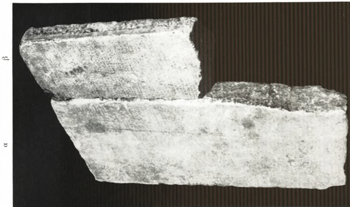
β. α = Ή εν Ι Γ Ι V 2 1, 118 επιγραφή. β = Το νέον τεμάχιον.