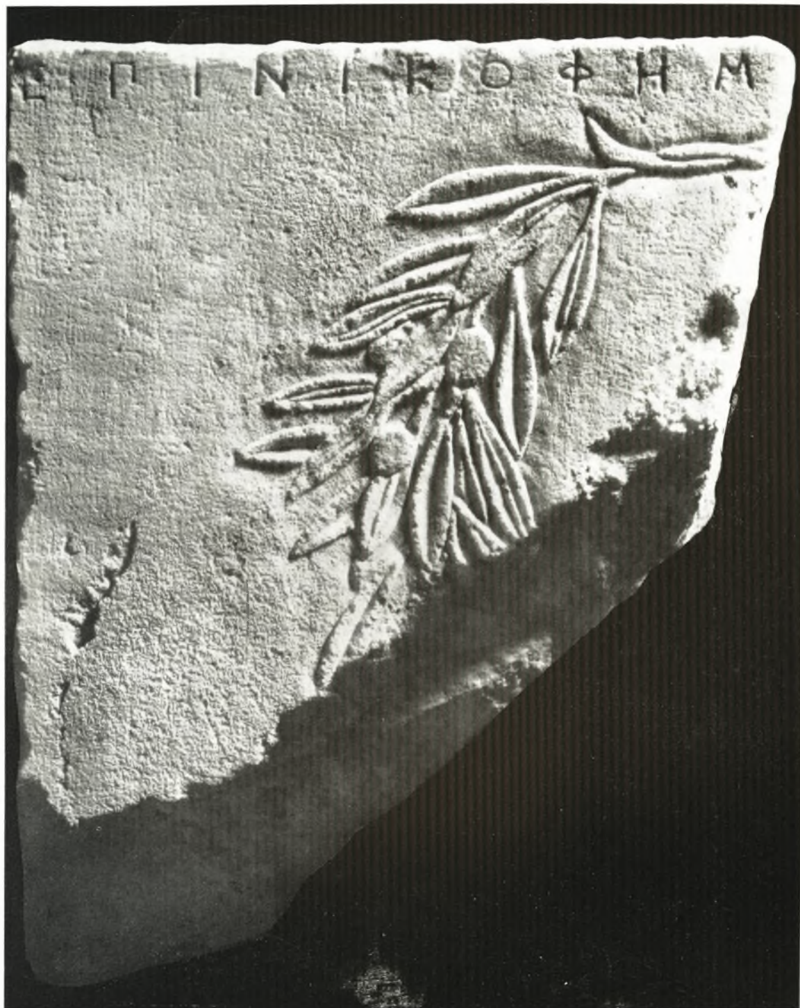
Τὸ ἄνω μέρος τῆς στήλης ἐκ τῆς ὁδοῦ Δαβάκη.