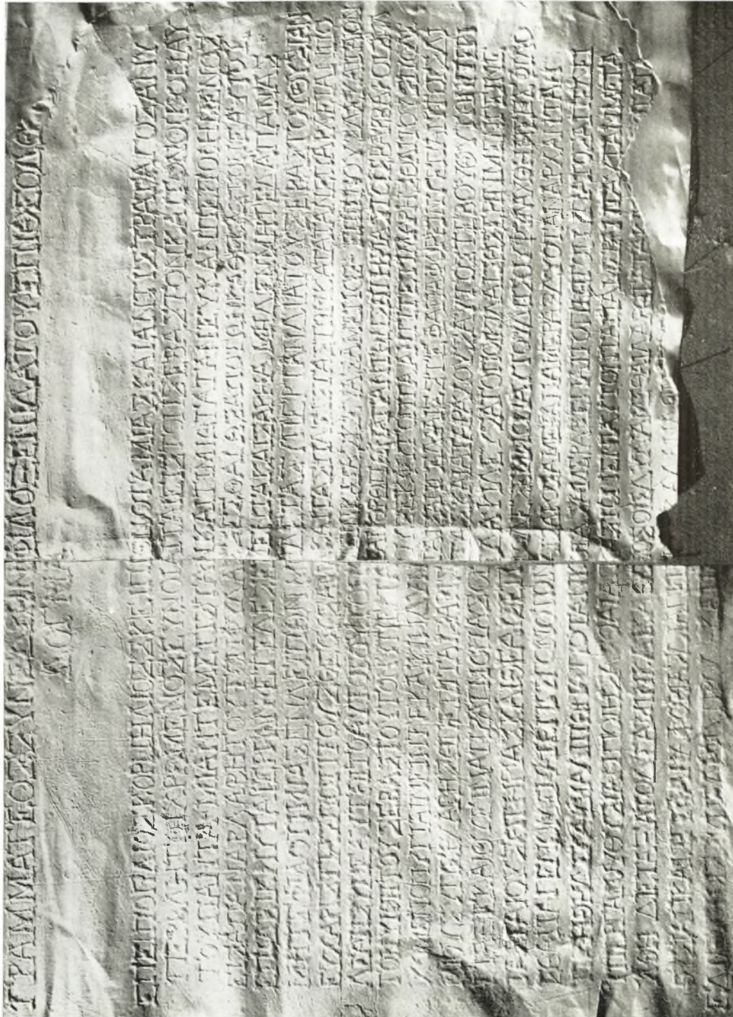
Φωτογραφία έκτρου της πρώτης επιγραφής.