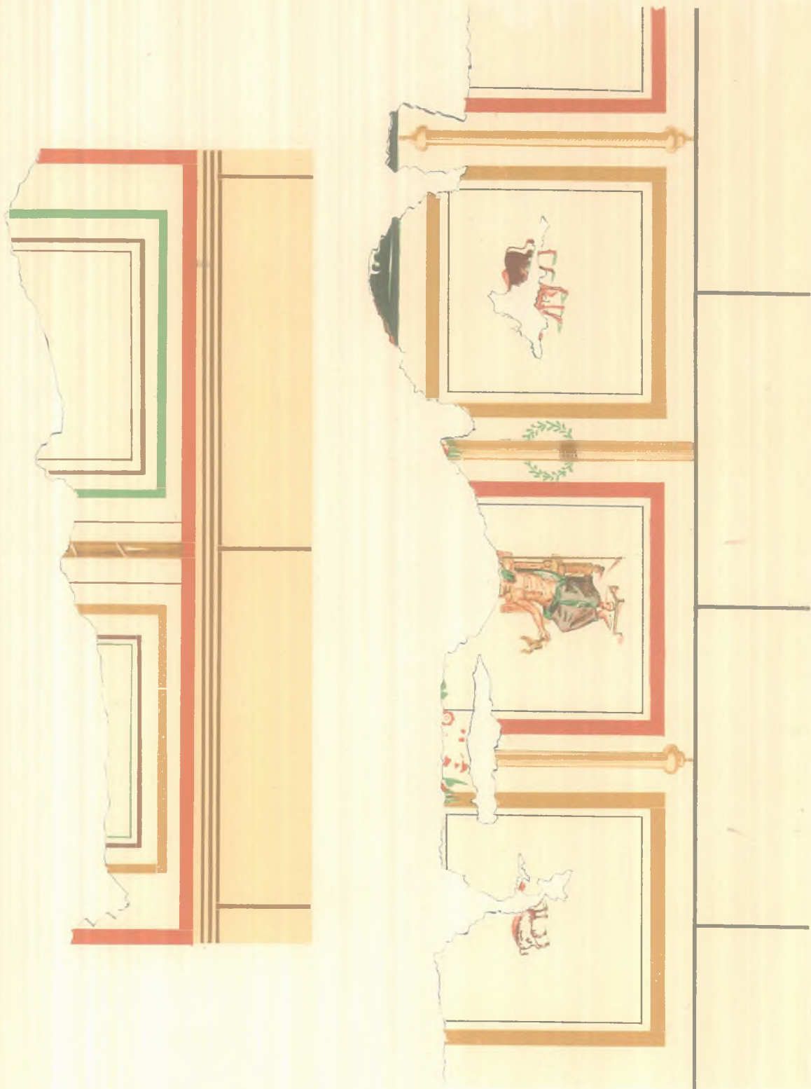
ΤΟΙΧΟΓΡΑΦΙΑΙ ΕΞ ΕΛΕΥΣΙΝΟΣ