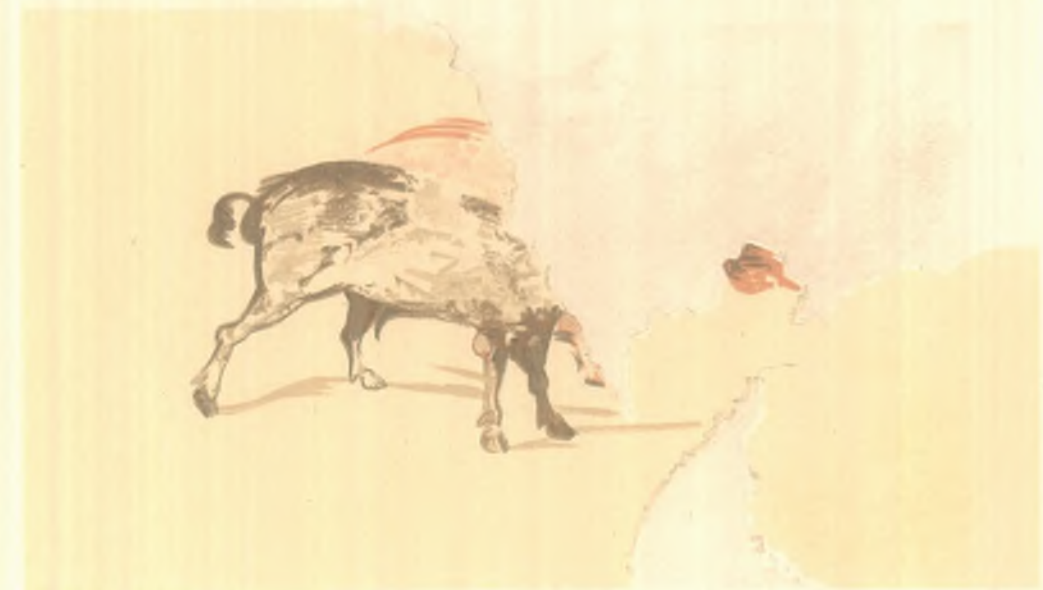
ΤΟΙΧΟΓΡΑΦΙΑΙ ΕΞ ΕΛΕΥΣΙΝΟΣ.