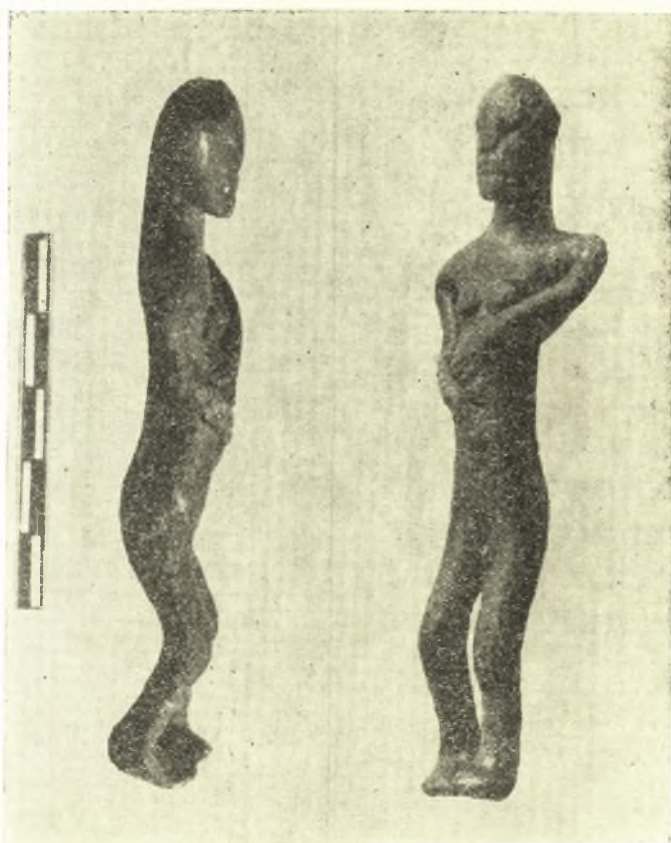
Εἰκ. 1. Χαλκοῦν εἰδώλιον ἐξ Ἀσίης.

Ὡς συμβαίνει συνήθως εἰς τὰ πρωτόγονα εἰδώλια, ἔχει δοθῆ μεγάλη προσοχὴ εἰς τὴν ἀπόδοσιν τῶν λεπτομερειῶν τοῦ φύλου, ἄνευ ὅμως τῆς ἰδιαίτερας ἐξάρσεως αὐτῶν, ἧτις παρατηρεῖται εἰς ἕνια τῶν παρουσιαζόντων γυμνὴν θεάν. Μόνη ἢ θέσις τῶν χειρῶν καὶ ἡ ἐλαφρὰ πρότασις τῆς κοιλίας προσδίδουσιν ἔμφασιν εἰς τὴν περιοχὴν αὐτὴν τοῦ σώματος.