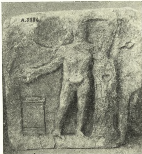
Εἰκ. 3. Ἀνάγλυφον Ἡρακλέους τοῦ Μουσείου τῆς Δήλου.

Χαρακτηριστικῶς ὁμοία εἶναι ἢ παράστασις αὐτοῦ ἐπὶ μεταγενεστέρου ἀνα- γλύφου τῆς Δήλου (ἀριθ. 3184). Εἰς