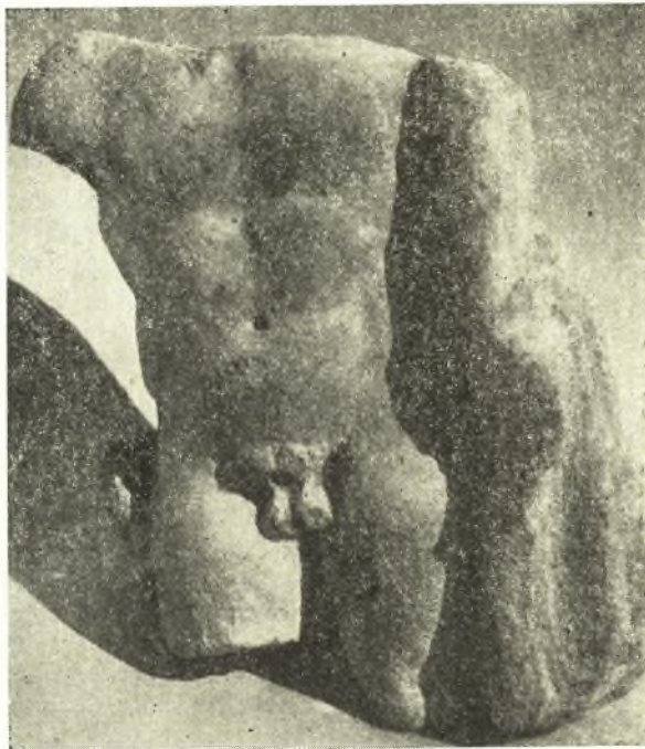
Εἰκ. 2. Θραῦσμα ἀγάλματος Ἡρακλέους ἐν Δήλῳ.

Ἡ καθ' ὅλοκληρίαν σχεδὸν ἔλλείπουσα δεξιὰ χεὶρ ἐφέρετο πρὸς τὰ ὀπίσω καὶ ἔμπρὸς. Ὁ Ἡρακλῆς στηρίζεται ἐπὶ τοῦ ἀριστεροῦ σκέλους, μὲ ἀνετον τὸ δεξιόν, φερόμενον πρὸς τὰ ἔμπρὸς καὶ ἔξω, ὡς ἐπιτρέπει νὰ εἰκάσωμεν τὸ ἄγαλμα ὀρώμενον ἐκ τῶν ὀπισθεν. Τὸ περίγραμμα τῆς κοιλίας, ὡς καὶ ἡ βουβωνικὴ γραμμὴ εἶναι ἐντόνως τονισμένα, ὡς ἐπίσης καὶ τὸ στήθος. Παρ' ὅλον ὅτι ὁ κορμὸς εἶναι ἐπίπεδος καὶ ἡ ὀπισθία πλευρὰ ἀδρῶς εἰργασμένη, ὅμως εἶναι φανερὰ ἡ τάσις τοῦ καλλιτέχνου πρὸς στρογγυλοποίησιν, ἢ ὅλη δὲ ἐργασία εἶναι ξηρὰ καὶ χωρὶς μεγάλην προσπάθειαν ἐπιτεύξεως ἀπαλῆς ἐπιφανείας.