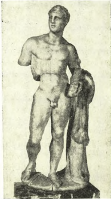
Εἰκ. 1. Ἀγαλμάτιον Ἡρακλέους ἐν Λούβρω.

τοῦ Μουσείου τοῦ Λούβρου 1 (εἰκ. 1). Πρόκειται περὶ ἀγαλματίου Ἡρακλέους, νέου, γυμνοῦ, ὀρθίου φέροντος ρόπαλον καὶ λεοντὴν ἀκριβῶς κατὰ τὸν τύπον τοῦ ἡμετέρου. Προέρχεται ἐκ Σμύρνης. Τοῦτο διατηρεῖται μᾶλλον καλῶς. Ἐλλείπει ἡ δεξιὰ χεὶρ ἐκ τοῦ μέσου τοῦ βραχίονος, ἐνῶ διὰ τῆς στηριζομένης ἐπὶ ὑποστηρίγματος ἀριστερᾶς κρατεῖ τὴν λεοντὴν καὶ τμήμα μόνον τοῦ ροπάλου, ὅπερ ἐστηρίζετο ἐπὶ τοῦ ὁμωνύμου βραχίονος, σωζομένου ἐπ' αὐτοῦ ἐνὸς τμήματος τοῦ σημείου συνδέσεως καὶ στηρίξεως. Ἡ κεφαλὴ στρέφεται πρὸς τὰ δεξιὰ, δηλ. πρὸς τὸ ἄνετον σκέλος. Ἔργασία ἀδρὰ χαρακτηρίζει τὸ ὅλον ἔργον καὶ εἰς τὰς λεπτομερείας, ἐν ἀντιθέσει πρὸς τὸν Ἡρακλέα τῆς Μυκόνου, ὅστις εἶναι λίαν ἐπιμελημένης ἐργασίας, ἐπιβαλλομένης καὶ ἐκ τοῦ σχεδὸν φυσικοῦ μεγέθους.