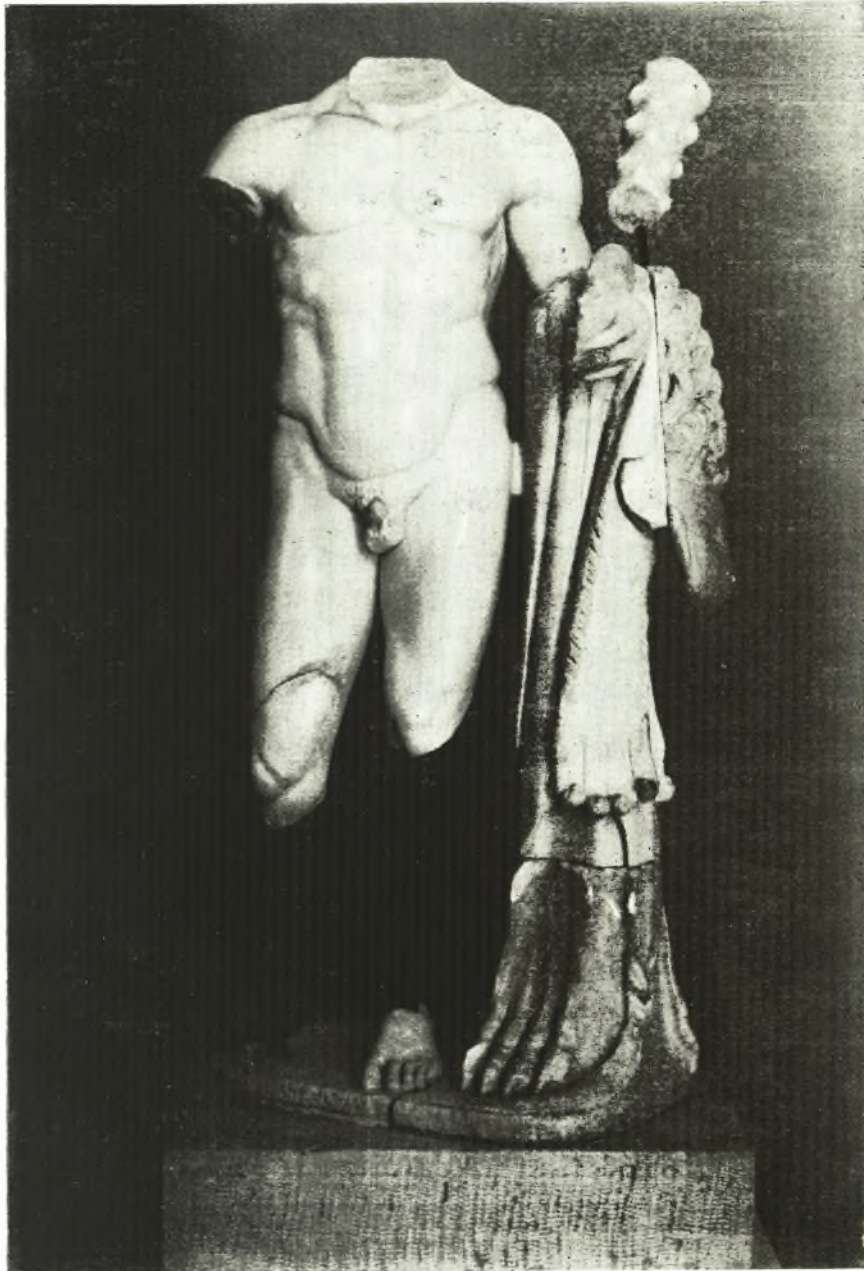
Ἄγαλμα Ἡρακλέους ἐν τῷ Μουσεῖῳ τῆς Μυκόνου (ἐκ Ρηγείας).