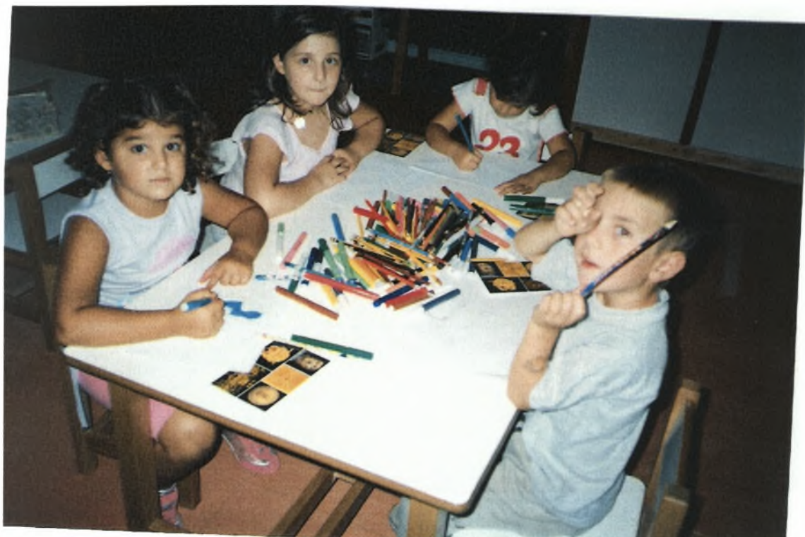
Κουκλοθέατρο: δραστηριότητα εμπέδωσης της δεύτερης ομάδας.