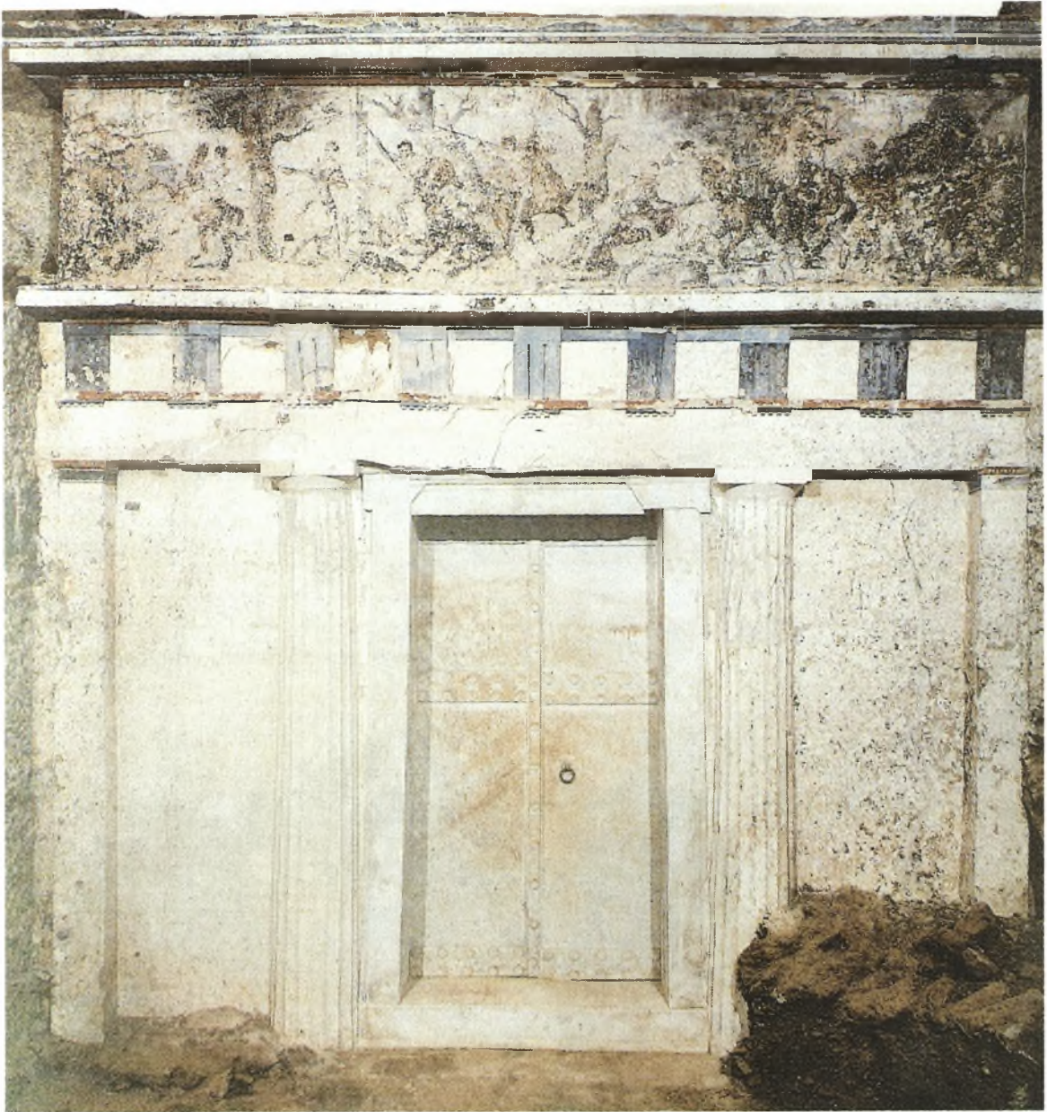
Η χρυσή λάρνακα του Φιλίππου Β΄