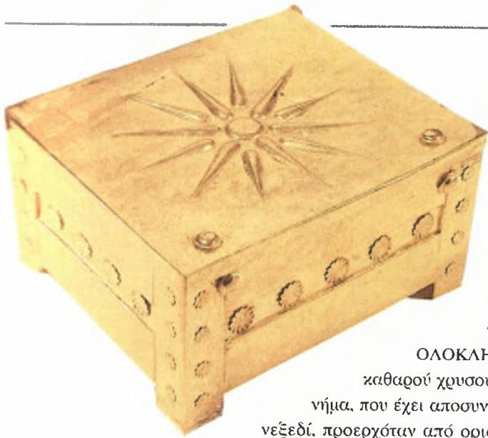
9 κ α κος ΟΛΟΚΛΗΡΟ καθαρού χρυσού. Π νήμα, που έχει αποσυντεθ νεξεδί, προερχόταν από ορισμέ προσώπων ήταν η Τύπος της Φρουά

Το πορφύρο και κεντημένο με χρυσές κλωστές ύφασμα, στο οποίο ήταν τυλιγμένα τα οστά της νεαρής γυναίκας.