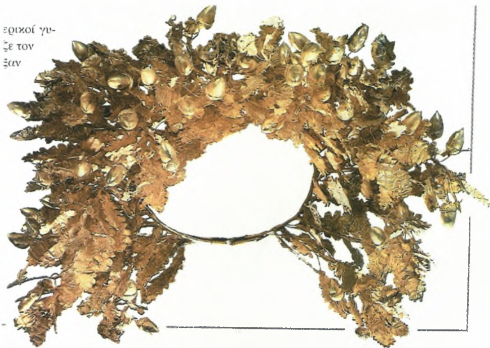
Το χρυσό στεφάνι από άνθη και καρπούς βελανιδιάς