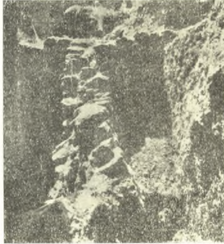
Εἰκ. 3. Τὸ βόρειον σκέλος τοῦ Β ἀπὸ Βορρᾶ.

2. Ἡ πέρουσιν ἀποκαλυφθεῖσα, ὑπόγειος αἴθουσα (ΠΑΕ 1949, σ. 45, εἰκ. 2, Γ) ἔξεκενώθη ἐφέτος τῆς γομώσεως αὐτῆς, ἥτις μικρὸν ἀπέιχε τῆς ὄρο-