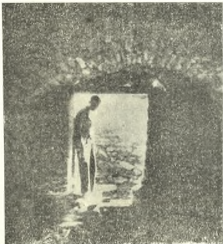
Εἰκ. 7. Ἡ εἴσοδος τῆς ὑπογείου αἰθούσης.

πάχος 0,03 μ. περίπου) καὶ καλύπτονται κατὰ τὴν ράχιν διὰ καλυπτήρων κεράμων (εἰκ. 8), τῶν ὁποίων τὸ μεγαλύτερον τεμάχιον ἔχει διαστάσεις