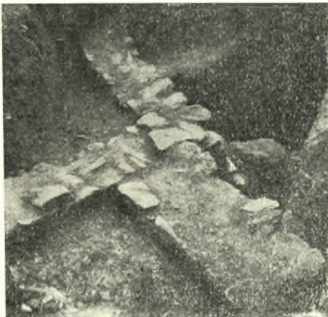
Εἰκ. 1. Τὸ συγκρότημα τῶν ἀποκαλυφθέντων τοίχων Α καὶ Β.

Αἱ συνεχισθεῖσαι ἐφέτος ἔρευναι ἐν τῇ Μ. Καισαριανῆς ἀπέβλεπον εἰς πληρεστέραν ἀποκάλυψιν τῶν εὐρεθέντων πέρασι στοιχείων παλαιότερου οἰκοδομήματος καὶ ὑπογείου αἰθούσης.