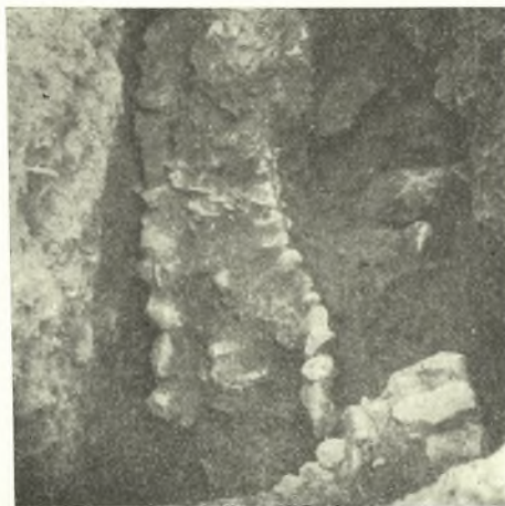
Ἄγκων τοίχου Δ

Εἰκ. 5. Τὸ βόρειον σκέλος θεώμενον ἐκ τῶν ἄνω ἀπὸ Βορρᾶ, εἰς τὸ σημεῖον συναντήσεως μετὸν Ἄ.