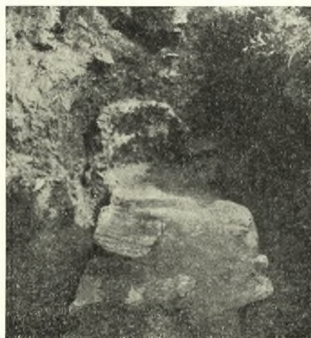
Εἰκ. 2. Τὸ νότιον σκέλος τοῦ Β μετὰ τοῦ λουτροειδοῦς κοιλώματος.

1. Ἐκ τῶν ἐν ΠΑΕ 1949, σ. 45, εἰκ. 2, σημειουμένων τοίχων ὁ Α ἀπεκαλύφθη μέχρι τοῦ σημείου συναντήσεως μετὰ τὸ κτίριον Β, διαγράφων ἑλαφρὰν καμπύλην (εἰκ. 1). Ἐκ τοῦ Β τὸ ἀνατολικὸν σκέλος, τὸ ἔχον πᾶχος 0,95, ἀπεκαλύφθη βαῖνον μέχρι τοῦ ἀνατολικοῦ περιβόλου τῆς Μονῆς, ὅστις ἐδράζεται ἐπ' αὐτοῦ, ἐκεῖ δὲ κάμπτεται εἰς γωνίαν περίπου ὀρθὴν μετὰ κατεύθυνσιν ΝΑ. Ἐξω τοῦ περιβόλου μικρὸν μόνον τμήμα αὐτοῦ ἀπεκάλυψα, εὐρισκόμενον εἰς βάθος 5,50 μ. περίπου ὑπὸ τὸ κατὰστρωμα τῆς πλατείας, δεικνύον ὅτι τὸ κτιριακὸν αὐτὸ συγκρότημα ἐπεκτείνεται ὑπὸ τὴν σημερινὴν πλατεῖαν.