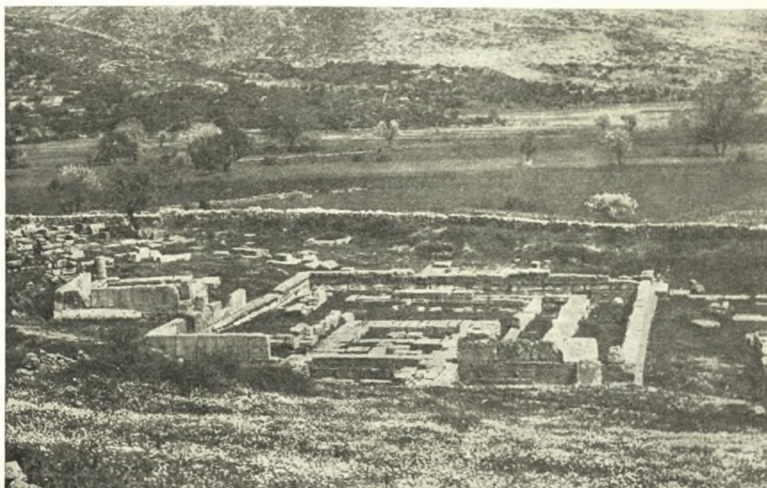
Εἰκ. 17. Ἡ ἱερὰ οἰκία (Ε 1 ), ὁρωμένη ἀπὸ Β. Ἀριστερᾷ οἱ ναοὶ Θ, Α μετὰ ἐρειπίων τῆς βασιλικῆς Β.

Τὸ ἐν τῷ μέσῳ τοῦ Ἱεροῦ μέγα οἰκοδόμημα Ε 1 (εἰκ. 17), εὐθὺς ἀμέσως διακρινόμενον καὶ ἐκ τοῦ μεγέθους αὐτοῦ καὶ τῶν πολλῶν ἐν αὐτῷ παρατηρουμένων κατασκευῶν,