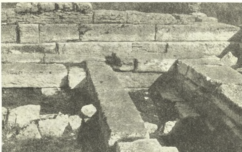
Εἰκ. 19. Τὸ Δ. ἄκρον τῆς βορείου πλευρᾶς τῆς ἑλλειπτικῆς καλύβης, τεμνόμενον ὑπὸ τοῦ μεταγενεστέρου ἰσοδομικοῦ τοίχου.

Ἀναμφιβόλως ἡ σφρζομένη σειρὰ τῶν λίθων δὲν προωρίζετο νὰ βαστάξῃ τοῖχον, ἀλλὰ πρόκειται περὶ πλακῶν, αἱ ὁποῖαι ἐτοποθετήθησαν ἐκεῖ, ἵνα προστατευθῇ ἡ βόρειος πλευρὰ τῆς καλύβης, ἡ ἐκτεθειμένη εἰς τὰ ἐκ τῆς ἀνωφερείας τοῦ λόφου κατερχόμενα