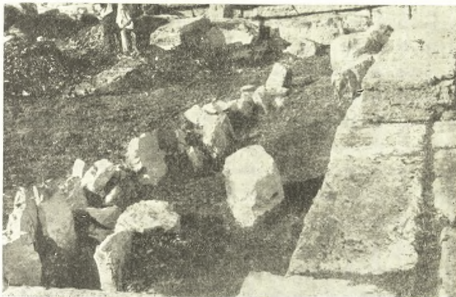
Εἰκ. 18. Λεῖψανα τῆς ἐλλειπτικῆς καλύβης.

Κατὰ τὸ ΝΔ. τμήμα τοῦ ὑπαίθρου χώρου (ἀβάτου) τοῦ οἰκοδομήματος Ε 1 ἀπεκαλύφθη, ὡς ἤδη εἴπομεν, σειρὰ πλακοειδῶν ἀσβεστολίθων, ἐμπεπηγμένων καθέτως ἐπὶ τοῦ στερεοῦ ἑδάφους μὲ κατεύθυνσιν Α. - Δ., διαγράφουσα πλευρὰν καμπυλόγραμμον ἀσυμμέτρου ἐλλείψεως, μήκους 8.40 μ. (πίν. 2, κ-κ 1 - κ 5 , εἰκ. 18, 25, 33-34). Οἱ περισσότεροι τῶν λίθων εἶναι ἀκανόνιστοι, τυχαίως ληφθέντες, τινὲς ὁμῶς προέρχονται ἐκ προγενεστέρως χρήσεως, διότι φέρουν ἔχνη λιθουργίας. Δύο μάλιστα διατηροῦν αὐ-