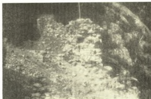
Εἰκ. 5. Ἡ βορεία παραστάς τοῦ πυλῶνος τοῦ φρουρίου τοῦ Πυλαίου, ἐν ᾗ διακρίνεται ἡ ὁπὴ τοῦ ἀσφαλιστικοῦ μανδάλου.

τὰς χώρας ἢ τὰς ἐπαρχίας, ἐν αἷς τὰ φρούρια ταῦτα ἔχουσιν ἰδρυθῇ, ἐκτὸς δὲ τούτου τὰ πλεῖστα εἰλημμένα ἐκ τῆς Λατινικῆς ἢ ὄντα Λατινικὰ τοπωνύμια ἐκ κακῆς ἢ ἀστοχῆς μεταφορᾶς αὐτῶν εἰς τὴν ἑλληνικὴν παραμένουσιν ἀσαφῇ καὶ