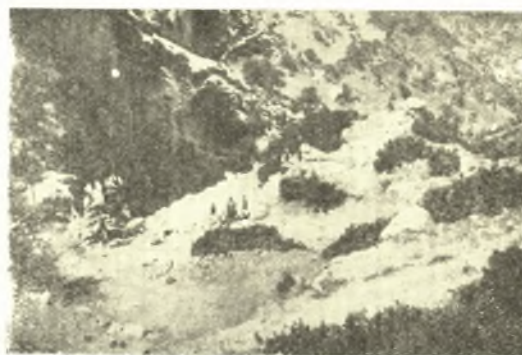
Εἰκ. 4. Τὰ ἐρείπια τῆς «Πόρτας» τοῦ φρουρίου τοῦ Πυλαίου. Ἀποψὶς ἀπὸ ΝΔ.

δρέων πόλις... Εὐρώπη». Ἀλλὰ καὶ τὸ χωρίον τοῦτο τοῦ Προκοπίου παρέχει ἀρκετὰς δυσκολίας. Ὁ συγγραφεὺς δηλ. ἀναγράφων ἐν τῷ καταλόγῳ τὰ τοπωνύμια τῶν ὑπὸ τοῦ βασιλέως ἀνεγερθέντων φρουρίων, δὲν ὁρίζει ἀκριβέστερον