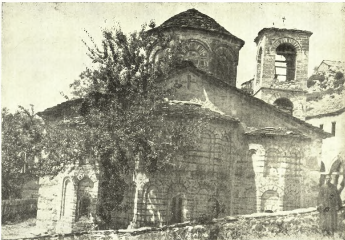
Εἰκ. 6. Ἀψὶς καὶ κόγχαι τῆς ἀνατολικῆς πλευρᾶς τοῦ Καθολικοῦ τῆς Ἱ. Μονῆς τοῦ Πυλίου.

ἐπιγραφαὶ ἡμῶν ἄρχονται διὰ τοῦ «Σταυροπήγιον ἁγιασθὲν» καὶ θὰ ἡδυνάτο τις νὰ υποθέσῃ, ὅτι τὸ καθολικὸν εἶχεν ἀνεγερθῇ παλαιότερον καὶ καθηγιαθῇ ὡς Σταυροπήγιον τὸ 1633, ἂν μὴ εἰς τὴν ἐξωτερικὴν πλευρὰν τοῦ νοτίου χώρου ἦτο ἀναγεγραμμένον διὰ κεράμων τὸ αὐτὸ ἔτος.