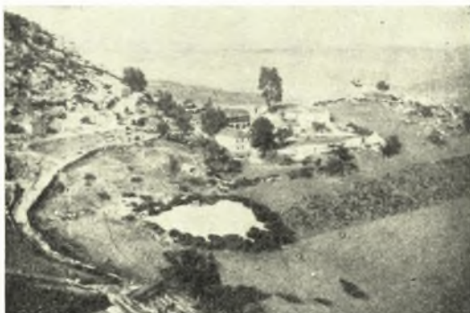
Εἰκ. 1. Ἀποψις τῆς Μονῆς Πυλαίου ἀπὸ ΝΔ.

Θέσις. Ὁ ἀπὸ Γρεβενῶν πρὸς Σαμαρίναν ὁδεύων παρὰ τὸν Γρεβενίτικον ποταμόν, παραπόταμον τοῦ Ἀλιάκμονος, συναντᾷ κατὰ τὸ 20 ον χιλιόμετρον πρὸς δυσμὰς ἓνα τῶν νοτιοανατολικῶν προβούνων τοῦ χιονοσκεποῦς τὸ πλεῖστον τοῦ ἔτους Σμόλικά (ὕψ. 2547) τῆς ὁροσειρᾶς τῆς Πίνδου, ὑψηλὸν καὶ ἀπότομον,