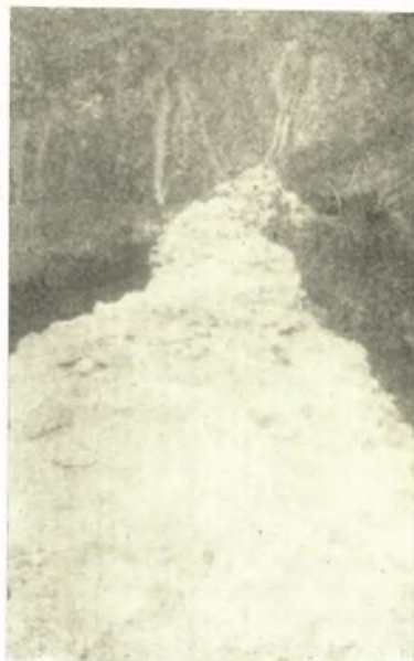
Εἰκ. 3. Ἐρείπια τοῦ τείχους τοῦ Πυλαίου παρὰ τὴν θέσιν «Τσιτσιλιᾶνος».

παρόδῳ τοῦ χρόνου καὶ ἔνεκα τοῦ ψαθυροῦ ἐδάφους ἐσχημάτισε διὰ τῶν θεμελίων του τὸ ὑψίπεδον τὸ διακρινόμενον ἐν τῇ εἰκόνι 1, ἐν ᾗ καὶ ἡ ἀπὸ ΝΔ ἀποψὶς τῆς Μονῆς. Τοιαῦτα ὑψίπεδα ἐκ τῶν αὐτῶν λόγων σχηματισθέντα σώζονται καὶ ἀλλαχοῦ ὡς ἐν Βεροίᾳ καὶ Ἐδέσσει. Τὸν ἑξωτερικὸν περίβολον ἐνίσχυνεν ἡ φυσικὴ τάφος τοῦ Γρεβενίτικου ποταμοῦ, ὅστις ῥέων κατὰ τὴν βάσιν τῶν ἡμικυκλικῶν ἢ ἐλλειψοειδῶν λίαν κατωφερῶν προπόδων τοῦ βουνοῦ περιβάλλει