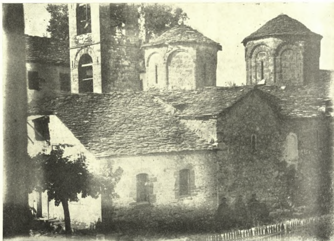
Εἰκ. 9. Τὸ καθολικὸν τῆς Ἱ. Μονῆς τοῦ Πυλαίου ἀπὸ τῆς ΝΔ πλευρᾶς.

καὶ ἐγκαρσίων καμαρῶν φέρει κατὰ τὰς τέσσαρας γωνίας ἡμισφαιρικὰς στέγας, ὡς ἐν τοῖς συγχρόνοις καθολικοῖς τῶν ἀττικῶν Μονῶν Ἀσωμάτων Πετράκη, Καρέα, Ἀστερίου (βλ. ΟΡΛΑΝΔΟΥ Εὐρετήρ. εἰκ. 158, 208, 223) ἐν Kilişéé τζαμί Κωνσταντινουπόλεως (DIEHL ἔ.ἀ.