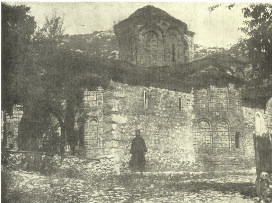
Εἰκ. 8. Κόγχαι καὶ χορὸς τῆς νοτίας πλευρᾶς καθολικοῦ τῆς Ἱ. Μονῆς τοῦ Πυλαίου.

Εἰς τὸ μέσον τῆς στέγης τῆς ἐκκλησίας ὑψοῦται ὁ πολυγωνικός, μᾶλλον ταπεινὸς τροῦλλος ἐπιμελῶς ἐκτισμένος διὰ τετραγώνων πλινθοπεριβλήτων λίθων· ἐκάστη τοῦτου πλευρὰ φέρει τυφλὸν τόξον μετὰ διπλοῦ ἄνω πλαισίου στηριζομένου εἰς τὸν κιονίσκον ἐκίστης γωνίας· εἰς