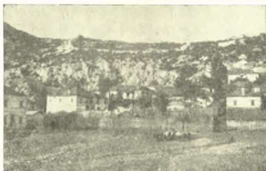
Εἰκ. 2. Ἀποψὶς τοῦ Πυλαίου ἀπὸ νότου. Ἐνωθεν τῆς κόμης τὰ εἰρήπια τοῦ Ἰουστινιανείου τείχους.

Εἰς ταῦτα θὰ ἠδύνατό τις νὰ ἀντιτείνῃ, ἐὰν στριζόμενος εἰς τὴν ὑπὸ τοῦ χαρακτοῦ σκληρὰν κακοποίησιν τῆς ὀρθογραφίας τῆς δευτέρας ἰδία ἐπιγραφῆς ἰσχυρίζετο, ὅτι, ὡς οὗτος παρασυσρθεὶς ἐκ τῆς λέξεως «ἐσταυρωμένος», ἀκουσίως ἐχάραξε τὴν λέξιν «ἐσταυροπίγιο», οὕτω καὶ μετὰ τὴν λέξιν «λεγόμενης» ἀκουσίως παρέλειψε νὰ ἐπαναλάβῃ τὸ ἀρχικὸν \Sigma τῆς ἐπομένης λέξεως «ΠΙΛΕΟΝ». Ἡ παρατήρησις δὲ αὕτη θὰ