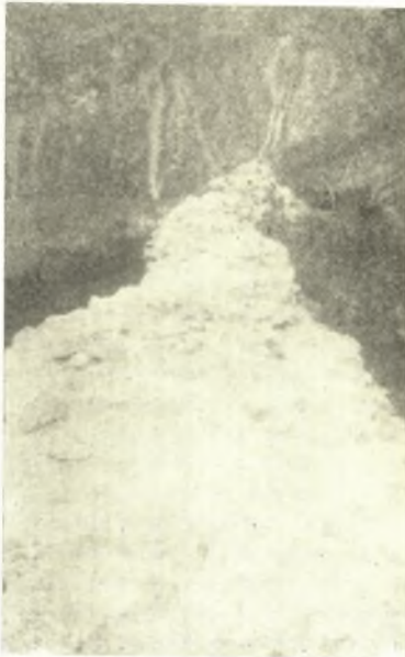
Εἰκ. 3. Ἐρείπια τοῦ τείχους τοῦ Πυλαίου παρὰ τὴν θέσιν «Τσιτσιλιᾶνος».

παρόδῳ τοῦ χρόνου καὶ ἔνεκα τοῦ ψαθυροῦ ἐδάφους ἐσχημάτισε διὰ τῶν θεμελίων του τὸ ὑψίπεδον τὸ διακρινόμενον ἐν τῇ εἰκόνι 1, ἐν ἣ καὶ ἡ ἀπὸ ΝΔ ἄποψις τῆς Μονῆς. Τοιαῦτα ὑψίπεδα ἐκ τῶν αὐτῶν λόγων σχηματισθέντα σώζονται καὶ ἀλλαγῶς ὡς ἐν Βεροία καὶ Ἐδέσση. Τὸν ἐξωτερικὸν περίβολον ἐνίσχυνεν ἡ φυσικὴ τάφος τοῦ Γρεβενίτικου ποταμοῦ, ὅστις ῥέων κατὰ τὴν βάσιν τῶν ἡμικυκλικῶν ἢ ἑλλειπσοειδῶν λίαν κατωφερῶν προπόδων τοῦ βουνοῦ περιβάλλει